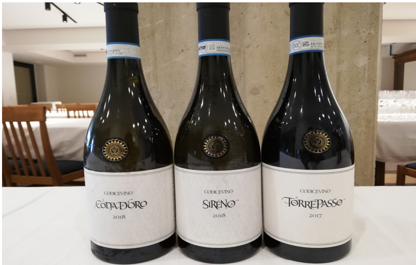
La Linea Codice d'Oro.