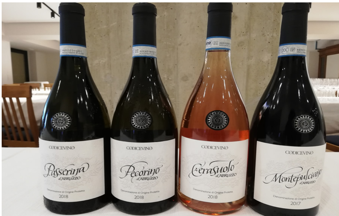
La linea I Monovarietali.