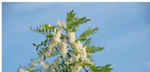
Miele di Acacia: carta d'identità