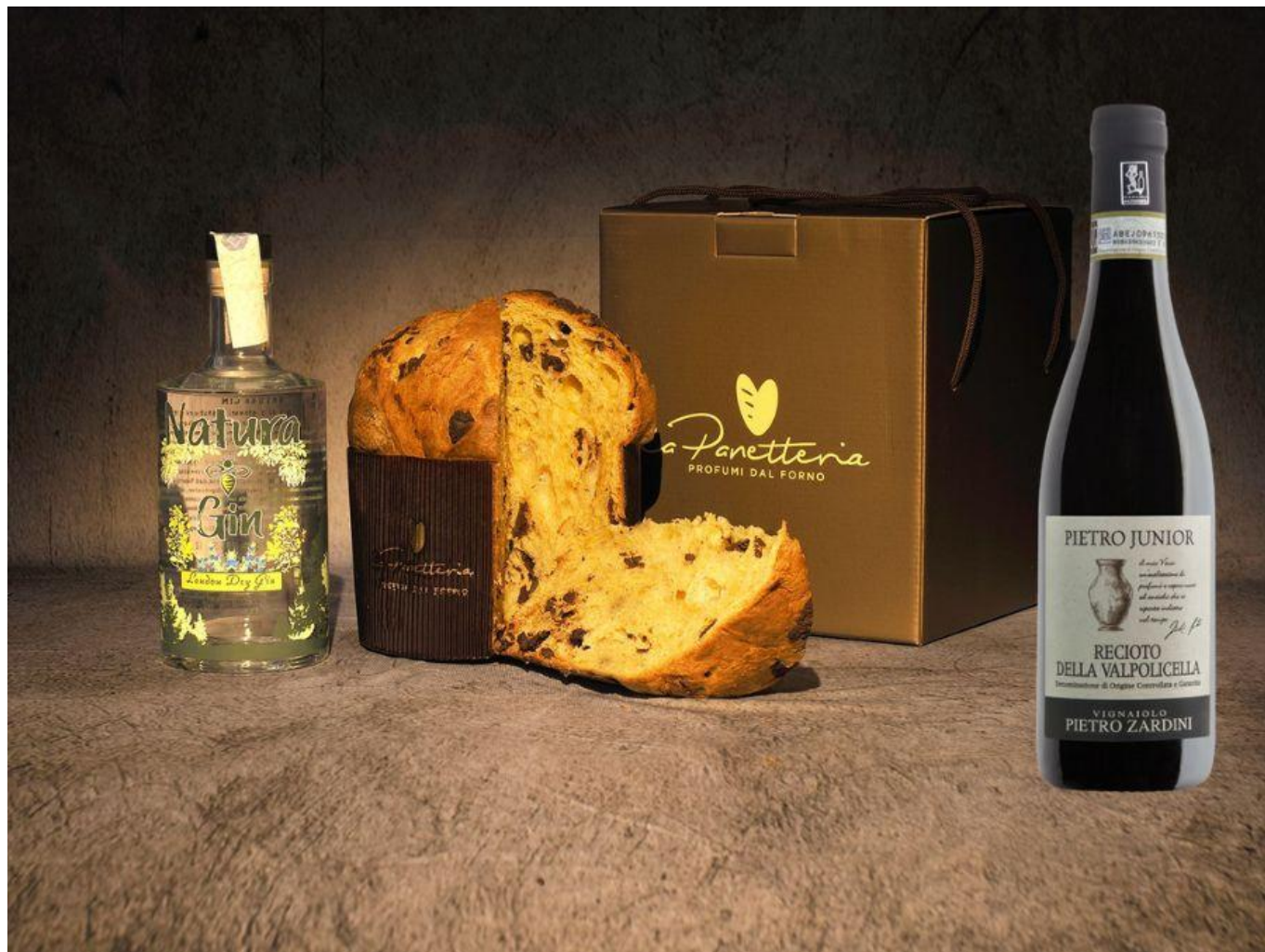
Panettone al Gin, abbinato al Recioto della Valpolicella Docg classico "Anfora".

terracotta il suo vino: un recioto morbido e vellutato, questo suo, dal caratteristico color rosso rubino e dagli ammalianti profumi di sottobosco.