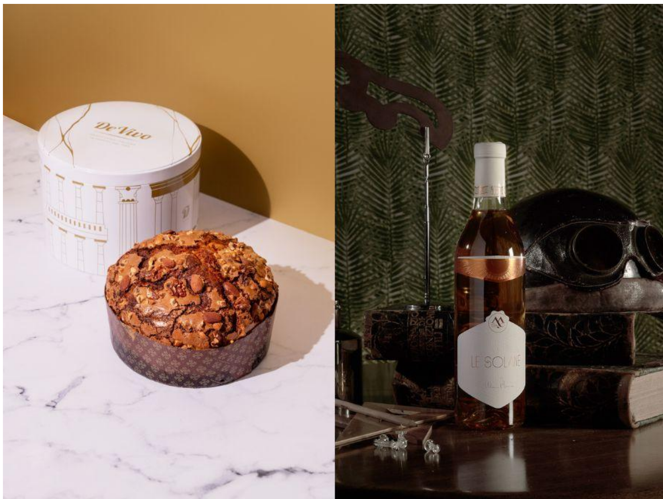
Panettone Pompeiano di pasticceria De Vivo.