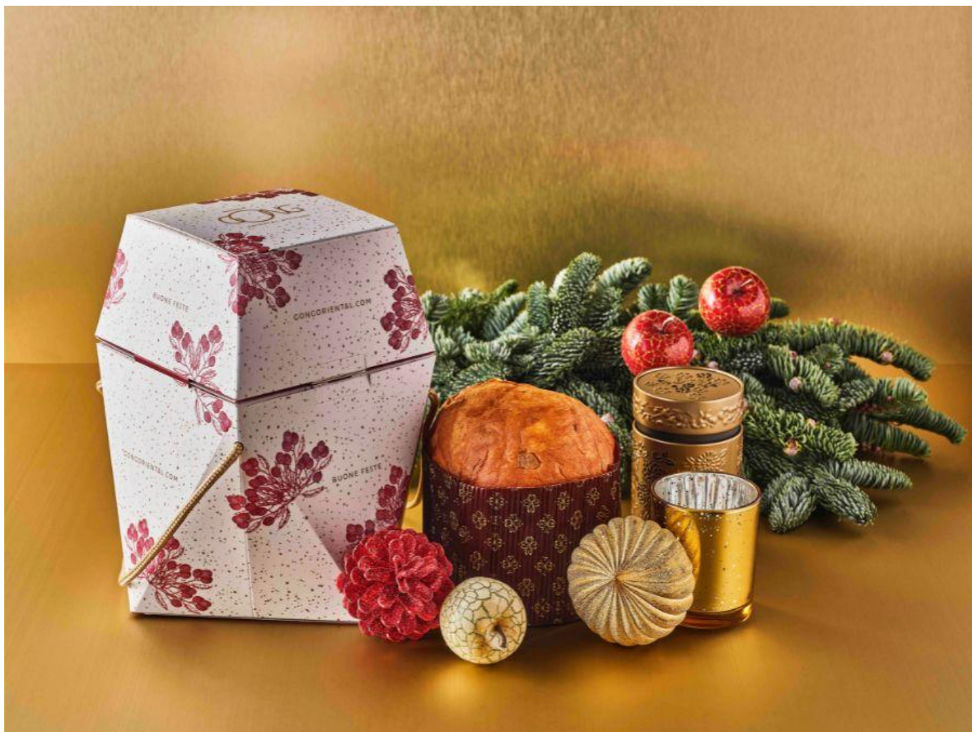
Panettone Gong, abbinato al tè biologico Lung Ching.