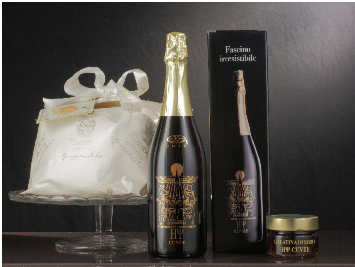
Panetto alla Birra Zago "HΨ Cuvée Rossa".