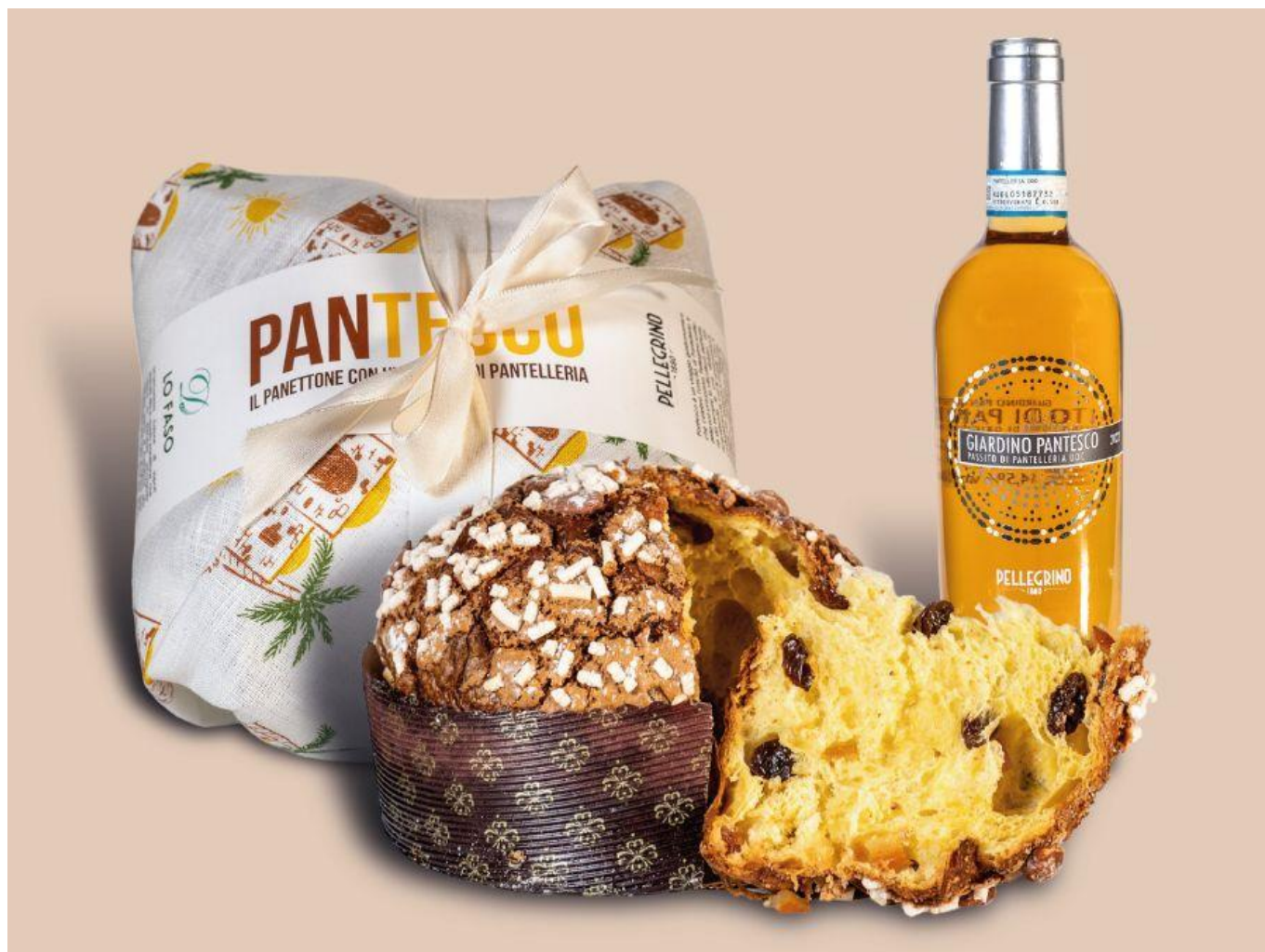
Panettone Pantesco, abbinato al Passito di Pantelleria Doc "Il Giardino Pantesco".

In abbinamento: Passito di Pantelleria Doc "Il Giardino Pantesco" 2022, Cantine Pellegrino 1880 . Frutta secca e candita insieme a note di albicocca e fico secco per questo vino dolce, intenso ma mai stucchevole.