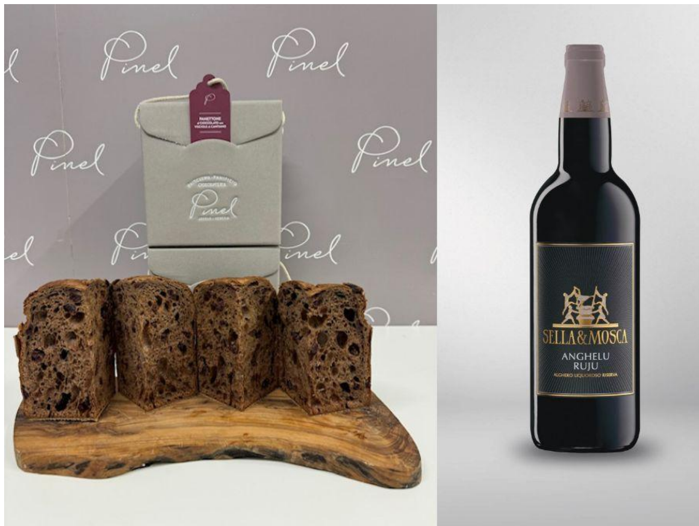
Panettone al cioccolato con visciole di Cantiano.