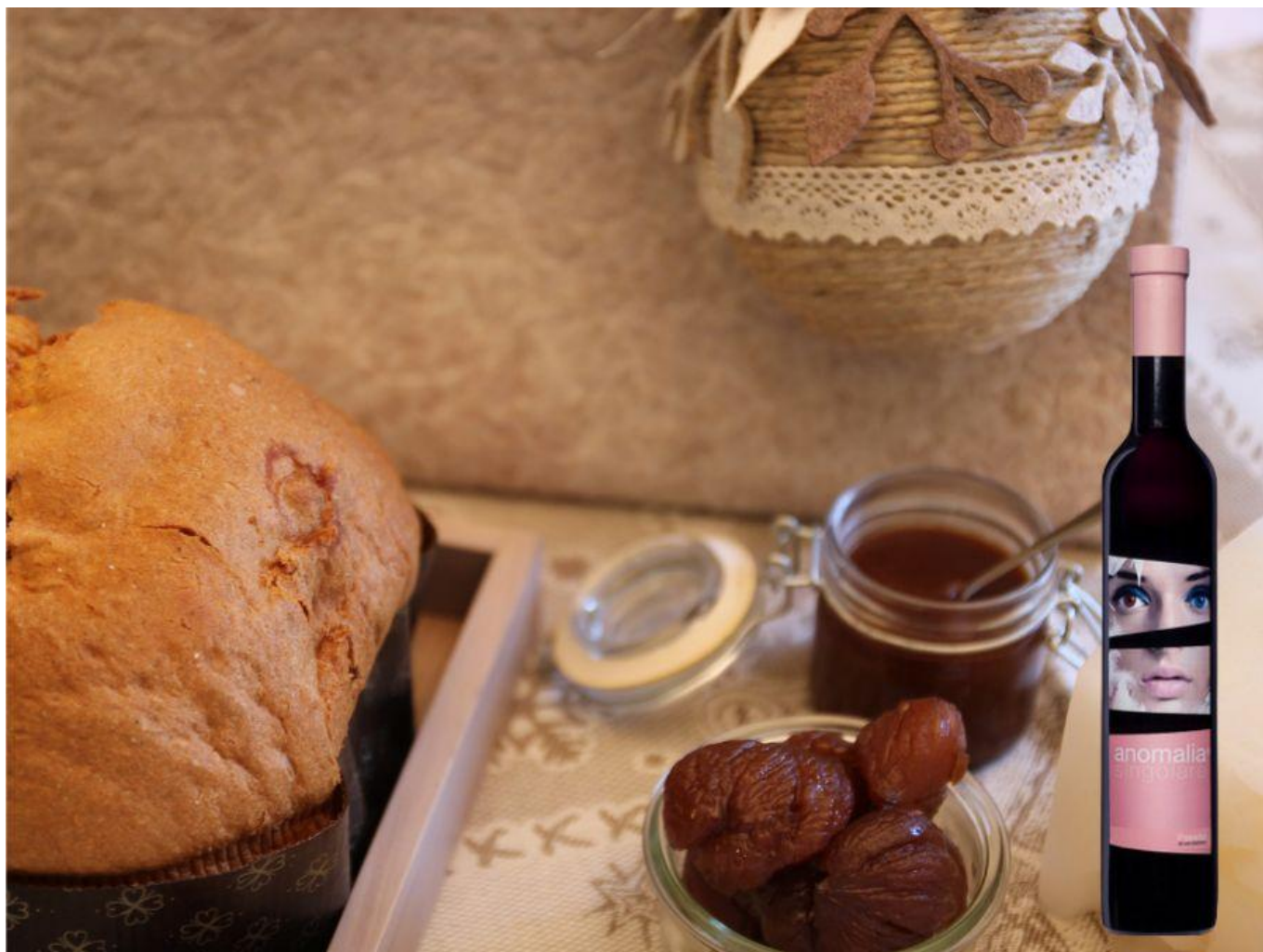
Il Castagnetta, dolce della tradizione contadina valtellinese.