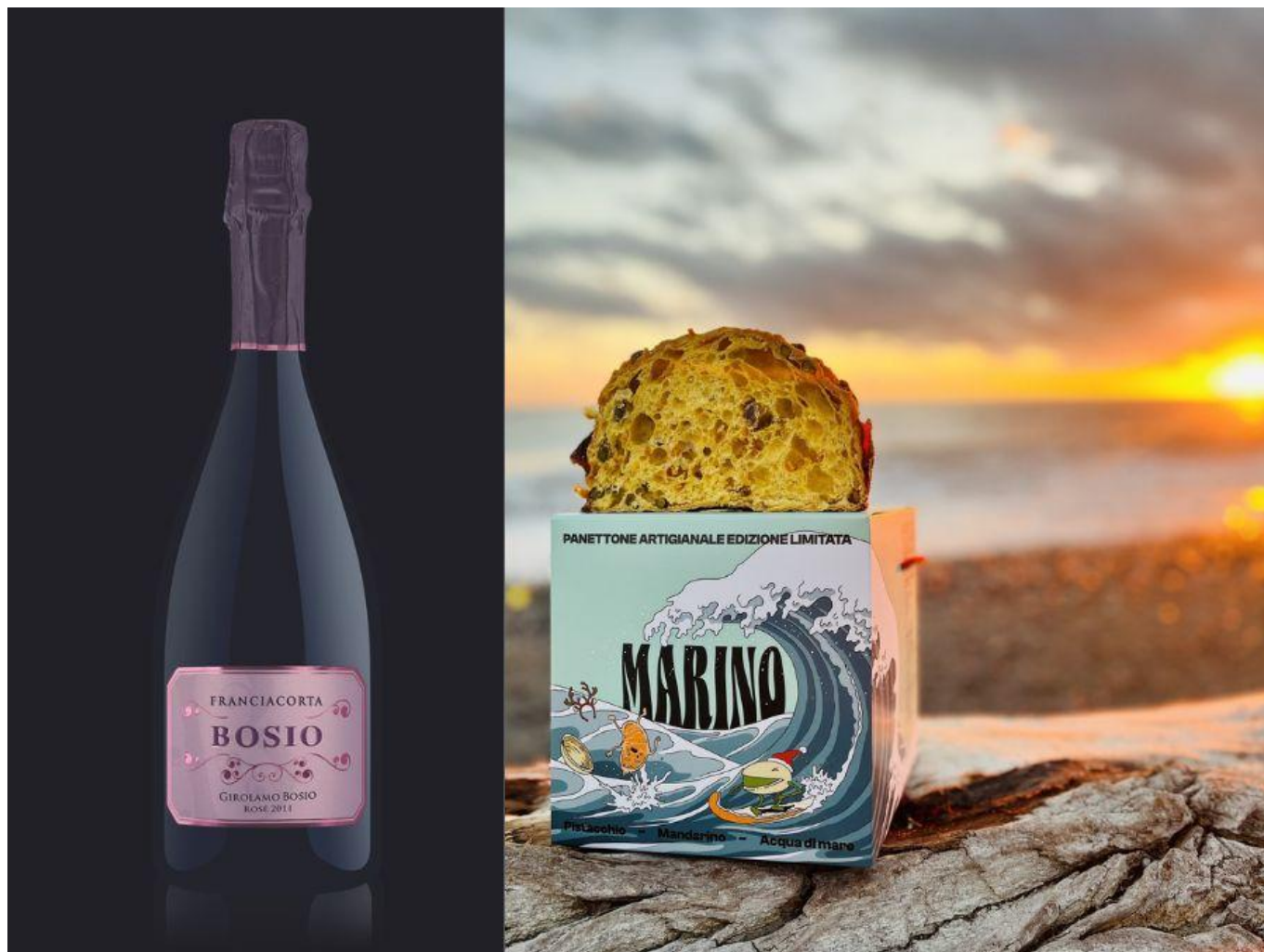
Panettone Marino, abbinato Franciacorta Riserva Rosé, Docg Girolamo Bosio (Bosio).