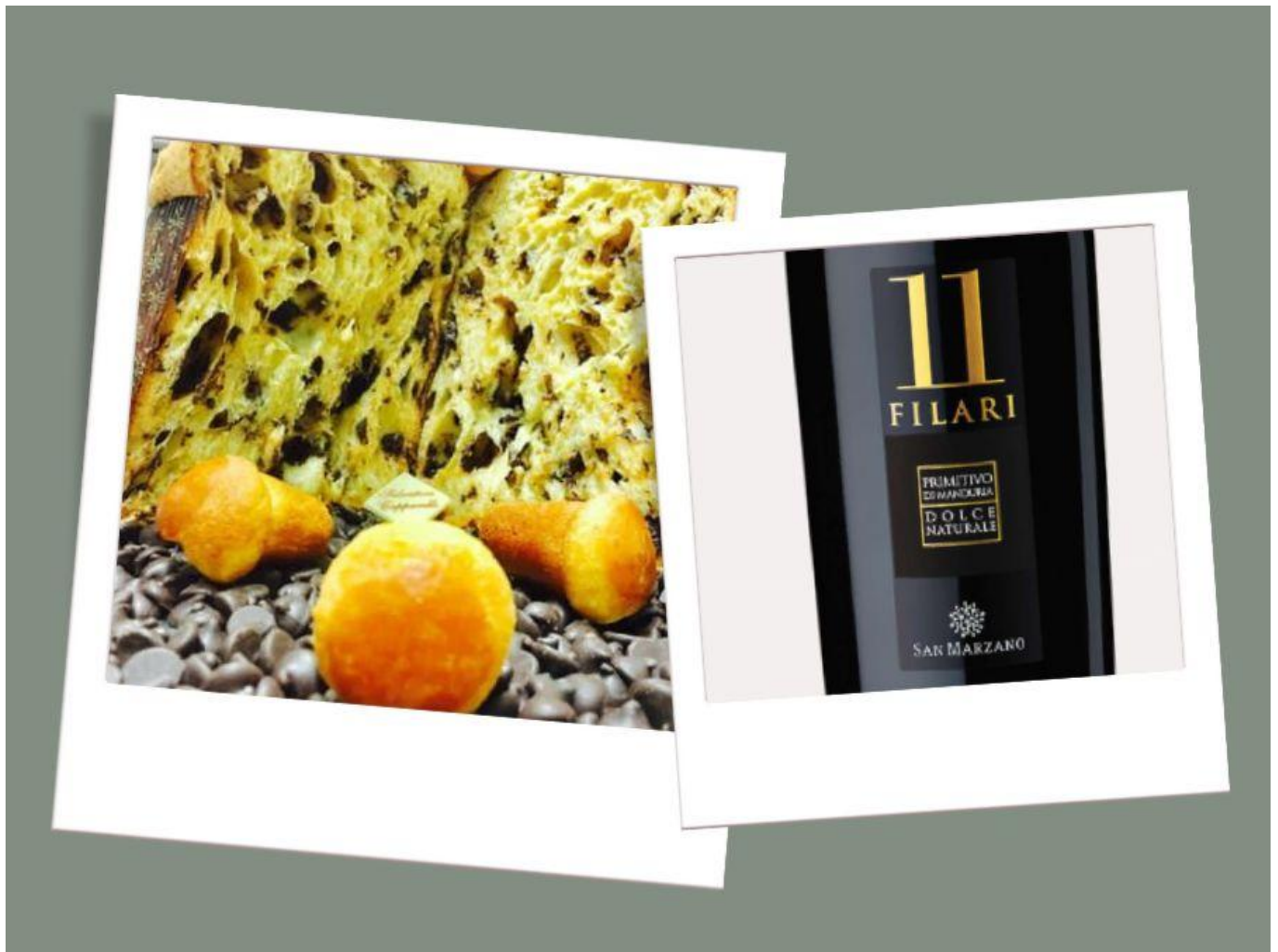
Il Babbattone, con il Primitivo di Manduria Dolce Naturale 11 Filari 2022.