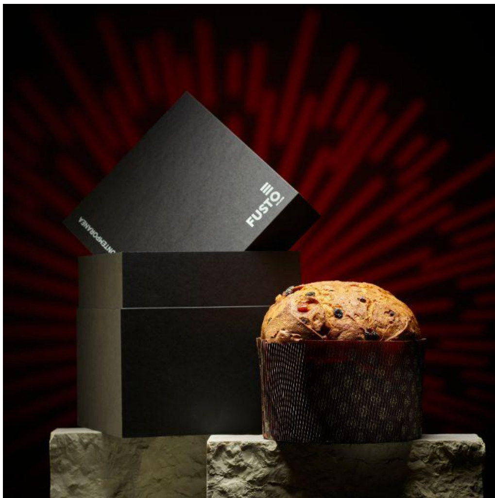
Panettone Milanese 2023 di Fusco.