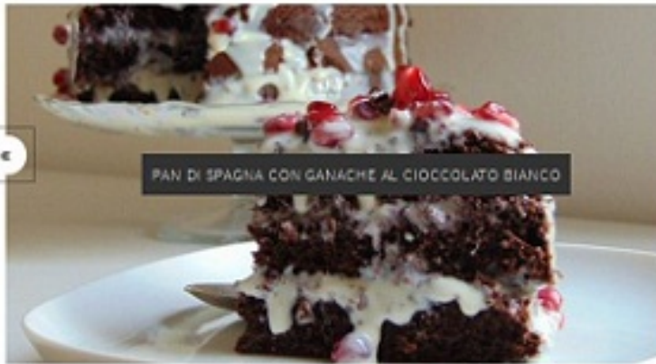
PAN DI SPAGNA CON GANACHE AL CIOCCOLATO BIANCO

CREMOSO AL CIOCCOLATO LAMPONI E SPECULOOS