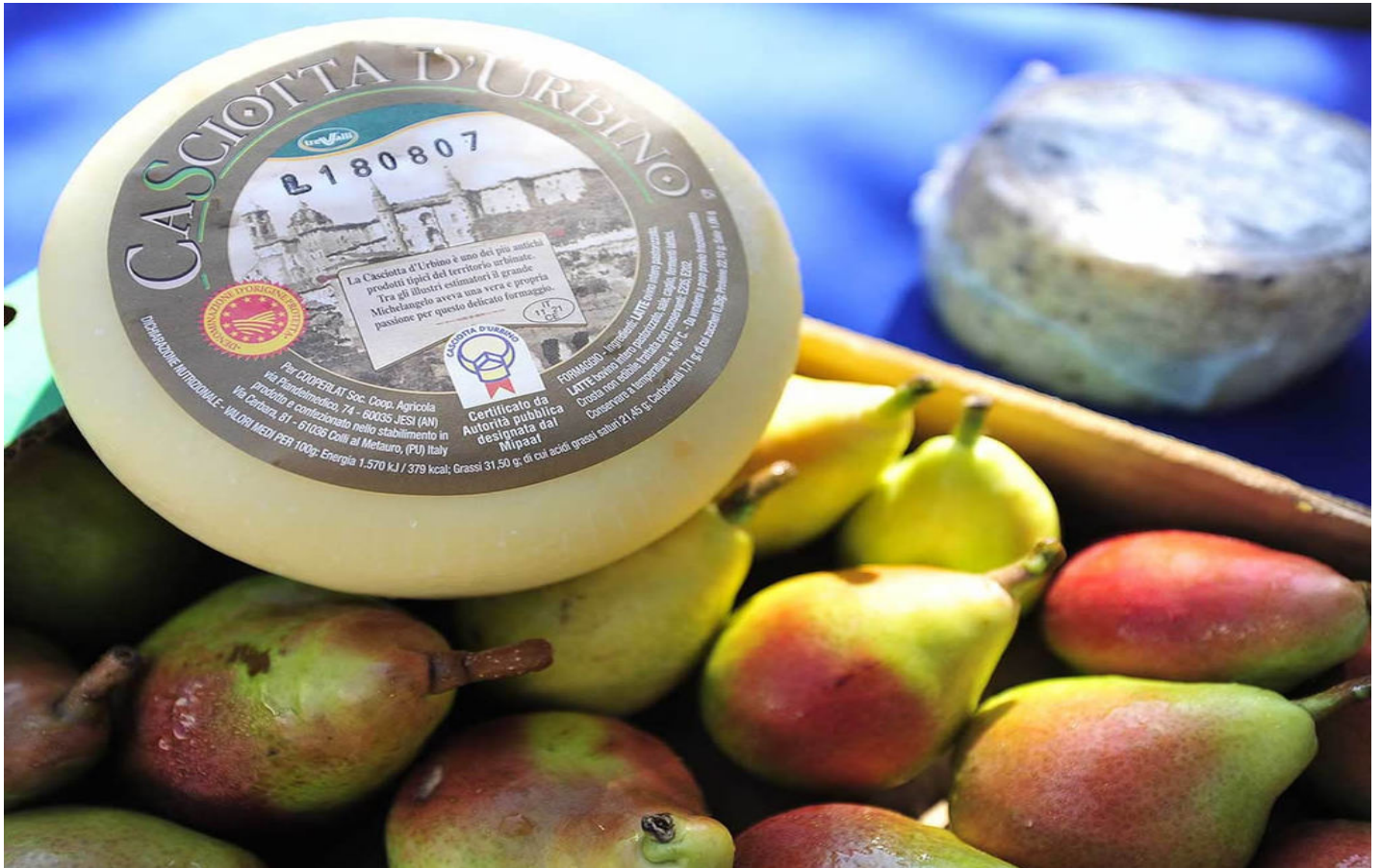
Casciotta d'Urbino DOP (Foto © Omnia Comunicazione).

Terra di antiche tradizioni e di contrasti che si tramutano in un mosaico perfetto di mare e monti, di piccoli borghi che si specchiano in uno scenario maestoso di colline e valli silenziose: è questo il mix suggestivo offerto dalle Marche , un'isola felice dove anche i profumi e i sapori di una gastronomia unica si tramandano da generazioni, accompagnati da storie che si affacciano ora sul mito e ora sulla realtà ma che testimoniano comunque l'antico legame tra questa terre e le proprie eccellenze.