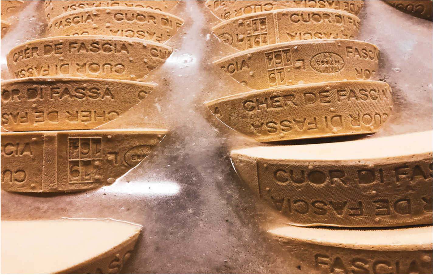
Una fase di lavorazione del Cuor di Fassa.

Tra i più rappresentativi di queste vette di montagna e della vicina val di Fiemme c'è, poi, il Puzzone di Moena Dop , più saporito, anch'esso a crosta lavata e ottenuto da latte intero crudo.