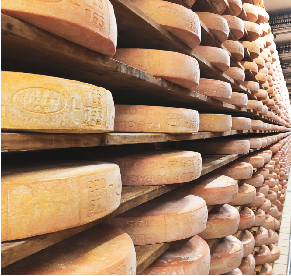
Celle di affinamento del Caseificio sociale.

La visita conduce sempre più in basso, fino alle celle di affinamento (Foto sopra) dove i formaggi, ad una temperatura costante di otto gradi, attendono il momento della loro giusta maturazione.