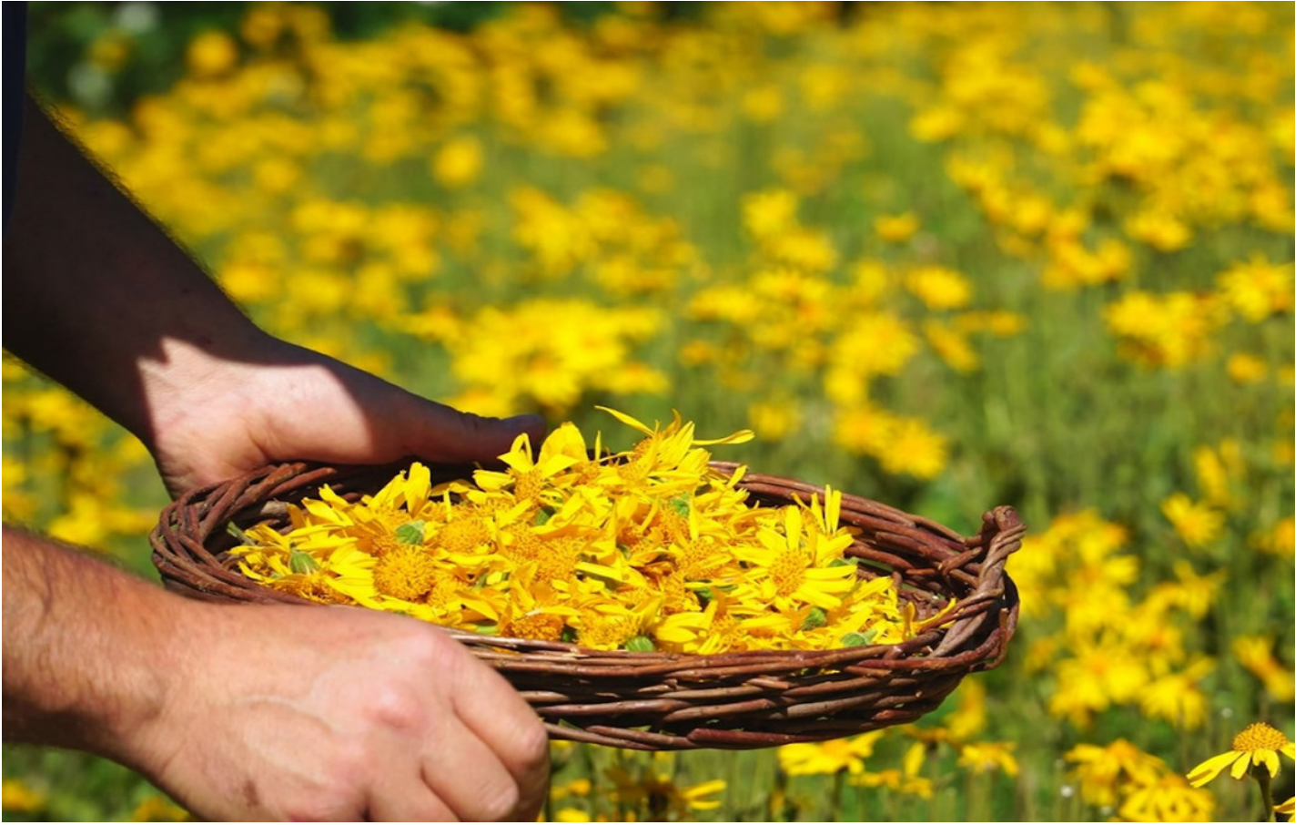
Coltivazione arnica in Val di Sole.

La montagna regala grandi soddisfazioni e quando anche un fiore semplice come l' arnica viene lavorato, diventando progetto imprenditoriale, a beneficiarne è tutto il territorio.