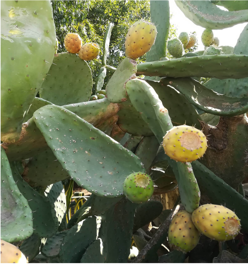
Una pianta di Fichi d'India.

L' Opuntia Ficus-Indica , comunemente conosciuta come Fico d'India , è una pianta originaria del Messico dall'aspetto maestoso e scultoreo che la rende una vera opera d'arte naturale, nonché fonte incredibile di acqua.