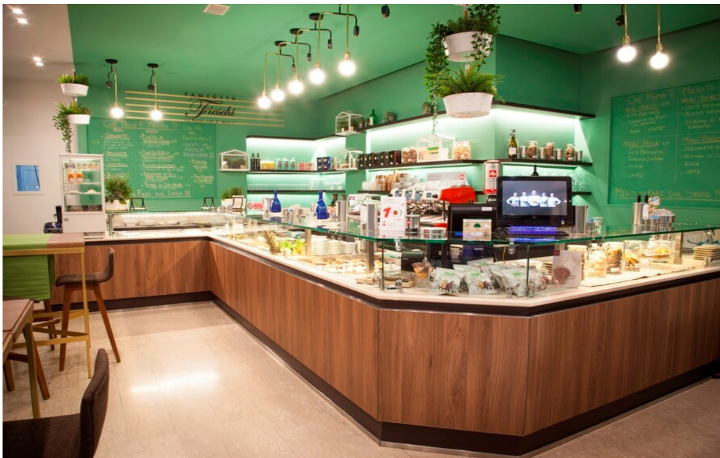
L'interno del locale.