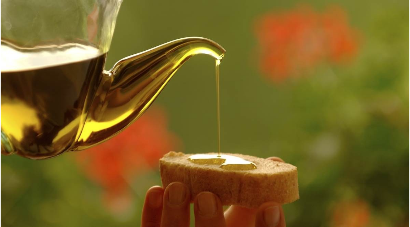
Olio extravergine Garda DOP Trentino.