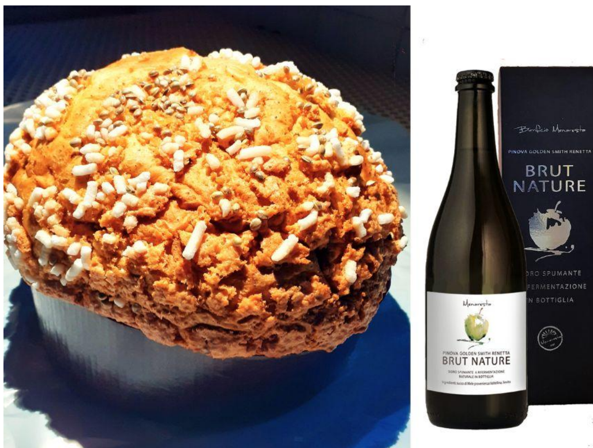
Il Panettone alla canapa dell'azienda Landini e il Sidro Brut Nature, Menaresta.

In abbinamento: Sidro Brut Nature, Menaresta . Un piacevole spumante di mela con un nome simile a quello con cui un tempo venivano chiamati gli spumanti secchi, "Brut Nature". Viene rifermentato in bottiglia e le mele che impiega sono tutte di provenienza della Valtellina.