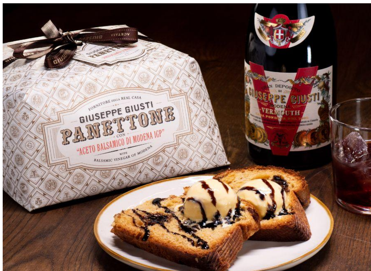
Panettone all'aceto balsamico e Vermouth.

In abbinamento: Vermouth Giusti . Affinato nelle antiche barrique del Gran Deposito Giuseppe Giusti, viene prodotto con una selezione di vini bianchi e rossi italiani, tra cui il Lambrusco. Ad aromatizzarlo, 19 botaniche tra spezie, radici amare ed erbe officinali