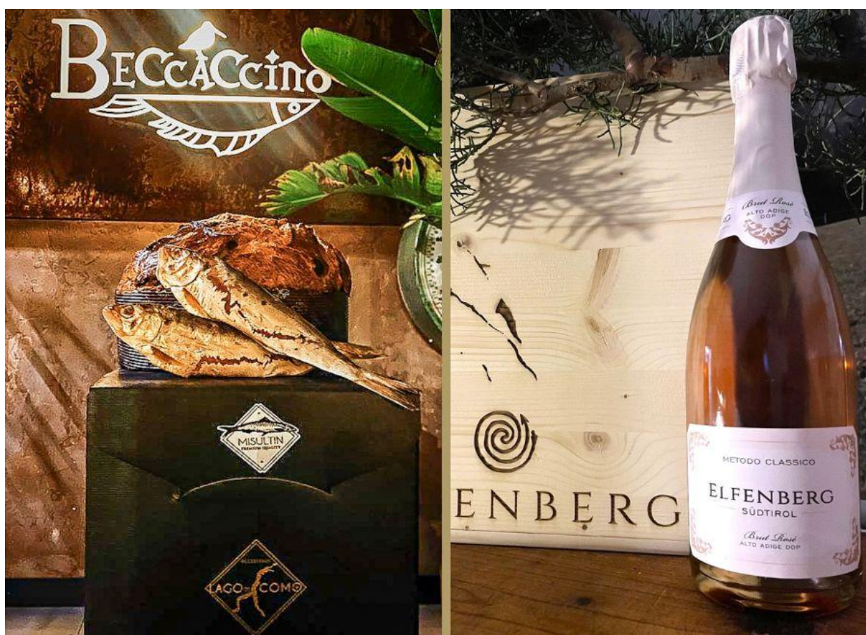
Panettone al Missoltino di Romeo Landi e lo Spumante Metodo Classico Brut Rosé Junker, Effenberg.

In abbinamento: Spumante Metodo Classico Brut Rosé Junker, Effenberg . Nocciola, pera, buccia d'arancia tra le note olfattive sprigionate da questo Metodo Classico altoatesino ottenuto da uve Pinot Nero. Un vino di montagna capace di trasportarci magicamente sul "sentiero degli elfi" (Effenberg)