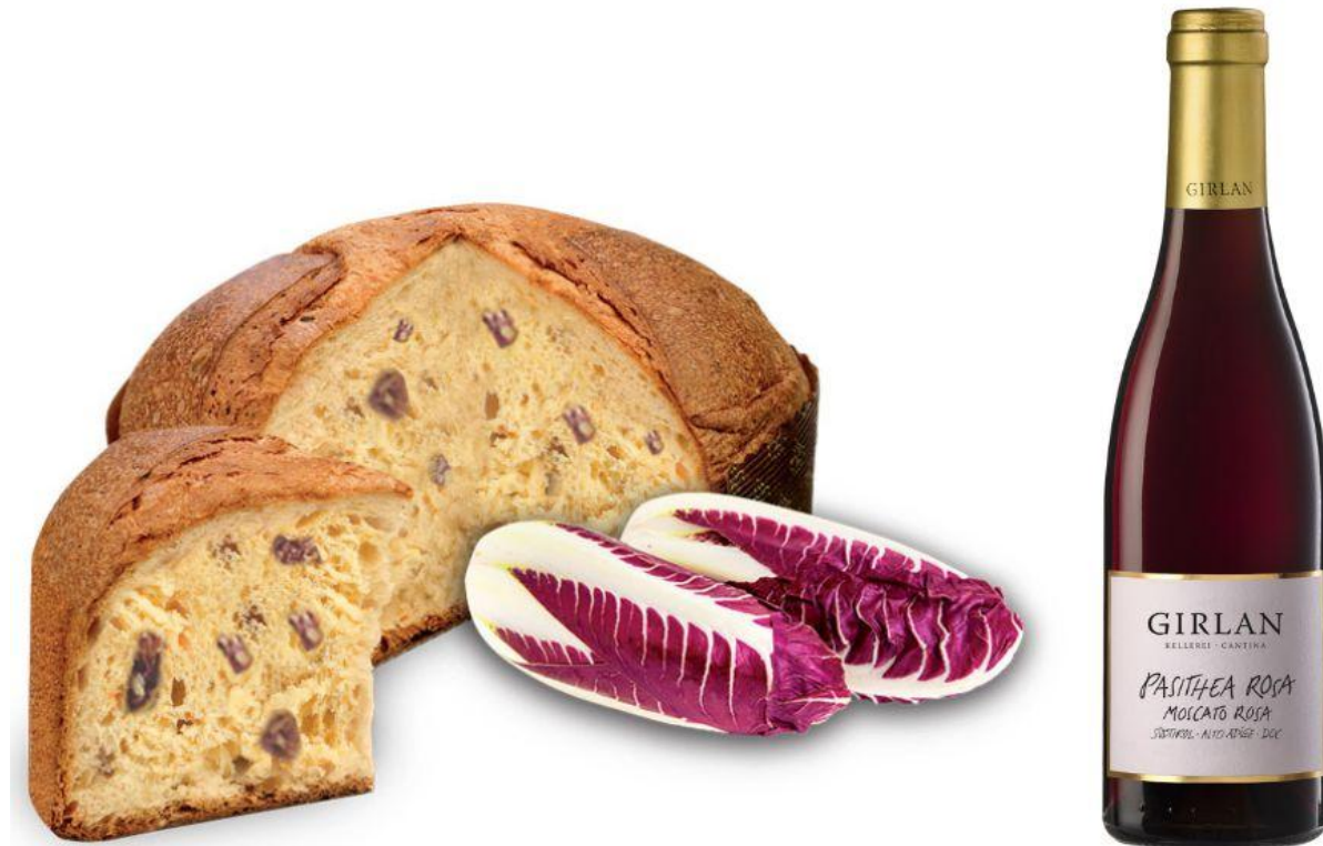
Focaccia Dolce al Radicchio Rosso di Treviso IGP.

In abbinamento: Moscato Rosa “Pasithea Rosa” 2021, Girlan . Sapore morbido e tannini soffici per questo dolce vino dai profumi di rose, fragole di bosco e mirtilli rossi, che nasce dalla lavorazione in purezza del Moscato rosa, vitigno aromatico a bacca rosa.