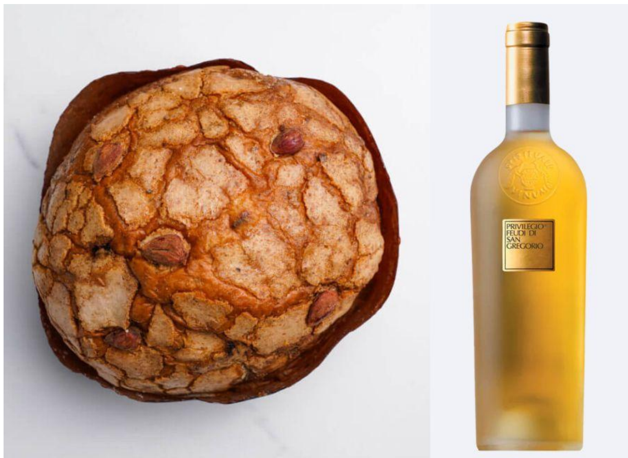
Panterrone della pasticceria Natale di Lecce.

In abbinamento: Irpinia Doc Passito Privilegio 2021 Feudi di San Gregorio . Dolce e delicato nettare ottenuto dall'appassimento di uve Fiano ha livrea dorata e piacevoli note di arancia candita. Di mandorle e miele nel piacevole sorso.