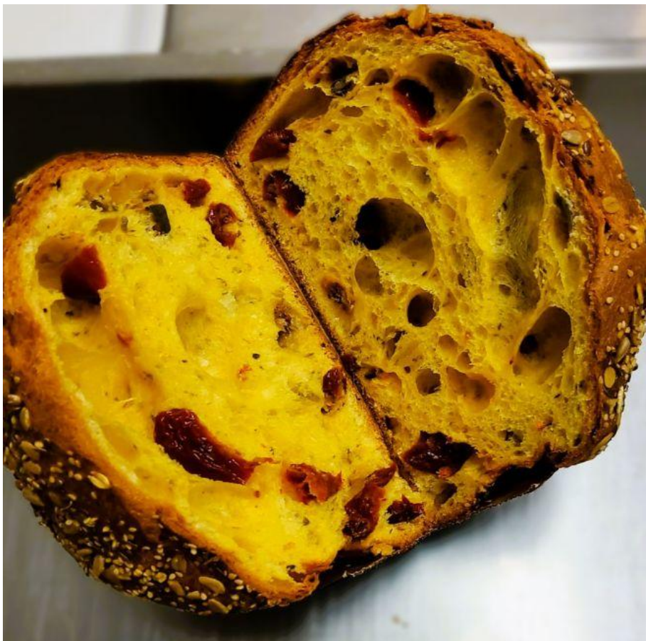
Profumo di Marinara di Guido Sparaco.

In abbinamento: VSQ Pinot Nero Metodo Classico Rosé “Farfalla” Collection n. 11, Ballabio . Elegante e piacevole, dal perlage assai fine si presenta con un raffinato e gentile color rosa antico. La cuvée utilizza i vini dell’annata ma impiega anche un 20% di vini pregiati di riserva.