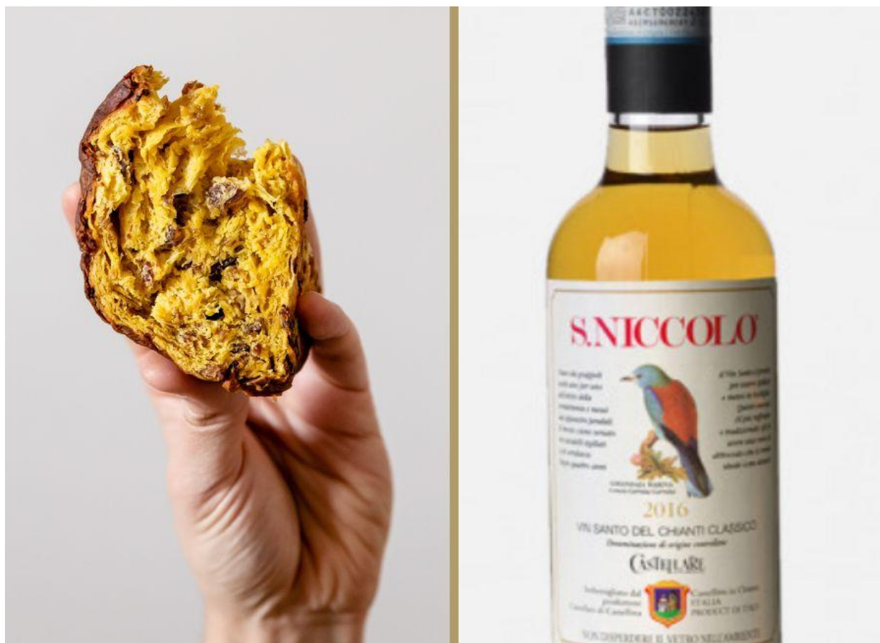
Pancapocollo, il panettone al Capocollo di Martina Franca.

In abbinamento: Vin Santo di San Niccolò 2017, Castellare . Prodotto di punta dell'azienda di Castellina in Chianti, ripetutamente in vetta a tutte le classifiche, sostiene per affinità con la sua componente mandorlata, e tostata un lievitato complesso come il panettone. La parte mielosa, invece, soccorre a mo' di contrasto la sapidità del capocollo.