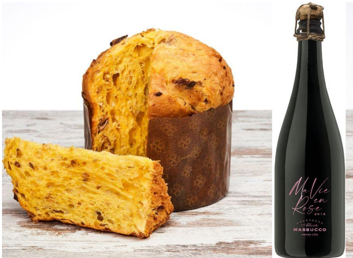
Il Panettone “Io sono Friuli Venezia Giulia” con lo Champagne Massucco.