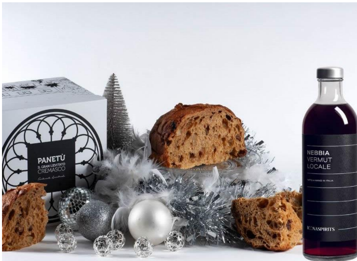
Il Panetù – Il Gran Lievitato Cremasco.