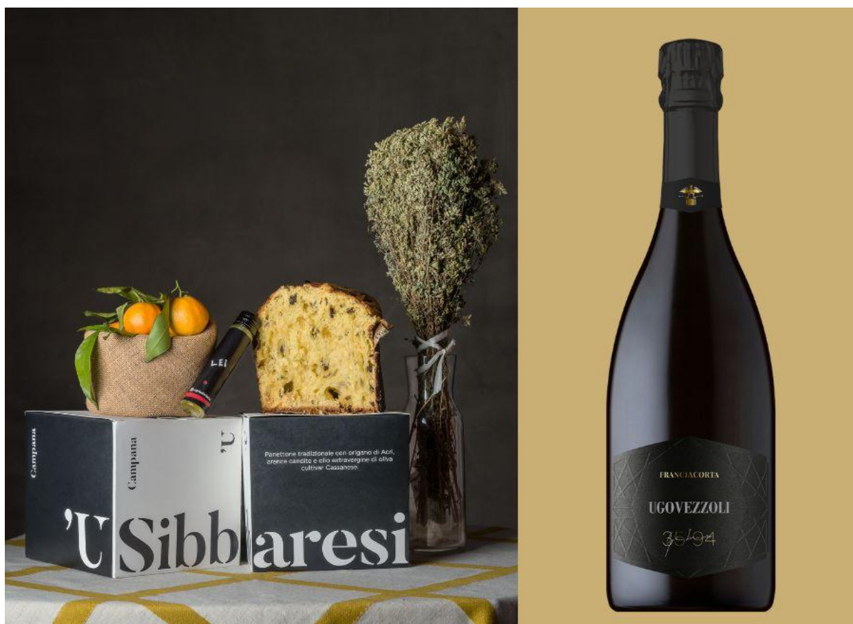
Panettone 'U Sibbaresi Classico.

In abbinamento: Franciacorta Docg Gianlorenzo 35/94 Extra Brut 2020, Ugo Vezzoli : elegante vino dai profumi agrumati ottenuto da uve 100% chardonnay. Le note fruttate che si rivelano all'assaggio e si fondono armoniosamente con quelle tipiche di pasticceria; ma anche di miele.