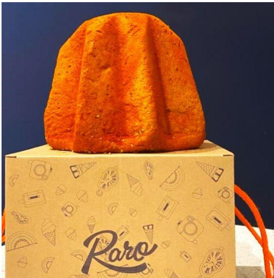
Il Pandoro ai profumi mediterranei.

In abbinamento: Trentodoc Quore Riserva, Brut 2015 Letrari . Fresco e vivace, ma dal perlage finissimo questo spumante dal colore brillante ben si presta con la sua ampia struttura all'esuberante incontro con i sapori e i profumi tipici del "Mare Nostrum".