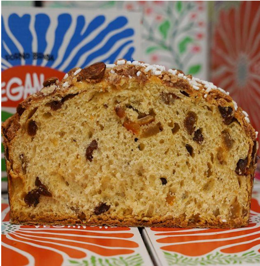
Il Veganone del Forno Brisa di Bologna.

In abbinamento: Vendemmia tardiva Cristina 2020, Roeno . Dolcezza e acidità convivono insieme in questo vino molto delicato ed elegante (e anche assai premiato) apprezzato anche da chi non ama solitamente i vini dolci. Il brio è quello di un vino frizzantino, la dolcezza invece ricorda il sapore del moscato. Al naso piacevoli sentori di pesca e albicocca.