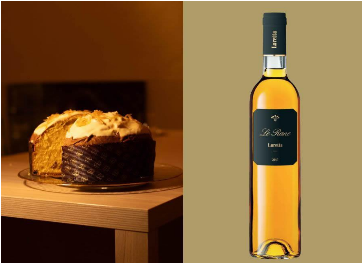
Panettone 45 allo Yuzu, della Locanda Sensi di Rivergaro.

. È proprio una frutta esotica matura quella che si percepisce al naso di quest'intrigante vino dolce dal colore ambrato tendente all'oro. E che promette viaggi e, perché no?, incontri in terre lontane.