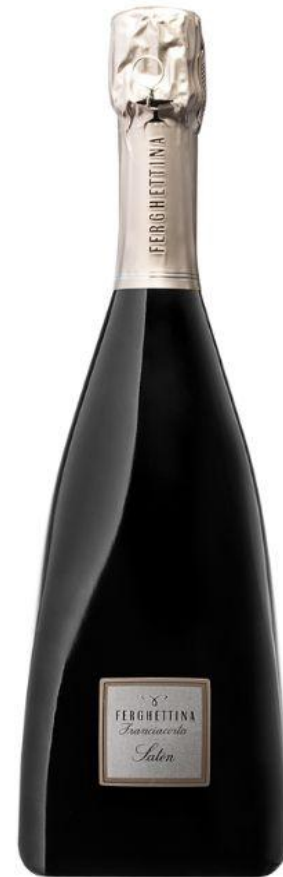
Il Pancazu, abbinato al Franciacorta Docg Satèn 2018, Ferghettina.