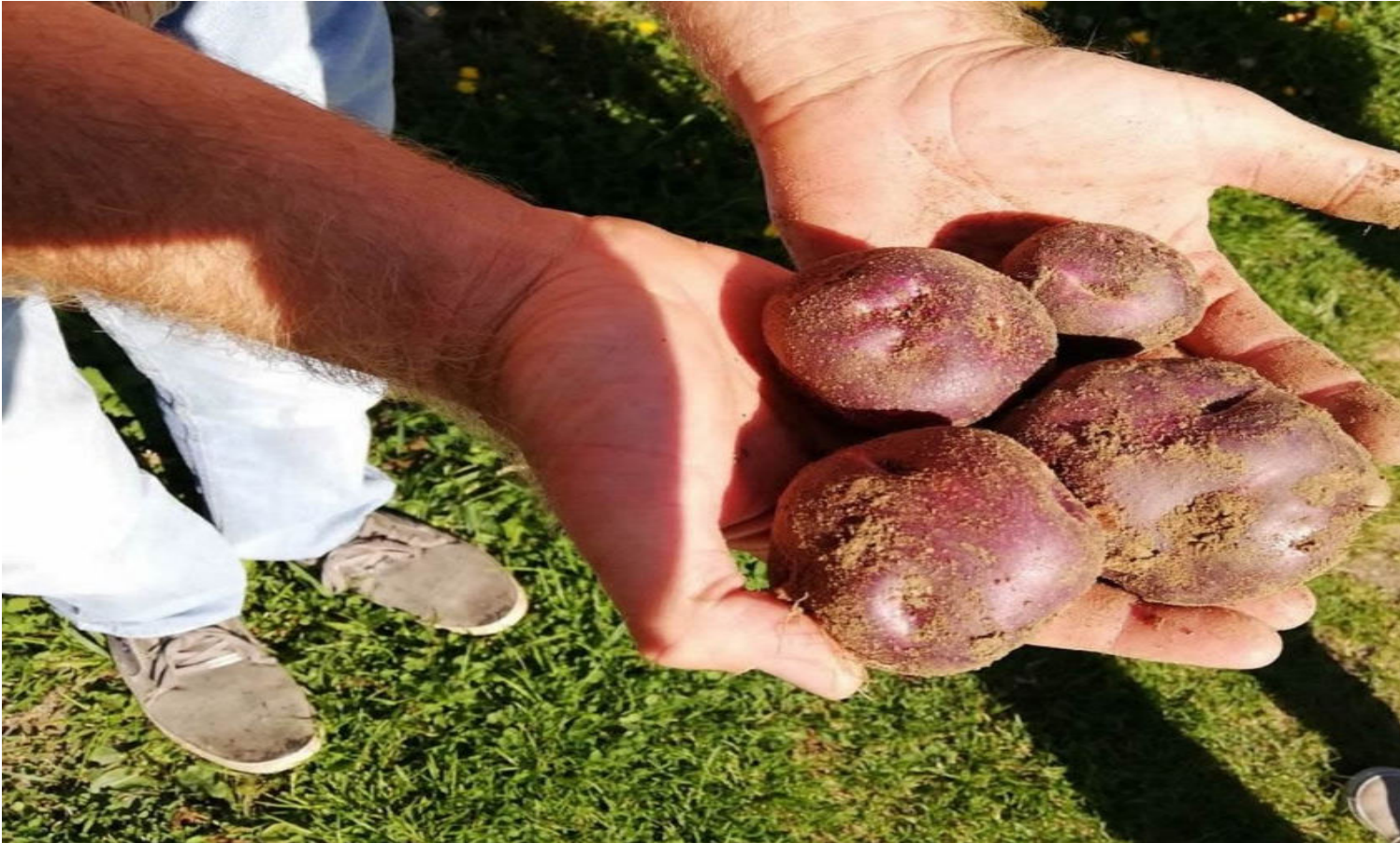
Patata Verrayes della Valle d'Aosta.

La patata Verrayes , coltivata in Valle d'Aosta, entra a far parte dell'assortita famiglia di prodotti a marchio Slow Food che raggiungono il numero di 342 in tutta Italia. Il tubero valdostano è ritenuto l'ultima varietà tradizionale coltivata dai produttori locali della piccola regione italiana.