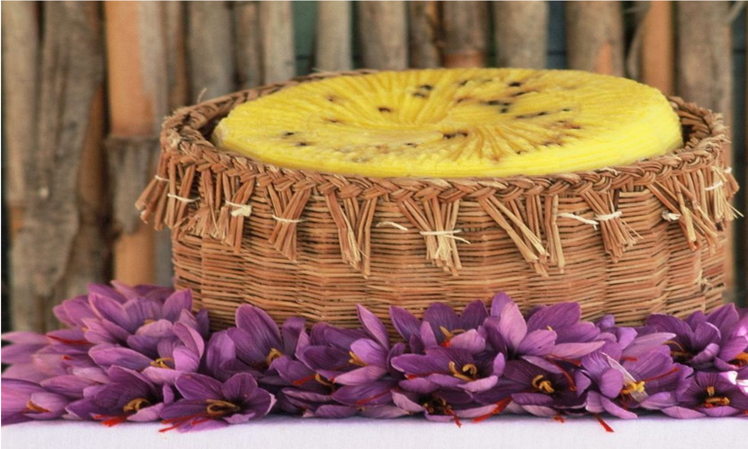
Piacentinu Ennese DOP (Foto © Consorzio di Tutela del Piacentinu Ennese DOP).

Dalla crosta di colore giallo per la presenza dello zafferano, l'odore delicato e il sapore leggermente piccante frutto della combinazione con il pepe nero in grani, il Piacentinu Ennese DOP è un pecorino tradizionale dalle singolari caratteristiche sensoriali che rappresenta un unicum nel panorama caseario italiano.