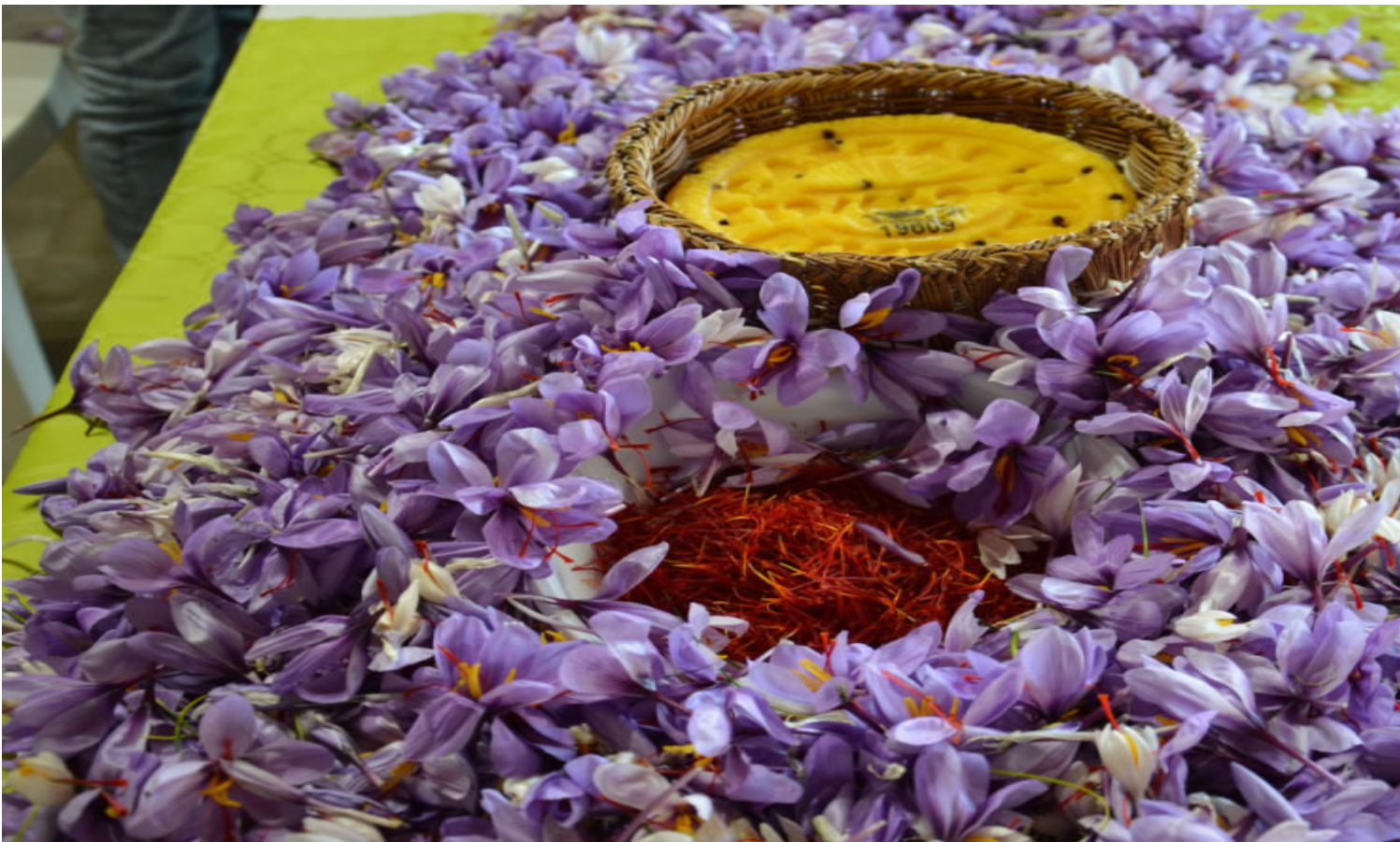
I fiori e lo zafferano per la produzione del Piacentinu Ennese DOP.

Lo zafferano contiene composti volatili unici come il safranale e svolge un' azione antitumorale , differenziando il Piacentinu Ennese da altri pecorini per le proprietà sensoriali e salutistiche.