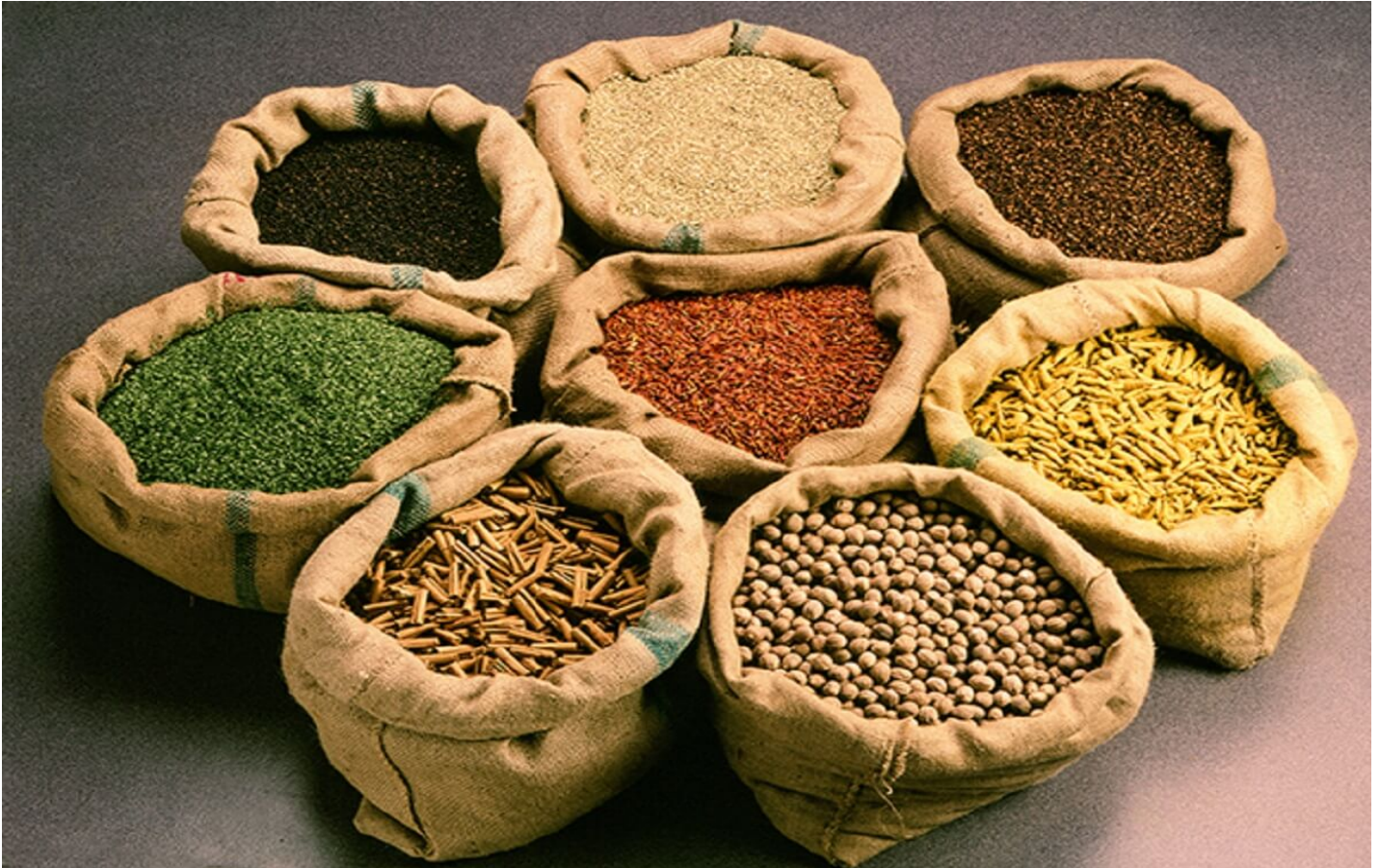
Sidea Spezie ed Erbe aromatiche a San Martino di Lupari.

Un lungo viaggio sensoriale finalizzato alla conoscenza delle spezie è un'esperienza complessa, ma affascinante. Non solo come richiamo alla memoria gustativa, olfattiva e visiva, ma anche come "patrimonio culturale e storico di grande livello" , mutuato dal favoloso viaggio di Marco Polo nella lontana Cina e dal ruolo della Serenissima nei commerci dell'epoca.