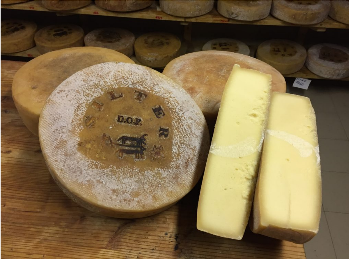
Formaggio Silter DOP

Chi è stato in Valle Camonica , in provincia di Brescia , e ha onorato la cucina del territorio sicuramente ha assaggiato il formaggio Silter , un'eccellenza del luogo da poco riconosciuta DOP (Denominazione di origine protetta).