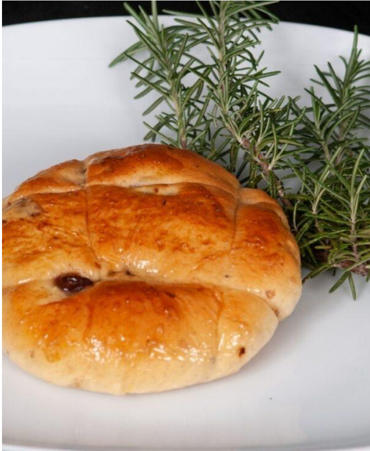
Il Pan di Ramerino di Massimo Peruzzi

In abbinamento: Recioto di Soave Docg “La Perlara” 2019 Ca’ Rugate . Elisir di colore giallo dorato, ideale e degna conclusione di un pasto: uva sultanina, fico secco e noce tra le sue note aromatiche.