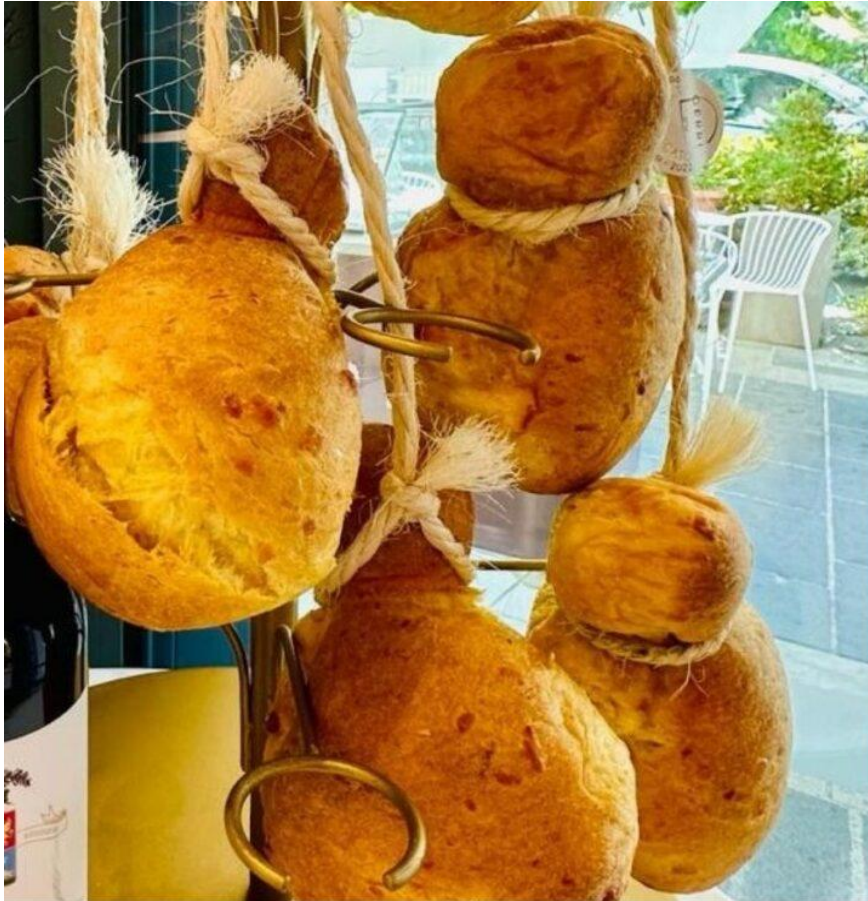
Il Pan Salato, dalla caratteristica forma di caciocavallo.