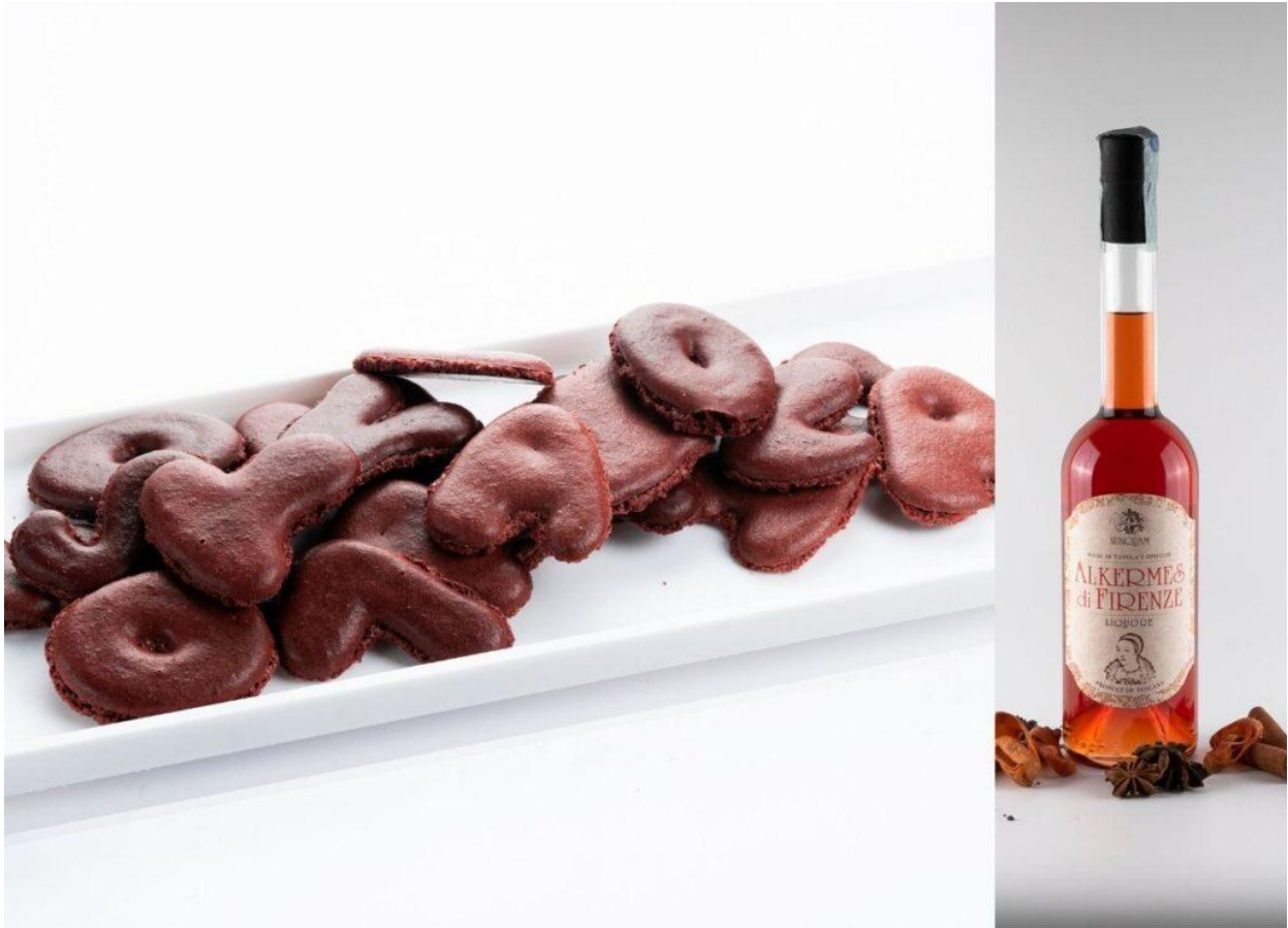
I Quaresimali di Paolo Sacchetti con l'Alkermes dell'Opificio Nunquam.

Li gusteremo insieme a un goccio di quel vero e proprio rosolio che è l' Alkermes dell'Opificio Nunquam di Prato preparato ancora secondo l'antica ricetta che prevede l'utilizzo dellacocciniglia dal cui corpo essiccato si ricava il caratteristico color porpora. Tra le spezie presenti: anice stellato, macis, cardamomo, cannella, chiodi di garofano, vaniglia e coriandolo.