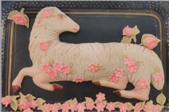
Pasta reale a forma di pecorella