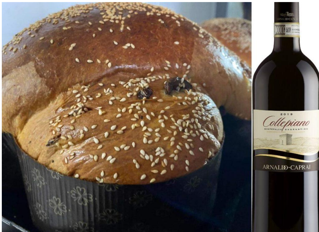
Colomba salata all'olio extravergine d'oliva Pasticceria Le Delizie del Corso.