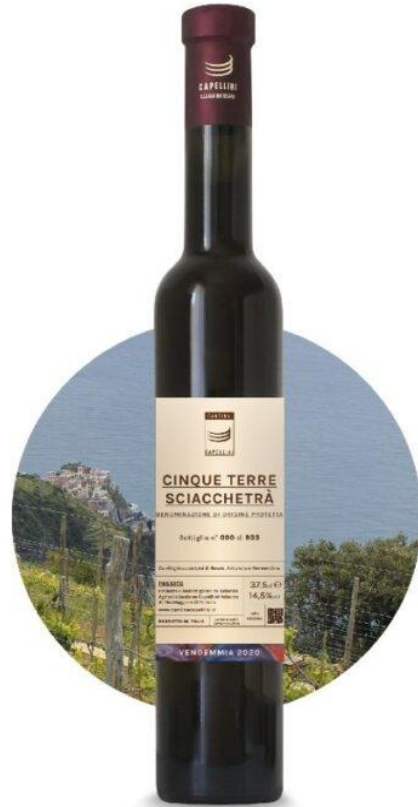
La Colombaccia della Maremma e lo Sciacchetra Cinque Terre Dop 2021.