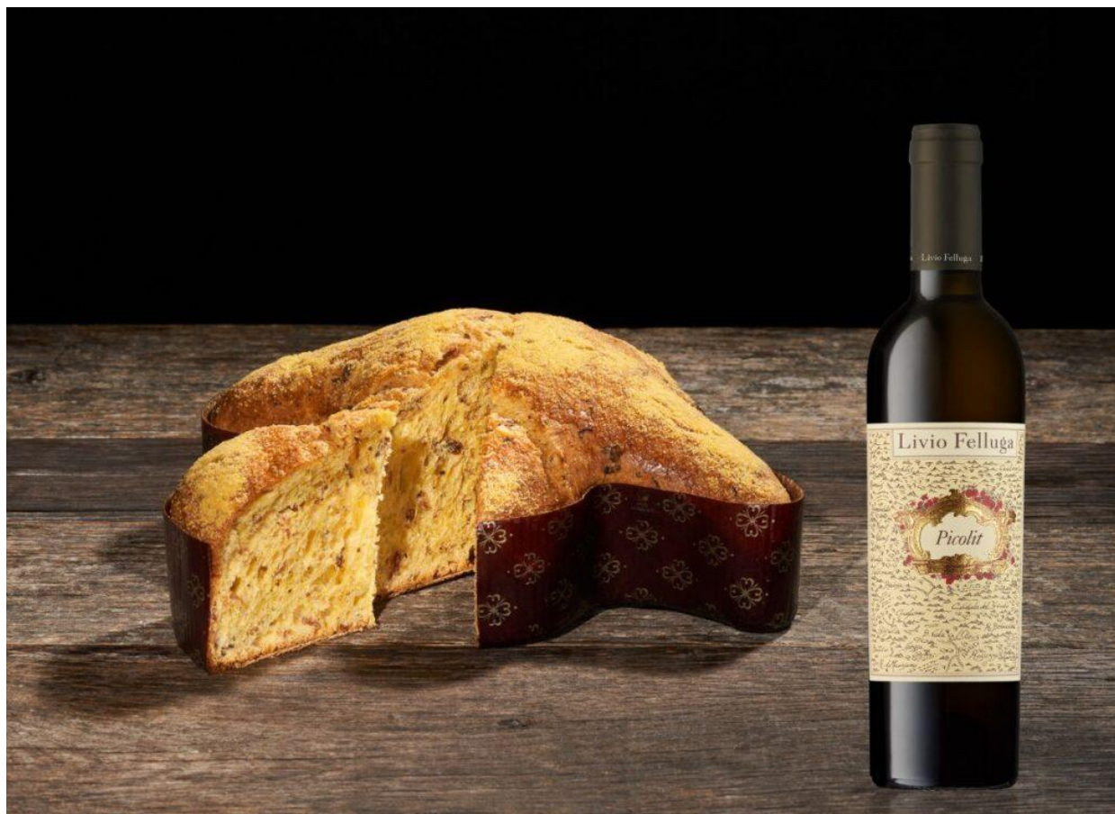
La colomba salata con sopressa e polenta della della pasticceria DolceVita di Codroipo.