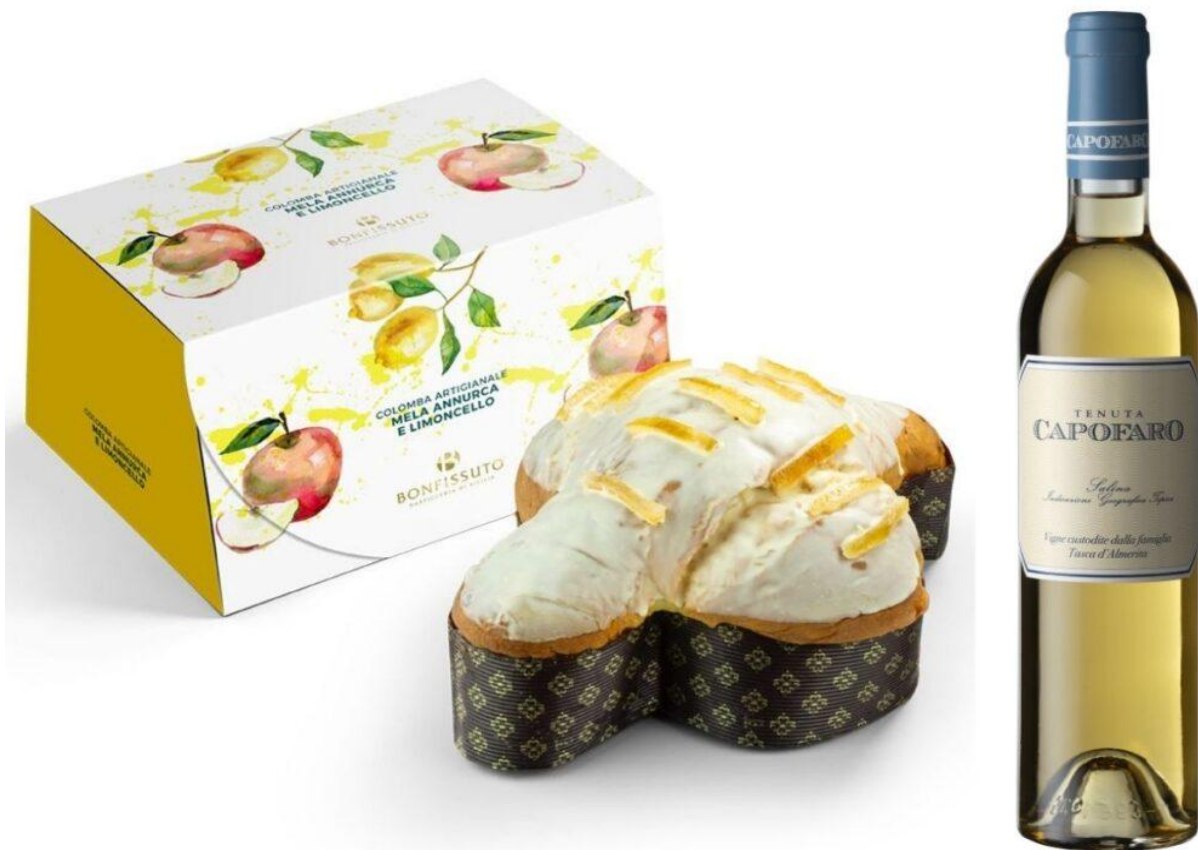
Colomba alla Melannurca campana di Bonfissuto.