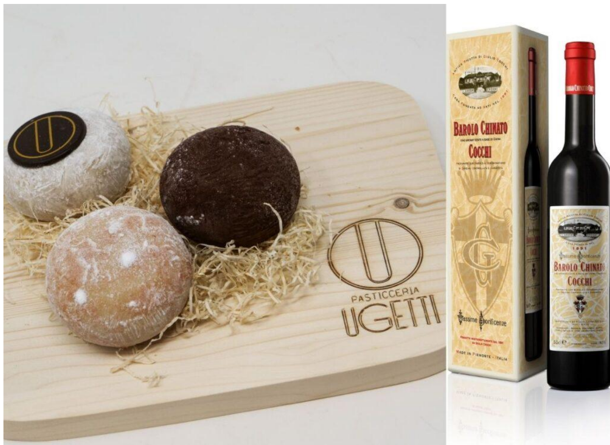
Tomette di cremino di Pasticceria Ugetti.

E le accompagneremo, anche, dalla lettura dei versi scritti appositamente del poeta Ferdinando de Blasio: