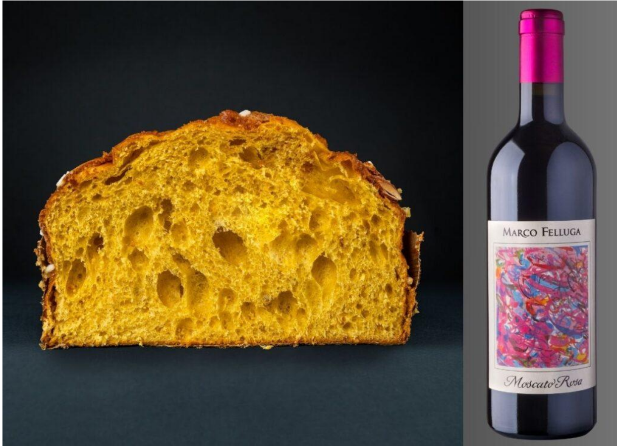
Focaccia veneta di Francesco Ballico.