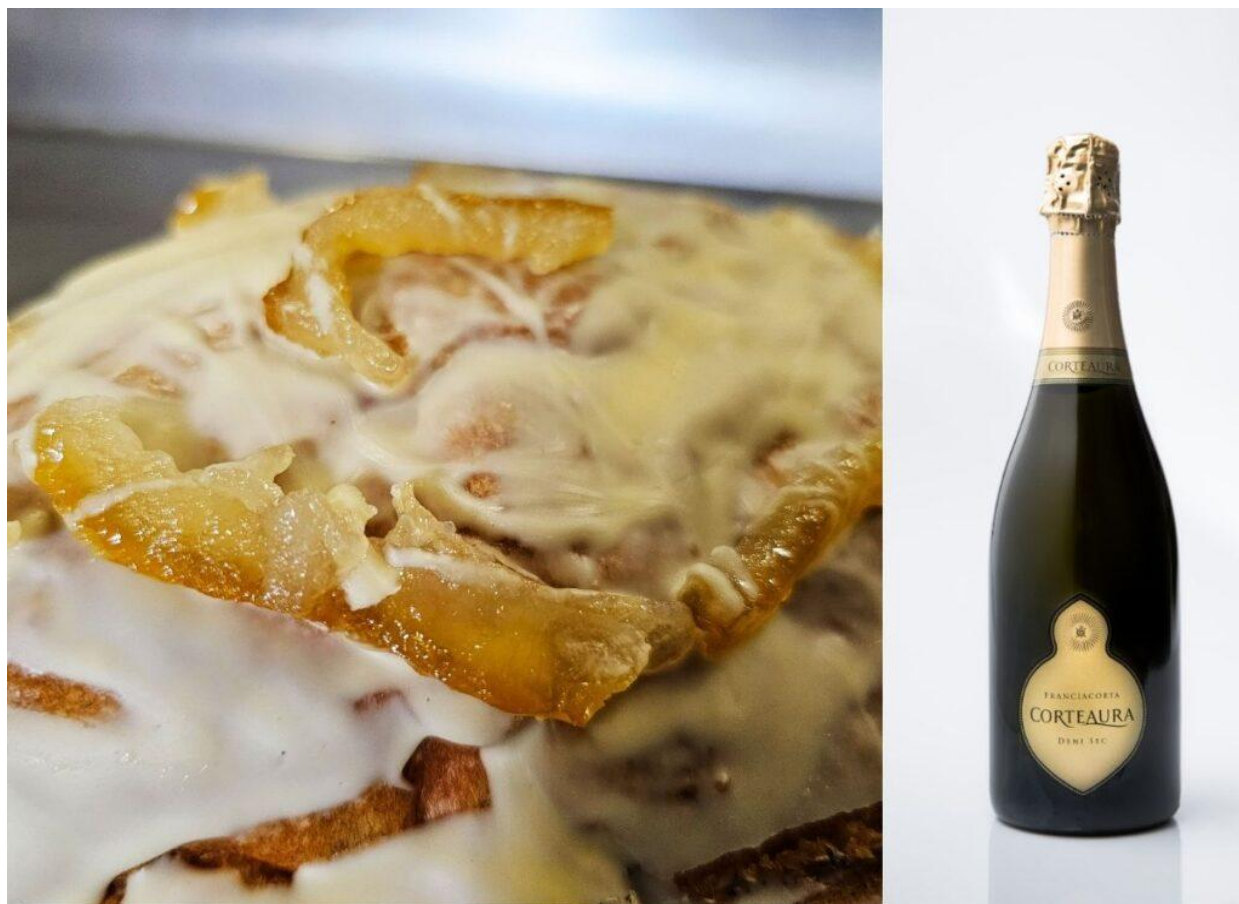
Colomba Officinale di Fromentu Lievitati.