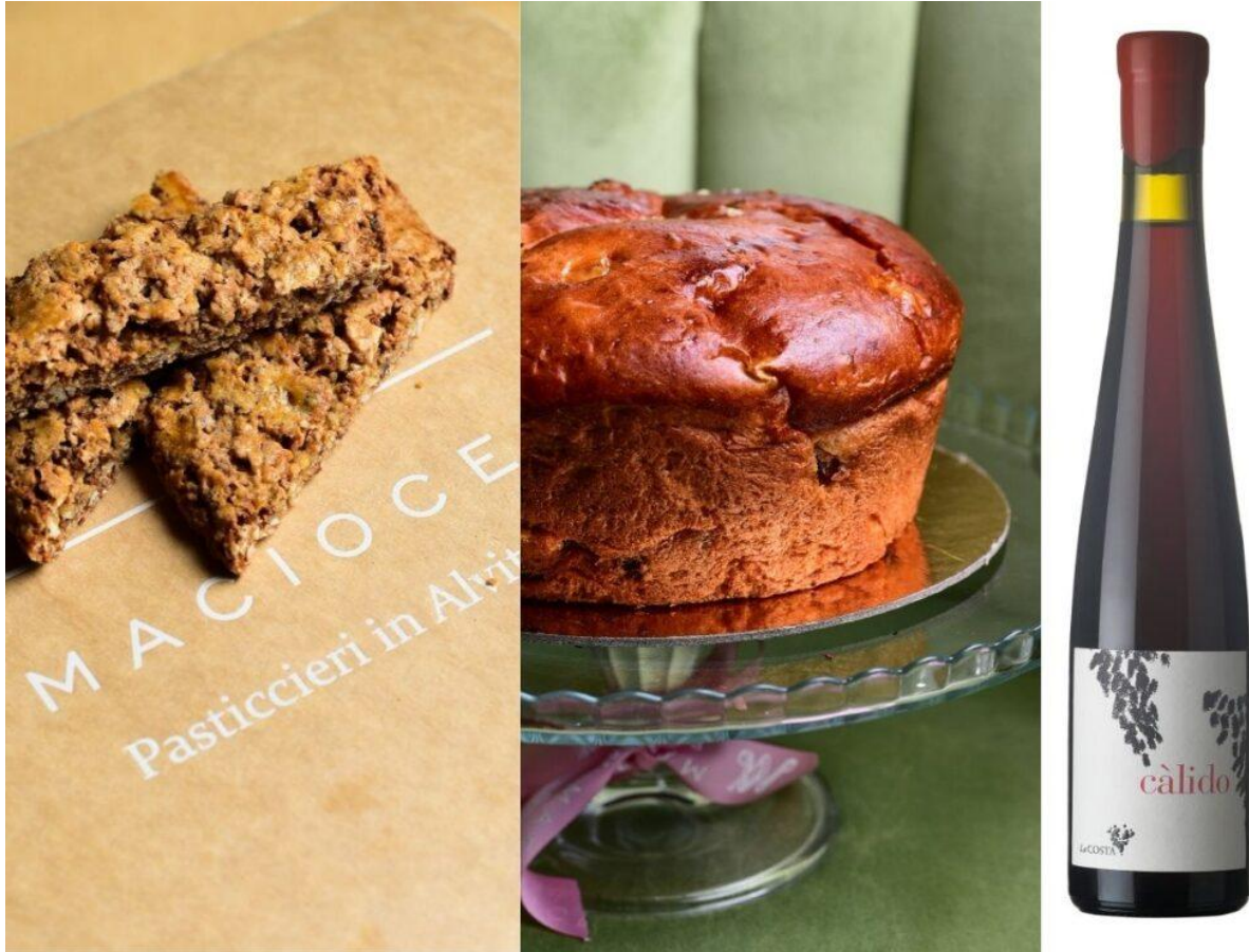
Alcune proposte pasquali della Pasticceria Macioce