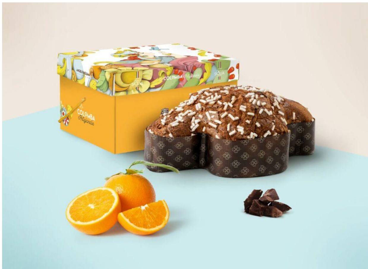
Colomba al cioccolato di Modica e con arance siciliane, di Angelo Inglima.