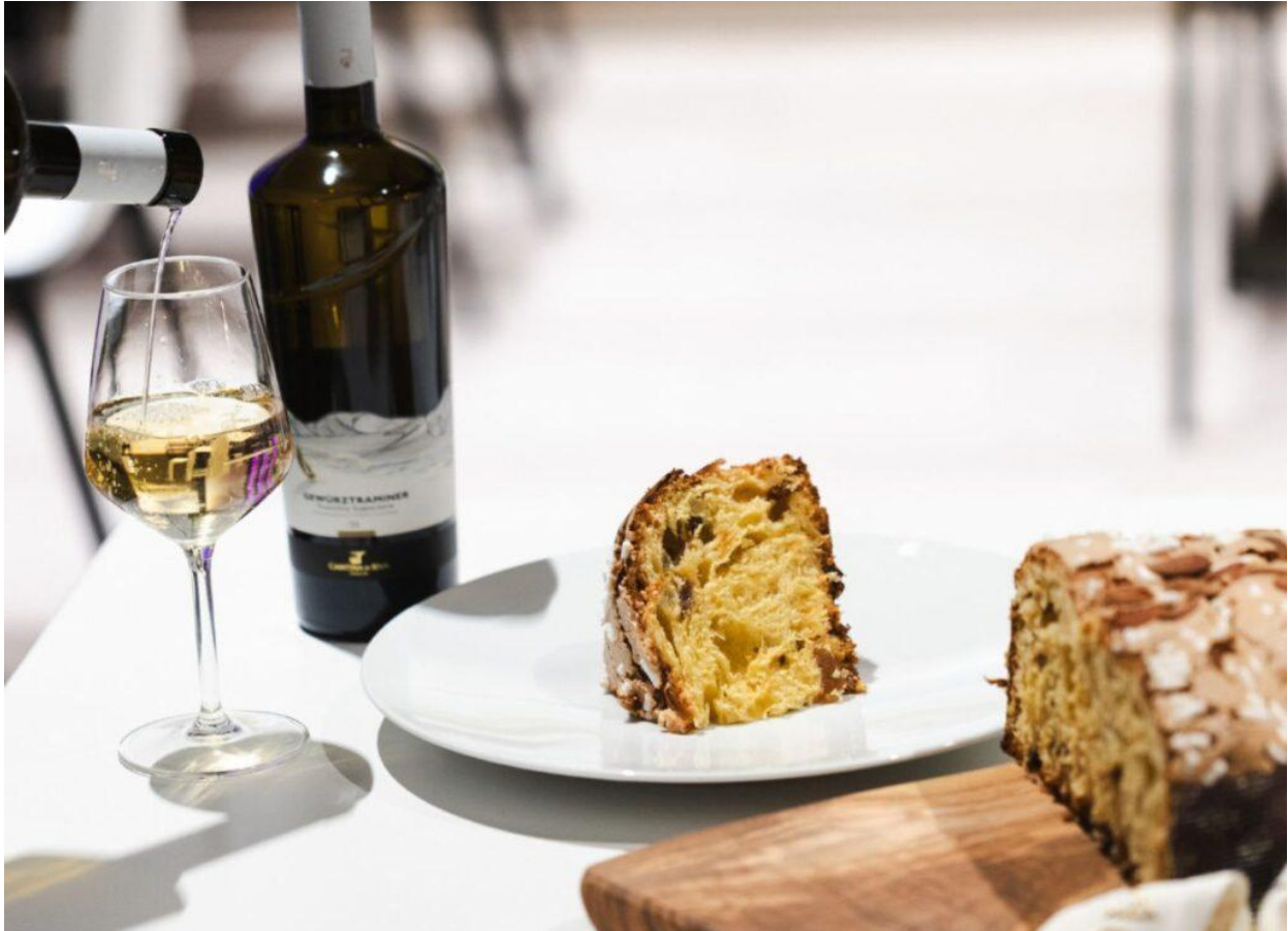
Colomba “Vista lago” al mosto d’uva di Gewürztraminer e Moscato giallo.