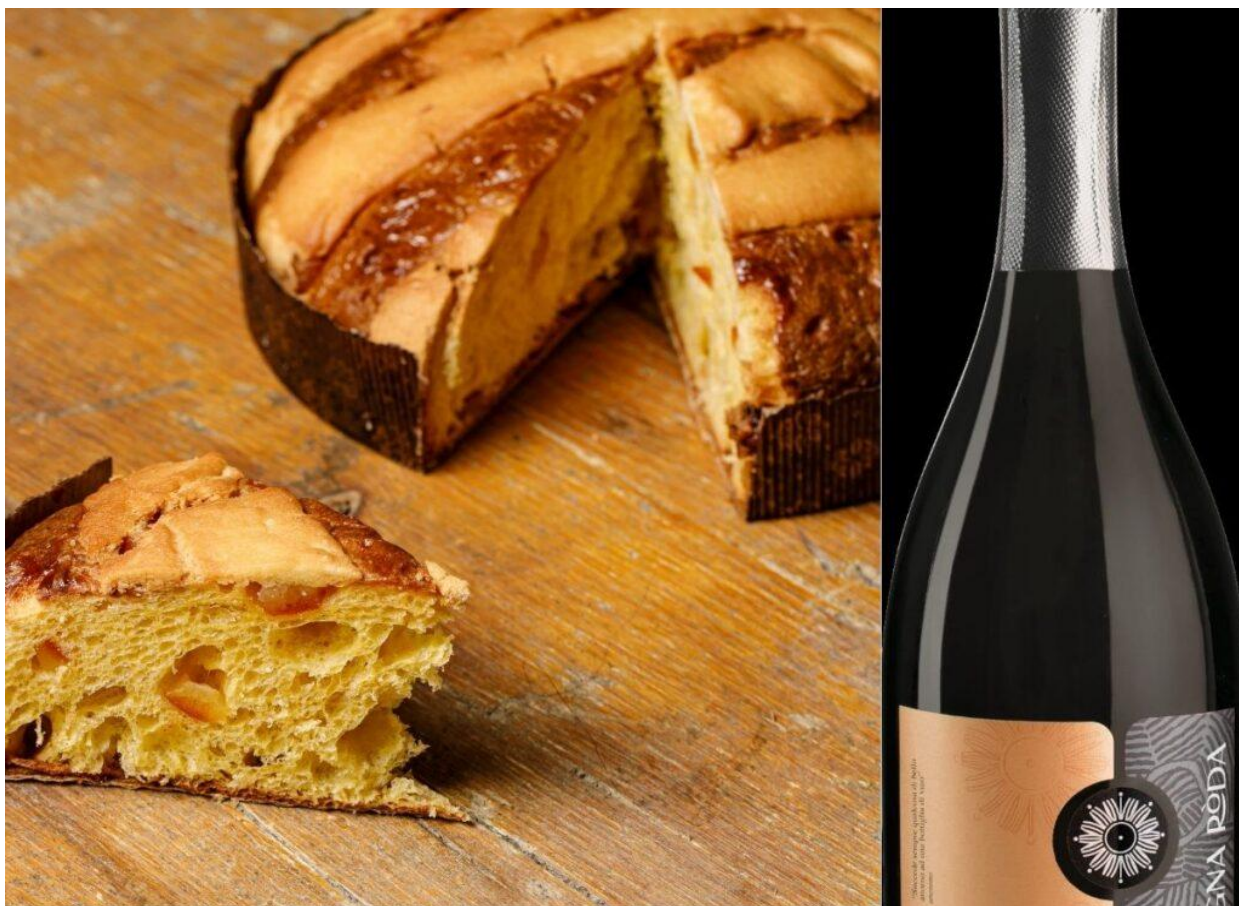
Pastierettone di Vincenzo Tiri.