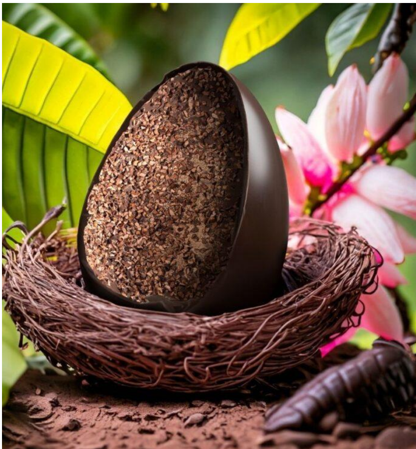
L'Uovo Fondente e Grué della storica azienda Giraudi.

In abbinamento: Liquore Agricante, Paladin. Liquore da meditazione nato da un'antica ricetta veneta e ottenuto da vino Raboso, grappa, succo di ciliegia e mandorla, che bene accompagna il cioccolato, su tutti quello fondente.