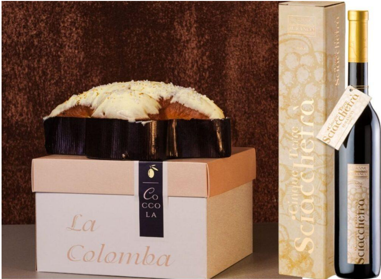
“La Coccola” di Jacopo Chieppa, della Pizzeria Kilo di Imperia.