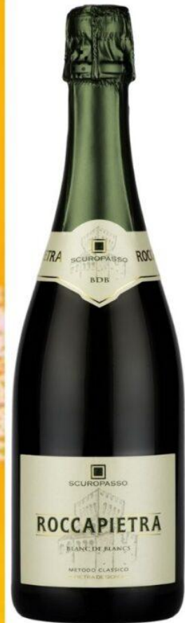
La colomba inzuppata nel maraschino (Tagliafico) e il Roccapietra Blanc des Blancs.