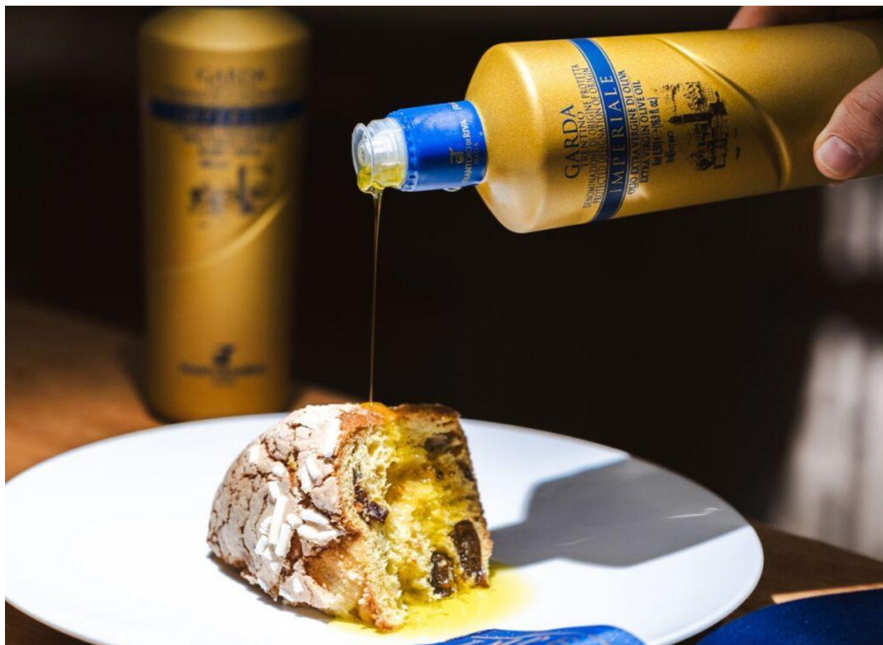
Dolce pasquale all'olio extra vergine di oliva.