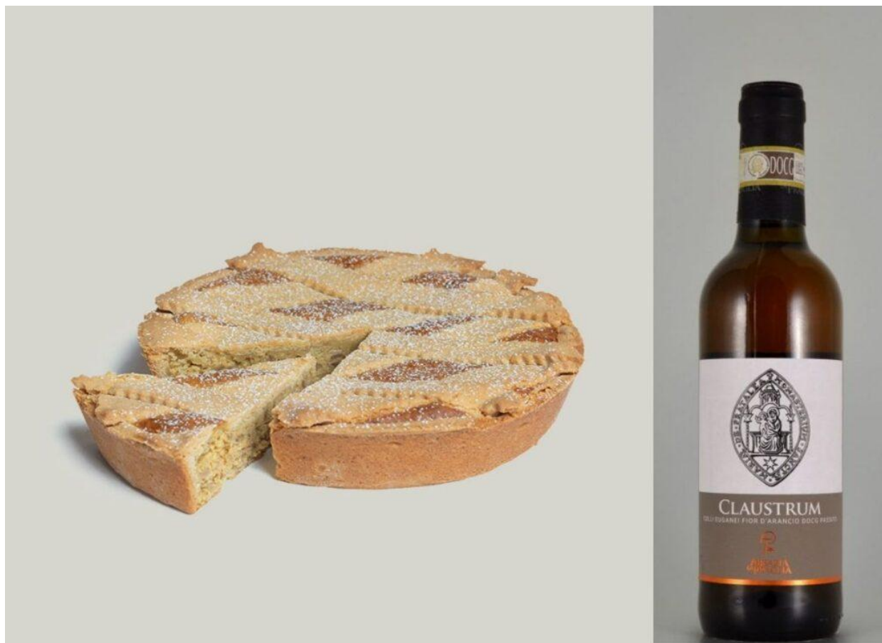
La Pastiera della Pasticceria Dolcemascolo di Frosinone.

Anche il Casatiello griffato Dolcemascolo personalizza la caratteristica “pizza di recupero” della tradizione pasquale napoletana impiegando le eccellenze del territorio: vi troviamo il Pecorino di Picinisco Dop – da quello semi stagionato a quello stagionato oltre 90 giorni –, la Mortadella di Arpino, il salame corallina di Amaseno. Anche le uova e l’olio extravergine impiegati sono tutti locali.