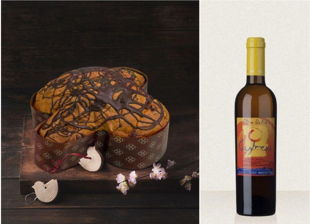
Dolce del Cardinale della Pasticceria Tabiano.