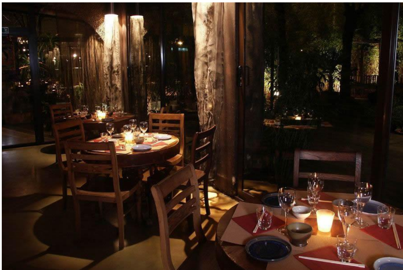
Una serata allo Shambala.

Per i lama tibetani infatti, Shambala significa "fonte della felicità" , e la sua ubicazione è in un punto imprecisato dell'Asia Centrale, forse in una realtà parallela. Un posto da cui, secondo un'antica dottrina, una volta giunti non si può più tornare indietro, proprio per evitare di divulgarne la posizione. Una terra nascosta fatta di profumi e sapori unici. Proprio come quelli che si potevano degustare nel ristorante asiatico milanese , tra i primi a proporre la cucina etnica asian fusion, thai e vietnamita.