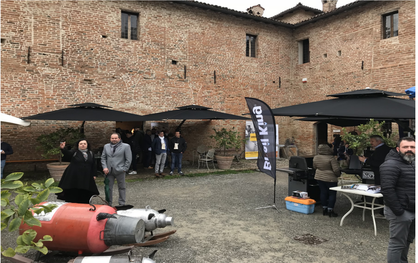
Antica Corte Pallavicina a Polesine Zibello (Foto © GdG).

Il tema portante dell'evento sarà Gastronomia e Agricoltura 3.0 : alta cucina, prodotti di qualità e agricoltura oggi. Alla parte espositiva dei produttori soci, con degustazioni dei prodotti di qualità della nostra terra, come oramai consuetudine si affiancheranno anche show cooking e numerosi forum di discussione con illustri ospiti regionali e nazionali, per fornire spunti di riflessione in diversi ambiti gastronomici. Per il secondo anno consecutivo presenta l'evento Federico Quaranta .