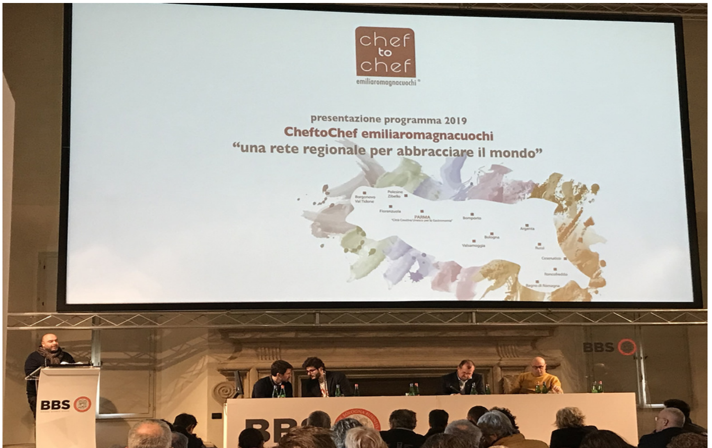
La conferenza stampa di lunedì 25 febbraio.

Villa Guastavillani a Bologna (sede di Bologna Business School) ha ospitato, come oramai tradizione, la presentazione dell'intenso programma d'attività che CheftoChef emiliaromagnacuochi ha in cantiere per il 2019, e non solo, tra eventi in Italia e all'estero, progetti di formazione e di divulgazione.