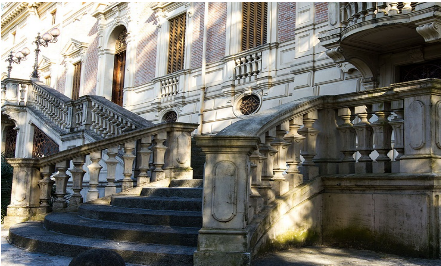
Villa Benni, Bologna

I 4 appuntamenti ospitati nella splendida villa neoclassica ai piedi dei Colli Bolognesi, conquisteranno il pubblico dei gourmet con cene a tema, degustazioni, spettacoli, musica e presentazioni di altrettanti libri inseriti nella citata collana edita dalla Damster Edizioni. Di seguito riportiamo il programma, le date e i dettagli di ciascuna serata che vi consigliamo di segnarvi subito in agenda: 24 Settembre, 29 Ottobre, 19 novembre e 10 dicembre 2015.