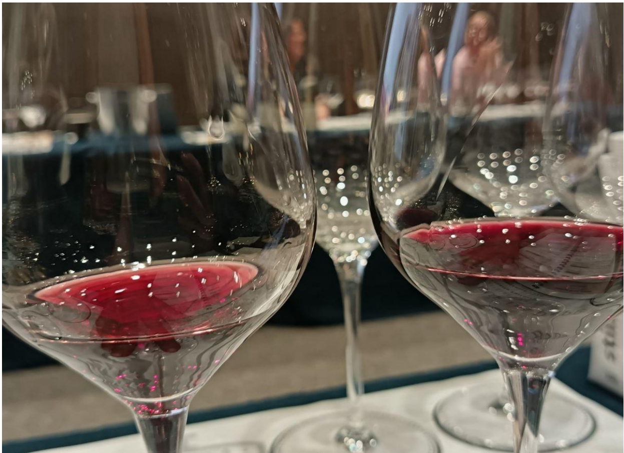
I rossi di Châteauneuf-du-Pape, famosi nel mondo per le loro diverse sfumature.

La capacità di coniugare profondità e freschezza e le sabbie calcaree accomunano invece Clos du Caillou Les Safres 2022 e Domaine Font de Courtedune Tradition 2021 , vinificato a grappolo intero. Due vini su territori vicini ma diversi nell'approccio e nell'affinamento. In comune, il Grenache (quasi) in purezza.