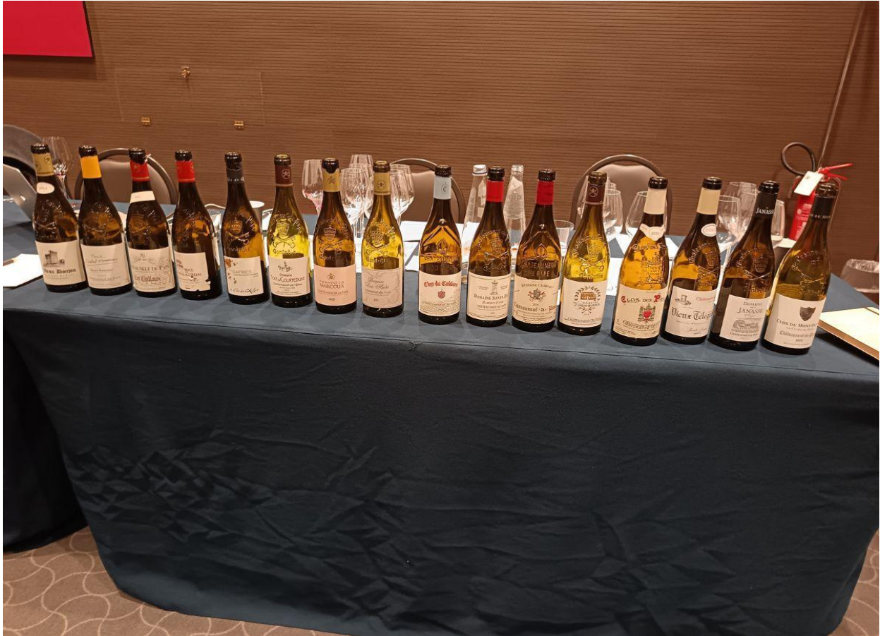
Degustazione di 16 Châteauneuf-du-Pape provenienti dai diversi terroir.