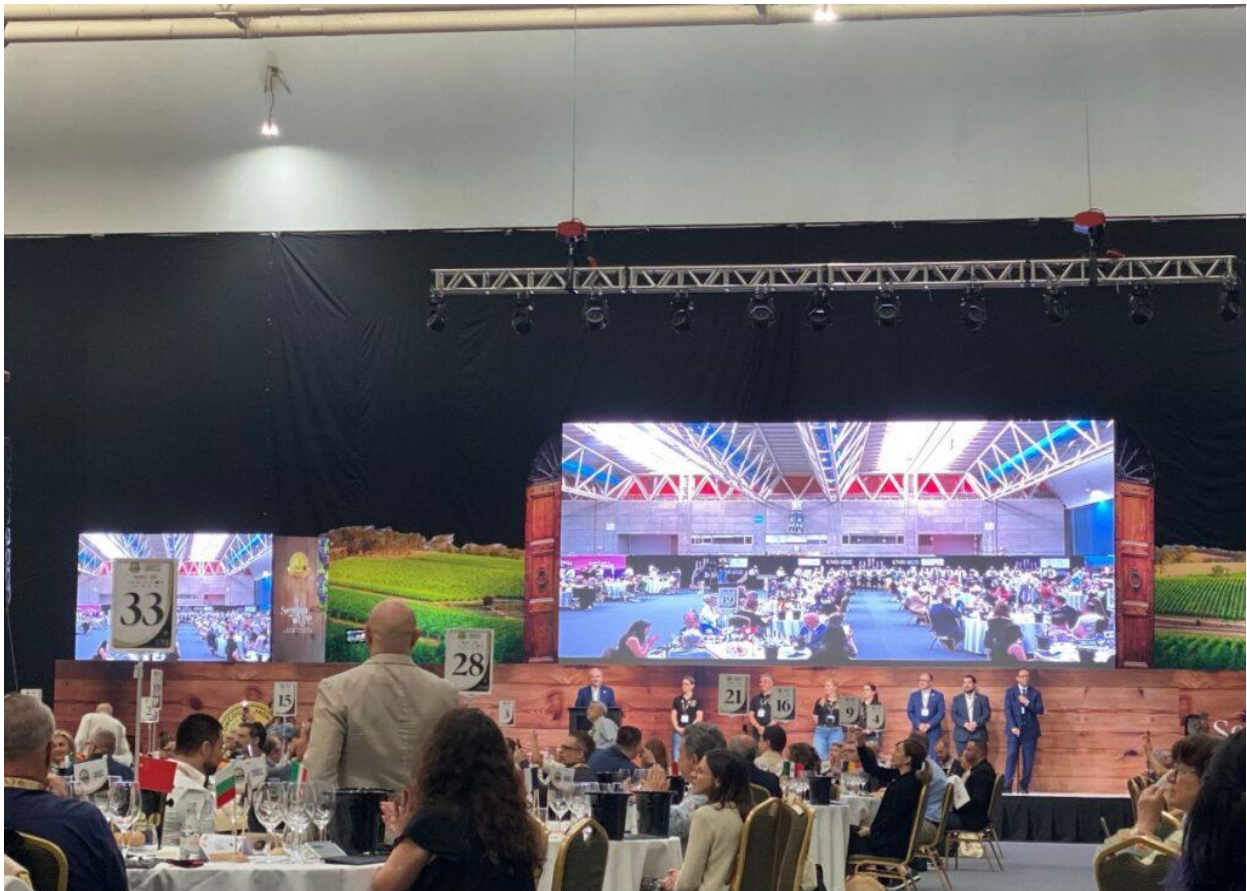
Un momento del Concours Mondial de Bruxelles 2024.