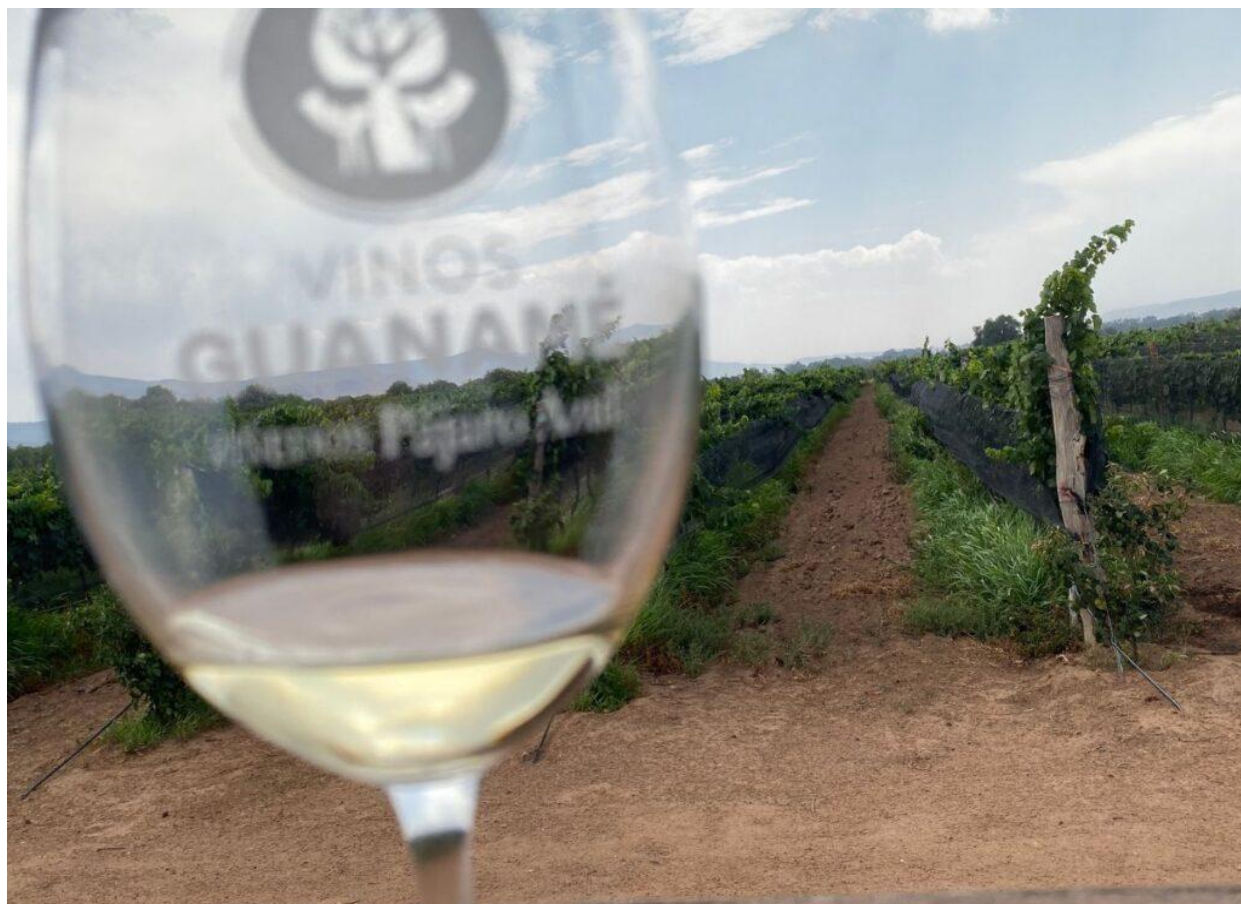
San Felipe, nel ranch Pájaro Azul.

I ventitré ettari vitati sono stati piantati a partire dal 2011, arrivando poi a produrre la prima etichetta nel 2014 di syrah, alla quale si aggiungeranno altre derivanti dai vitigni malbec, merlot, cabernet sauvignon, tempranillo, sauvignon blanc, moscatel. La produzione si attesta sulle 95mila bottiglie.