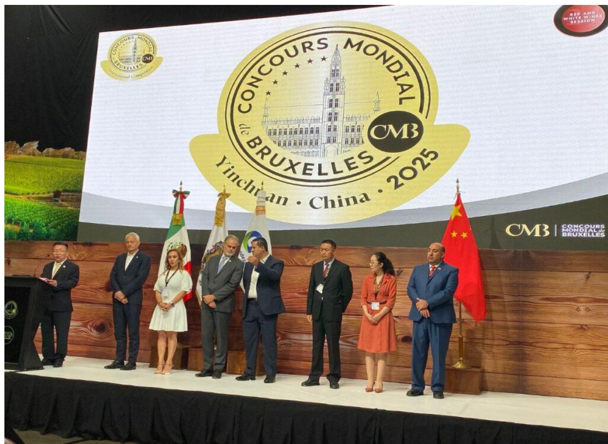
Yinchuan ospiterà l'edizione 2025.

La tradizionale cerimonia del passaggio delle consegne è avvenuta alla presenza di una delegazione del governo di Yinchuan e le autorità governative dello stato di Guanajuato, che hanno espresso il loro orgoglio nell'aver ospitato il CMB. Con 18.000 ettari di vigneti, 72 aziende vinicole, una produzione annua di 75 milioni di bottiglie di vino e un valore complessivo di quasi 4 miliardi di euro, Yinchuan, ai piedi dei Monti Helan, in Ningxia, si prospetta una meta interessante.