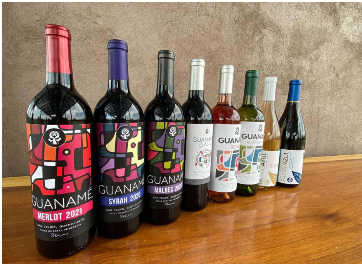
I vini dell'azienda Bodegas Guanamé.

Siamo in un'impresa familiare, che ci fa sentire calorosamente benvenuti nella loro casa. In realtà, come vediamo salendo a bordo di un tipico carro trainato da un trattore, il ranch è molto grande, ci sono mucche, cavalli, ovini. Infatti sono anche un caseificio. Ci hanno preparato un pranzo tipico messicano, con musica locale ed esibizione di cavalli. La simpatia e la passione dei tre fratelli Torres Barrera ci resterà impressa.