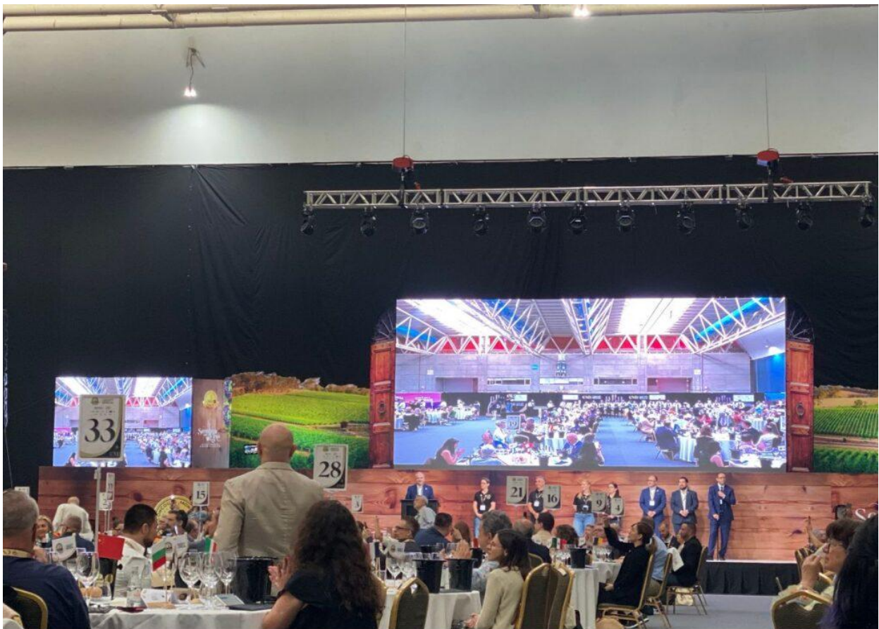
Un momento del Concours Mondial de Bruxelles 2024.