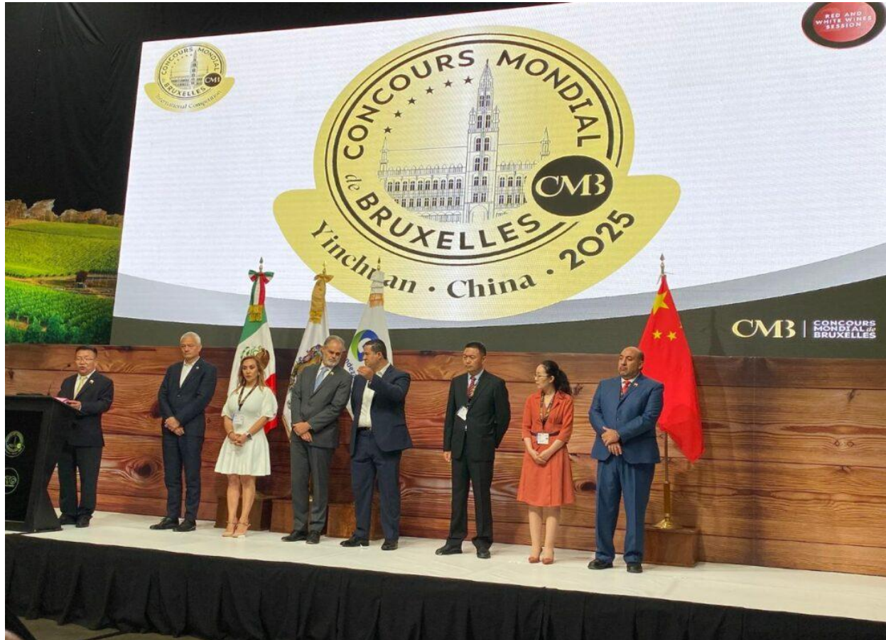
Yinchuan ospiterà l'edizione 2025.

La tradizionale cerimonia del passaggio delle consegne è avvenuta alla presenza di una delegazione del governo di Yinchuan e le autorità governative dello stato di Guanajuato, che hanno espresso il loro orgoglio nell'aver ospitato il CMB. Con 18.000 ettari di vigneti, 72 aziende vinicole, una produzione annua di 75 milioni di bottiglie di vino e un valore complessivo di quasi 4 miliardi di euro, Yinchuan, ai piedi dei Monti Helan, in Ningxia, si prospetta una meta interessante.