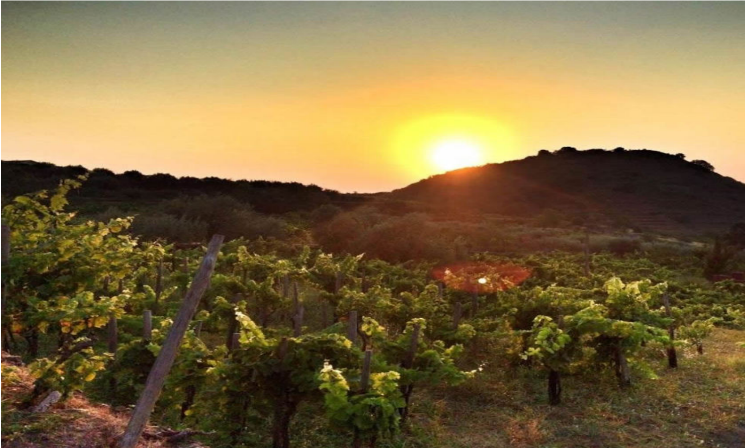
Vigneto “Cisterna Fuori” di Palmento Biondi a Tre Castagni.

La magia dell’Etna rapisce, impossibile sfuggire. “Un’isola nell’isola” dal fascino unico, differente dal resto della Sicilia. Una delle tappe più scenografiche è il versante est , caratterizzato dall’enorme caldera della Valle del Bove .