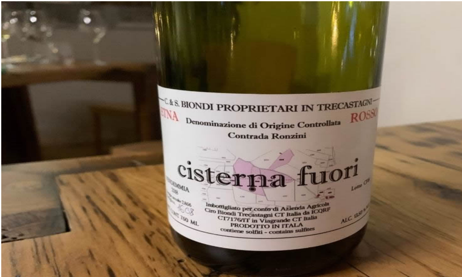
Vino Cisterna Fuori 2018 – Palmento Biondi.