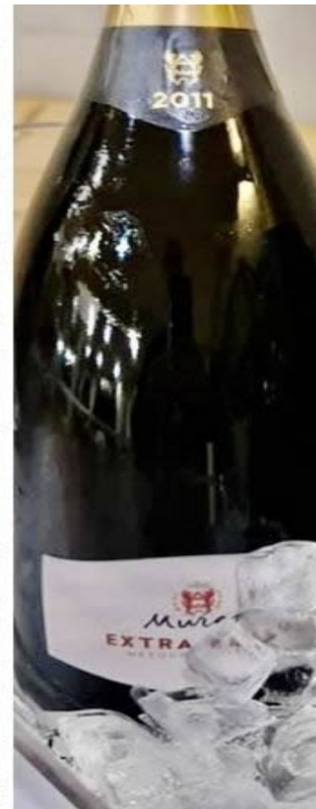
Particolare pupitres di Cantina Murgo e Murgo Extra Brut Metodo Classico 2011 (Foto © Amanda Arena).