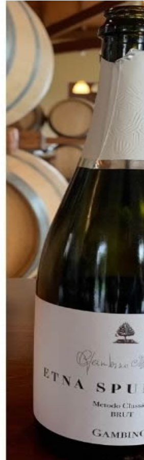
Vigne Nerello Mascalese di Gambino e il Maria Gambino Brut Metodo Classico 2015