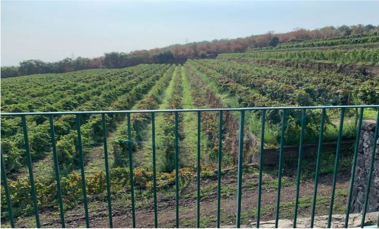
Vigneti terrazzati a Linguaglossa, della Cantina Gambino.

L'attenzione per ogni fase del processo produttivo consente di ridurre l'utilizzo dei conservanti sotto la soglia della certificazione biologica. Di carattere deciso e identitario il Maria Gambino Brut Metodo Classico 2015 , ottenuto da un'accurata selezione di uve di Nerello Mascalese coltivate a 800 metri s.l.m. e da una pressatura soffice. I terreni lavici celebrano il loro patrimonio minerale in un vino verticale, che profuma di note agrumate, erbe officinali, ricordi di pasticceria e note iodate. L'affinamento di 48 mesi "sur lies" in bottiglia definisce un sorso di decisa struttura, brioso, fresco, armonico, dal perlage fine e di buona persistenza.