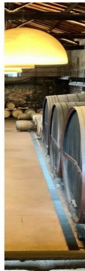
Etna Bianco Superiore “Contrada Villagrande” DOC 2018 – Barone di Villagrande