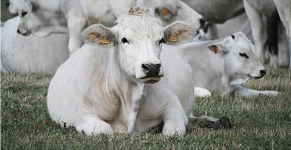
Alcuni capi di bovino romagnolo.