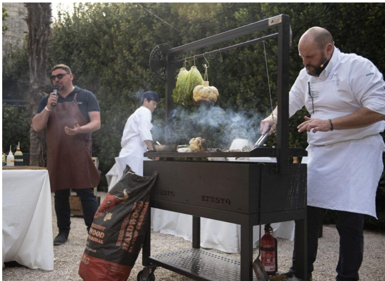
Il Tratro Grill e BBQ.