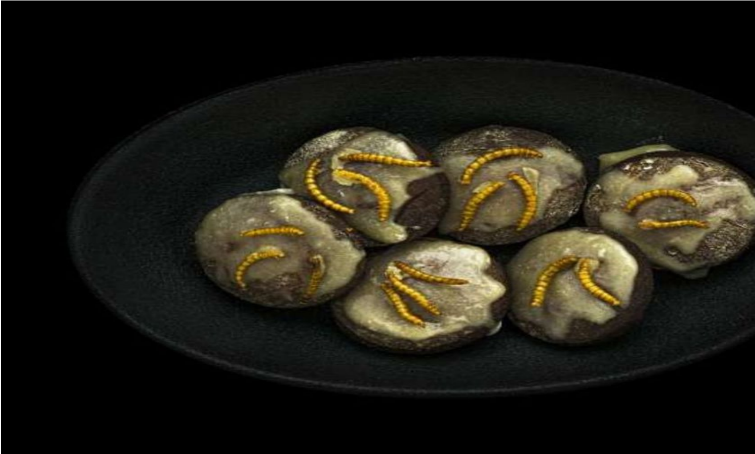
Pan di Camole avec Tenebrio Molitos.

Insetti a tavola? Pare di sì, ma non subito. Dopo le tarne della farina , quest'anno l'EFSA ha dato il via libera anche al consumo alimentare di locuste migratorie . Tuttavia uno spuntino a base di questi insetti, da noi in Europa, non sarà possibile in tempi immediati in quanto sono ancora in fase di definizione le condizioni d'uso e di commercializzazione, oltre alla determinazione di specifici requisiti di etichettatura per le allergie, che dovrà poi essere adottata dalla Commissione europea e dagli Stati membri dell'Ue.