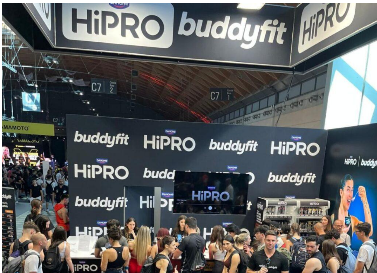
L'evento di HiRO di Danone e Buddyfit.

Per la prima volta i due brand HiRO di Danone e Buddyfit hanno unito le forze, animando la manifestazione con momenti di workout (allenamento) e alimentazione sportiva, con l'obiettivo di ribadire quanto sia importante, e allo stesso tempo accessibile a tutti, unire allenamento e corretta alimentazione