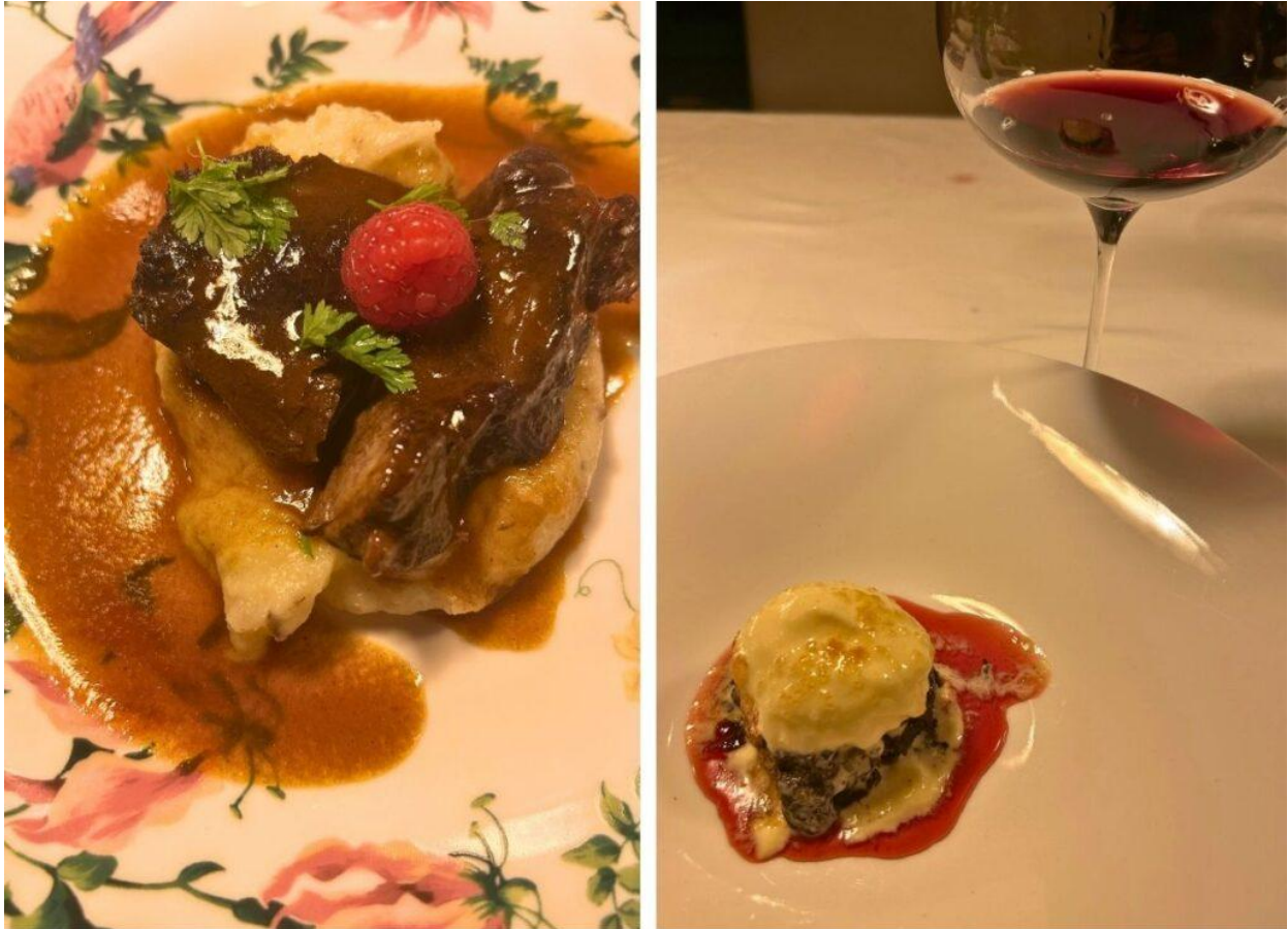
Manzo, lamponi, patata e tartufo | Cioccolato, amarena e crema al marsala (Giuseppe De Biasi).

Dessert declinato in un ben calibrato tritico composto da Cioccolato, amarena e crema al marsala , che letti nella loro semplice descrizione non rendono merito alla complessità gustativa e il paritetico equilibrio mostrati nel piatto. E lì dove i presenti si sarebbero aspettati l'arrivo a tavola del Recioto della Valpolicella Classico DOCG (che per inciso con la sua dolcezza innervata di balsamicità e freschezza, da solo sarebbe bastato a suggellare la cena) ecco l'elemento spiazzante: la comparsa nel calice di un fuoriclasse (e per di più di una annata eccezionale per la Valpolicella come la 2016) qual è il Cesari Amarone della Valpolicella Classico Riserva DOCG Bosan 2016 .