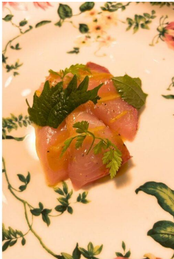
Carpaccio di ricciola, arancia e shiso verde (Giuseppe De Biasi).