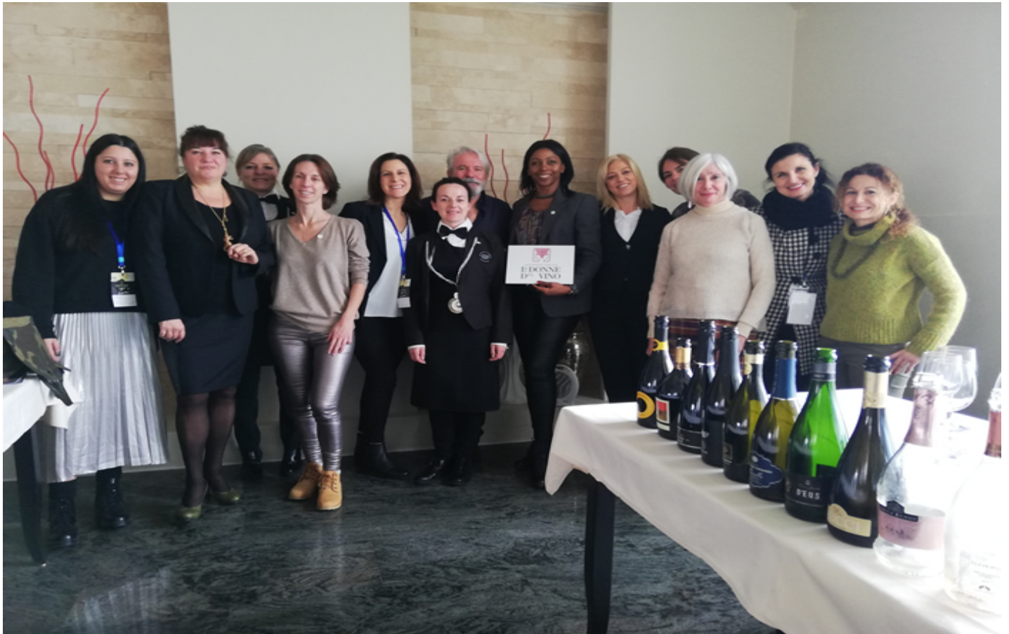
Le Donne del Vino, madrine della serata sugli “Ambasciatori del brindisi italiano”.

. Un accordo sottoscritto dall'Università di Teramo con alcune cantine cooperative abruzzesi della provincia di Chieti e aziende agricole, Università di Chieti-Pescara e il Polo Agire. Obiettivo la valorizzazione dei vini spumanti da varietà autoctone d'Abruzzo.