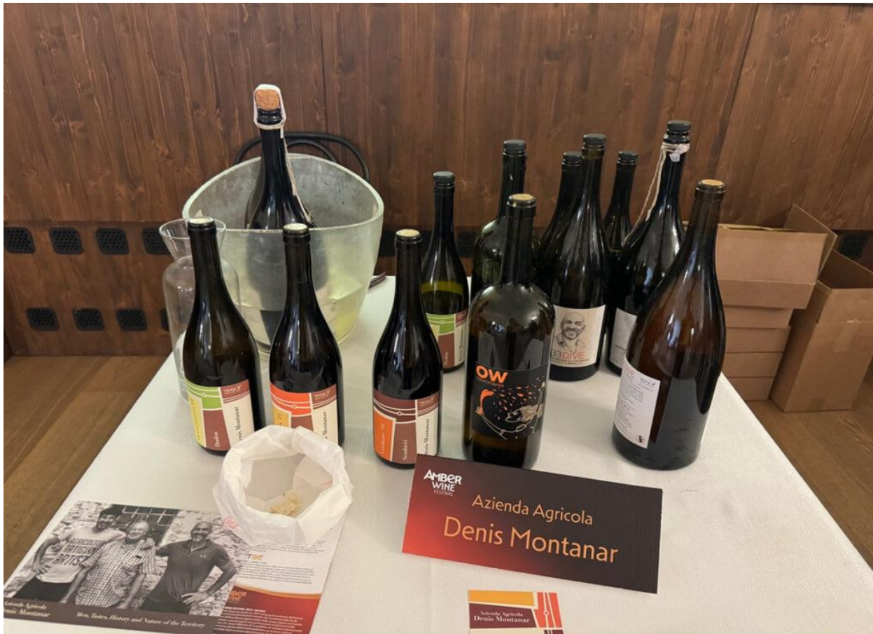
Una delle aziende presenti all'evento (Foto © Giuditta Lagonigro).

È fondamentale, inoltre, che in campagna e in cantina vengano usate pratiche a bassissimo impatto ambientale.