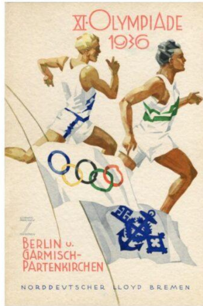
300 dpi_S.S. Stuttgart, 12 agosto 1936 – Menu pubblicitario dei Giochi Olimpici di Berlino