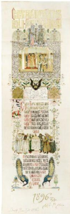
1896. L'incoronazione dell'ultimo Zar