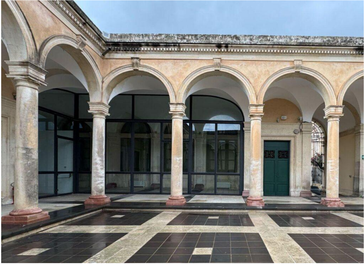
L'interno dell'Antico Mercato di Ortigia.