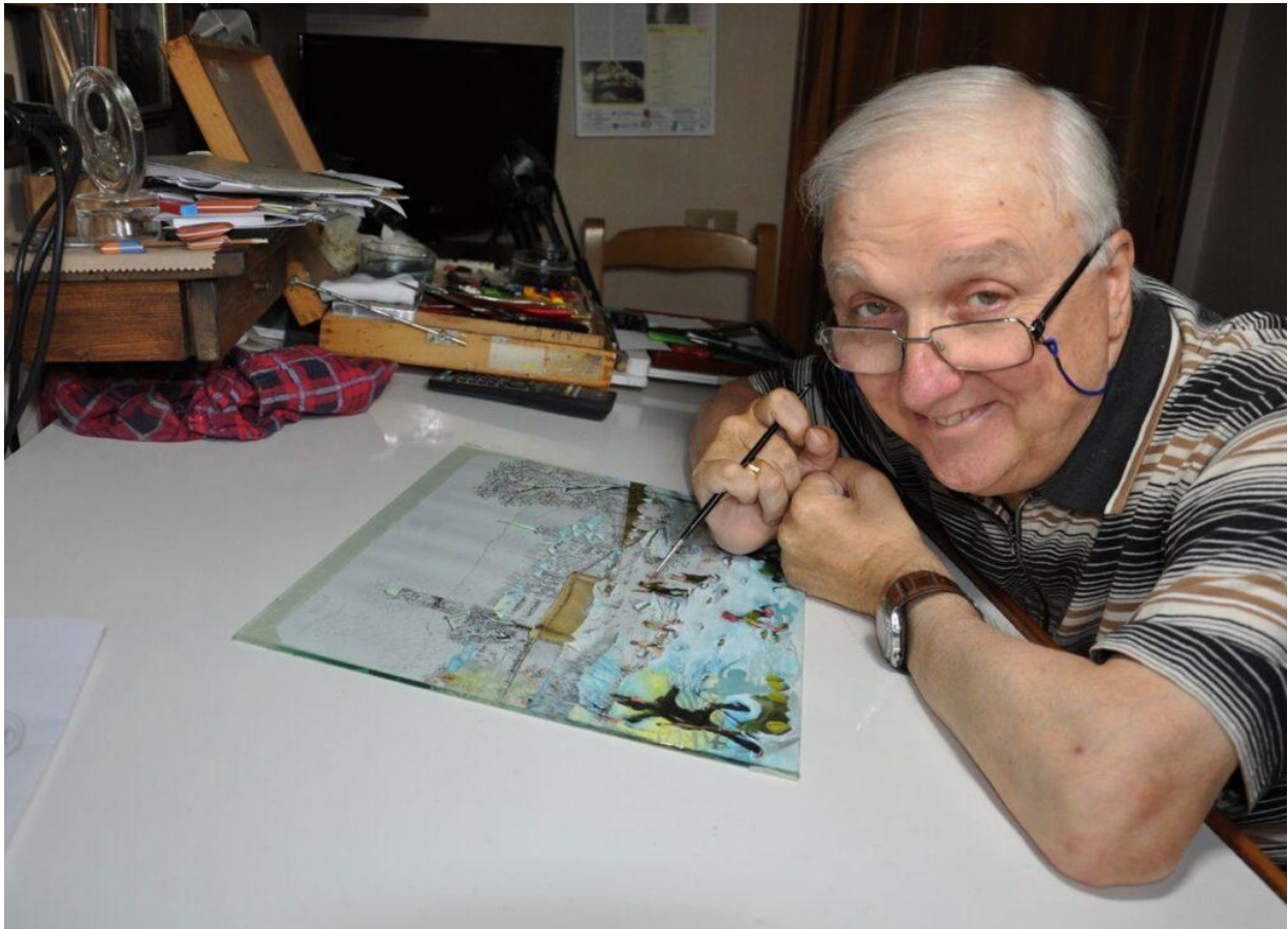
L'artista al lavoro nel suo studio.

Classe 1953, Previ è interprete di un'arte autentica frutto di un percorso umano segnato da un grave incidente all'età di 18 anni che l'ha costretto su sedia a rotelle. Nonostante questa condizione, tuttavia, l'artigiano ha mostrato resilienza e passione sviluppando la tecnica rara dell' olio su vetro rovesciato che rende ogni suo lavoro una finestra sul passato contadino, sulla fede, sulle relazioni familiari e sulle storie antiche della Val di Taro.