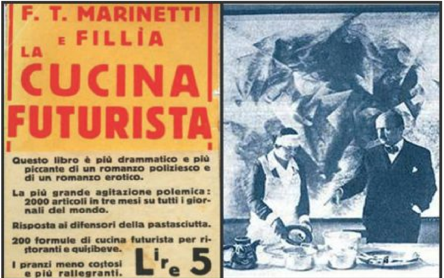
Filippo Tommaso Marinetti in cucina.

Era il dicembre del 1930 e dai microfoni della radio, il fondatore del Futurismo – Filippo Tommaso Marinetti – metteva in ridicolo il pilastro alimentare italiano: la pastasciutta . Tra le altre cose affermava che « Pur riconoscendo che uomini nutriti male o grossolanamente hanno realizzato cose grandi nel passato, noi affermiamo questa verità: si pensa, si sogna e si agisce secondo quel che si beve e si mangia. »