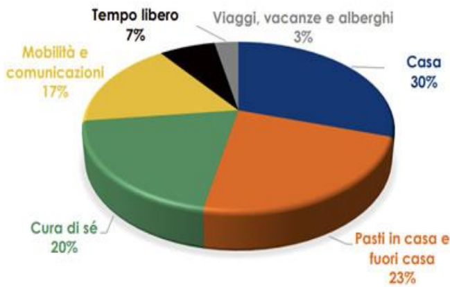
Quota spesa per macro-categoria (stime 2023)