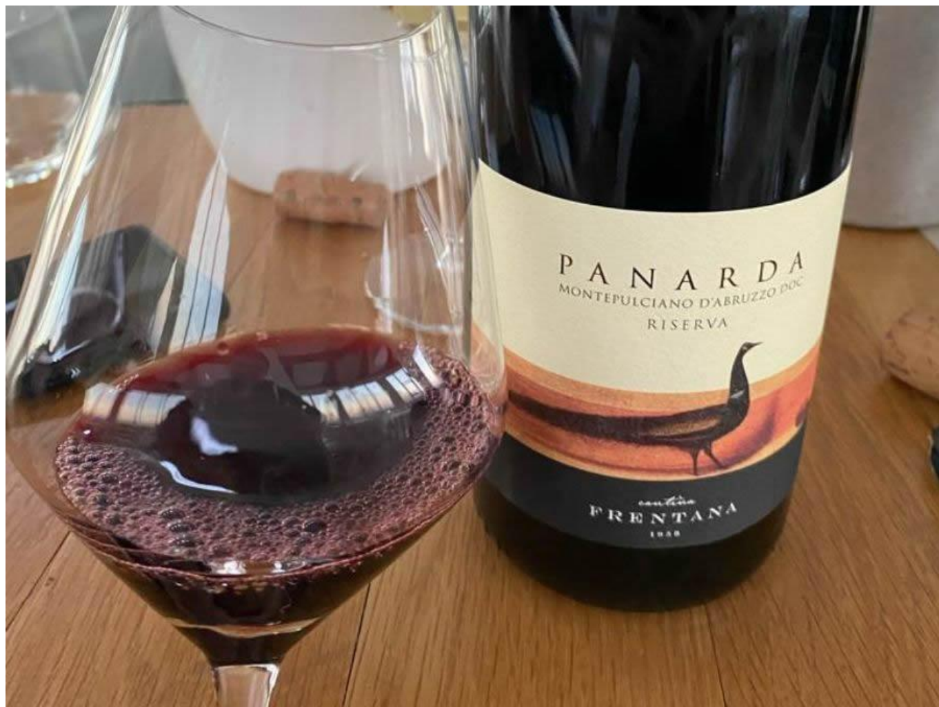
Panarda Montepulciano d'Abruzzo DOC.

Assaggiare questi vini è come fare un viaggio attraverso le tipicità di un territorio dalle mille sfaccettature, in cui si fondono gli elementi marini della costa dei trabocchi con quelli più impervi di una collina che strizza l'occhio alla Majella. Un territorio in cui le escursioni termiche regalano ai vini grande freschezza e dove il fattore umano (e il duro lavoro degli oltre 400 soci conferitori) fa la differenza.