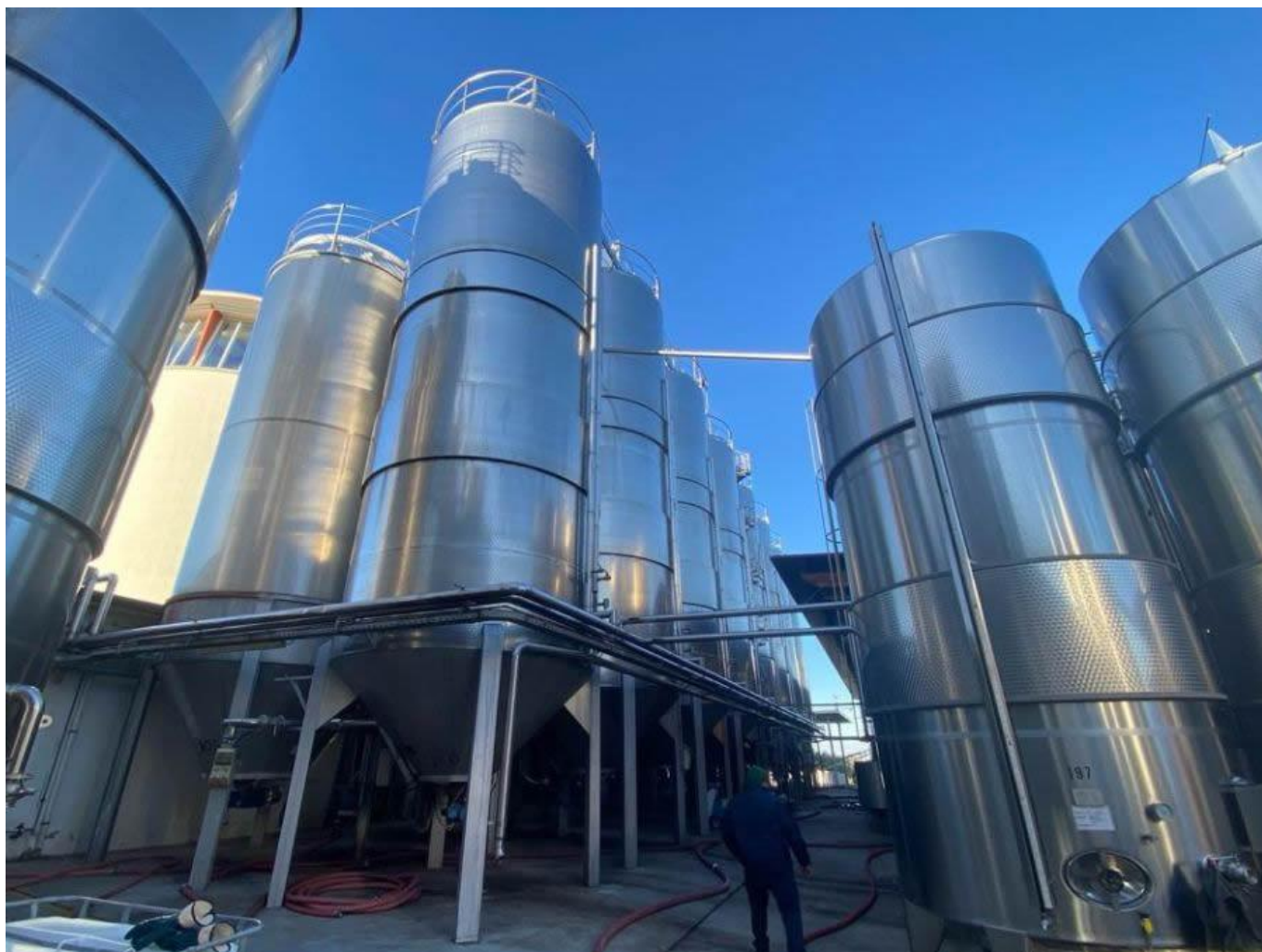
Un particolare dello stabilimento dell'azienda Frentana.