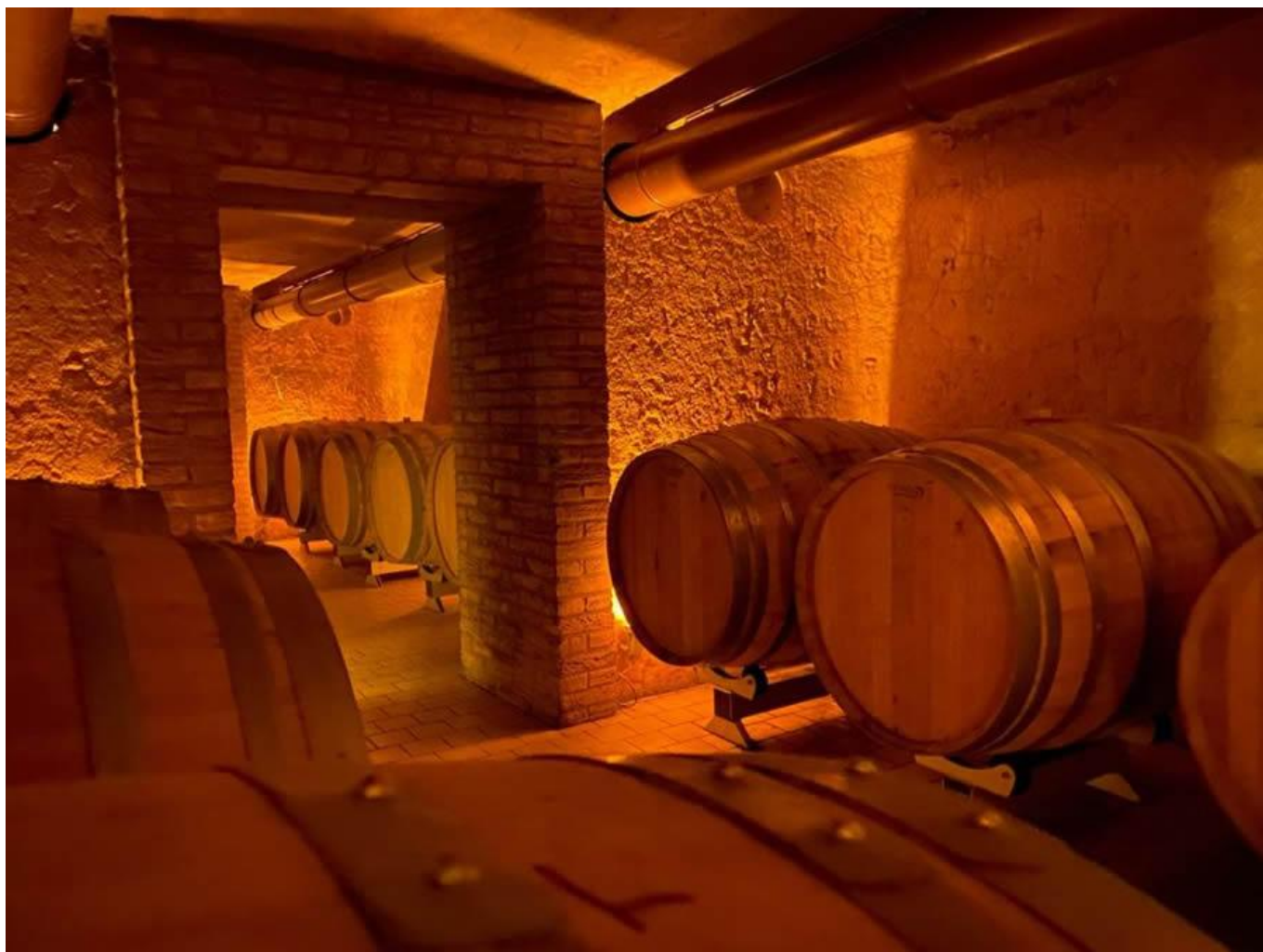
Botti per l'affinamento.

La cernita delle uve e i moderni sistemi di vinificazione utilizzati, dunque, rappresentano i valori aggiunti di Cantina Frentana , imponente e al contempo accogliente e a misura d'uomo.