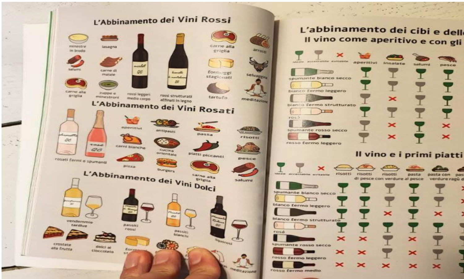
Illustrazioni chiare per comprendere l'abbinamento cibo-vino.