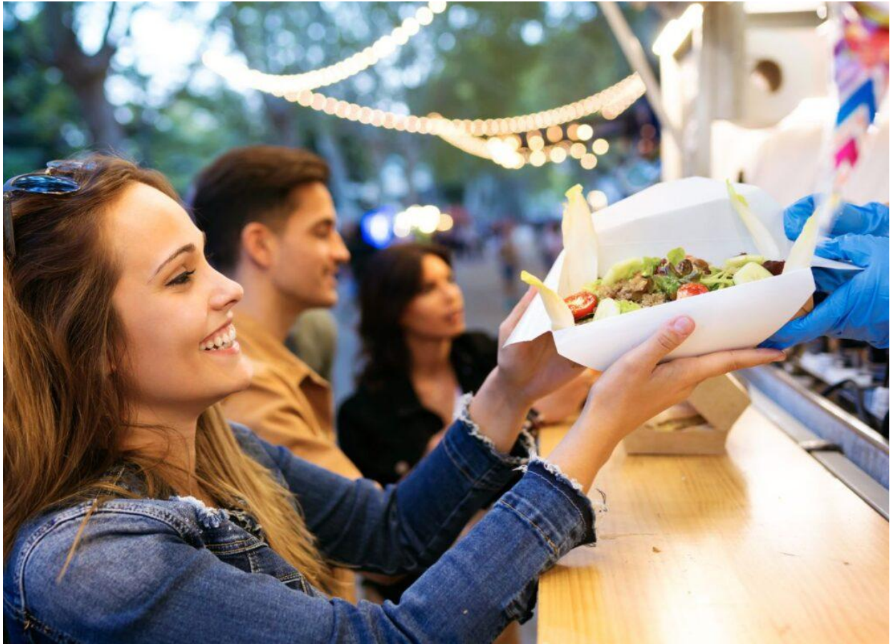
La guida Street Food 2025 del Gambero Rosso

Non solo un elenco di locali, ma un tributo alla cultura enogastronomica italiana, che continua a evolversi e a sorprendere. Ogni edizione testimonia infatti l'inarrestabile crescita e il continuo rinnovamento di un settore che sa unire tradizione e innovazione in un'esperienza unica e coinvolgente per tutti gli appassionati del buon cibo.