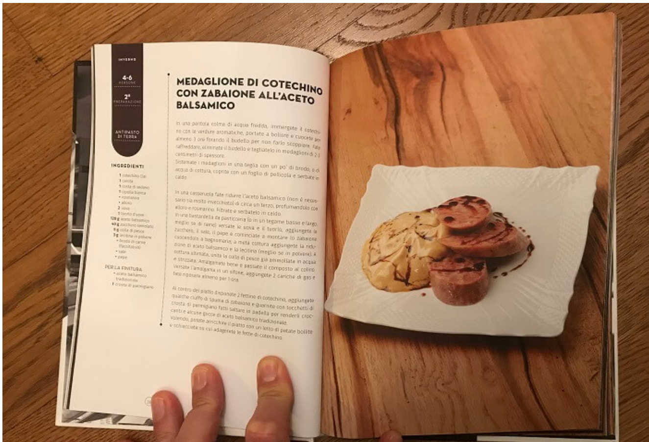
Una delle ricette del libro.