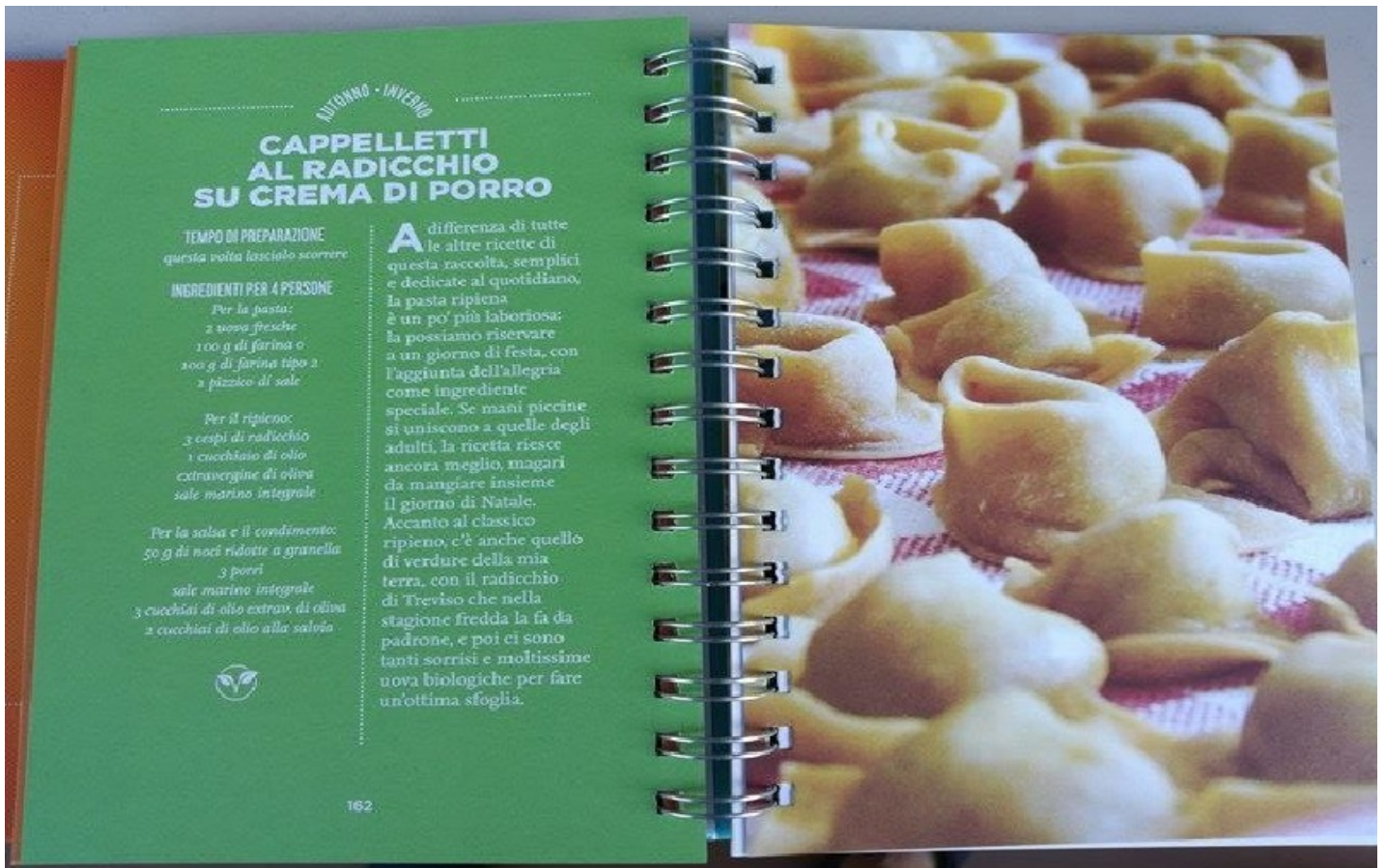
Cappelletti al radicchio su crema di porro (Foto © La Gazzetta del Gusto).

La seconda parte del libro contiene le ricette: colorate, semplici, veloci da realizzare; gli ingredienti e le preparazioni, garantiscono un equilibrio tra sapore e proprietà benefiche per il fisico. A dispetto del titolo del libro, non troviamo solo insalate (che, peraltro, vengono distinte in base alle stagioni) ma anche primi piatti, condimenti, sughi vegani e torte salate, il tutto centrato sul mondo vegetale. Senza perdere di vista le tradizioni gastronomiche italiane, verdure, ortaggi, legumi, cereali, erbe aromatiche, spezie, frutta tropicale e riso vengono mescolati in modo creativo per piatti dagli abbinamenti insoliti.