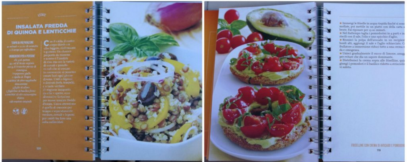
Ricette del libro.

Prima l'insalata! – 7 passi e 50 ricette per stare bene