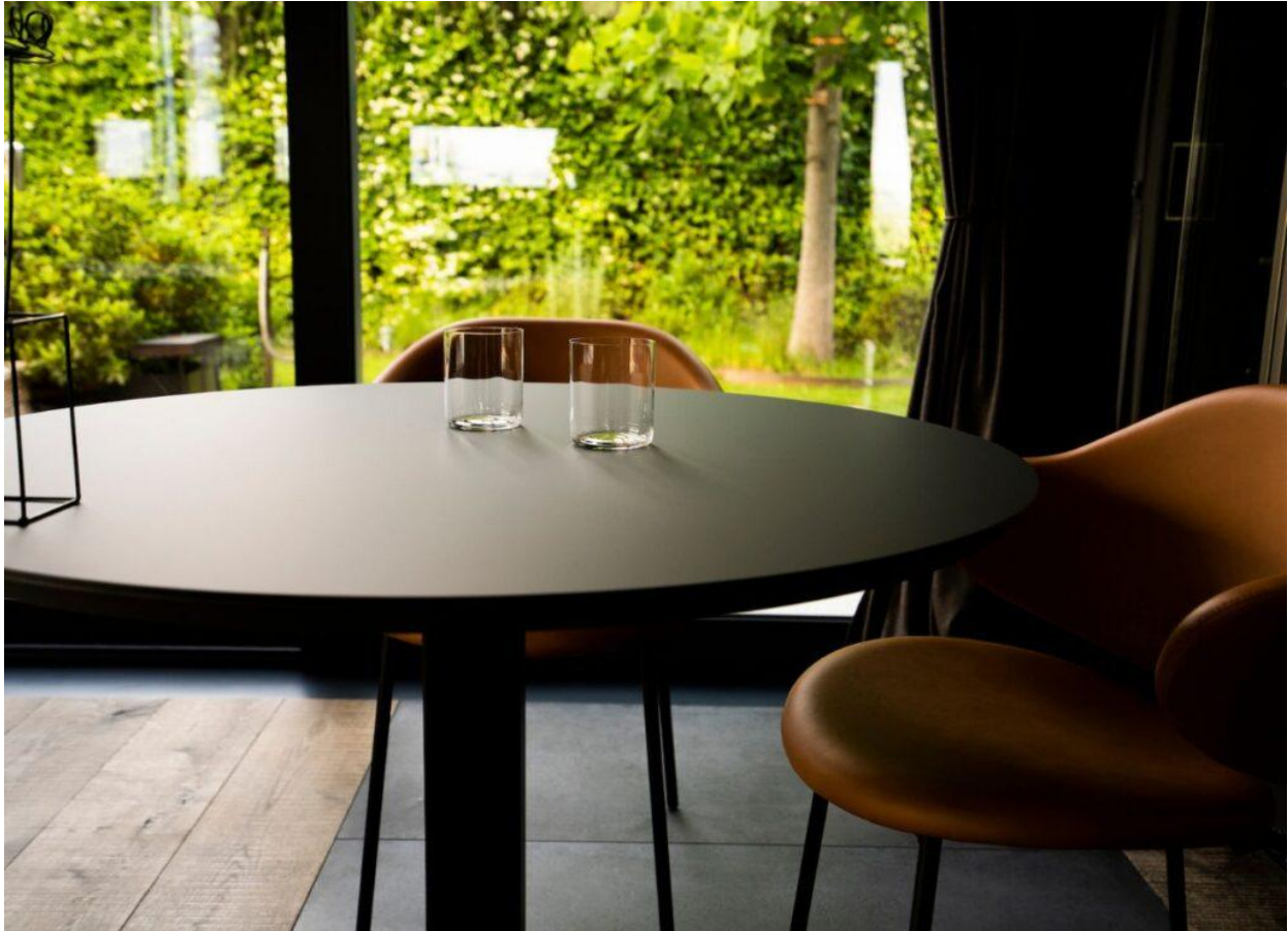
Un particolare della sala di Osteria arborina.

«Per me la cucina “Zero Waste” significa tradizione – spiega lo chef – perché la cucina italiana si basa sull’evitare completamente gli sprechi: qualsiasi ingrediente e preparazione può essere riusato».