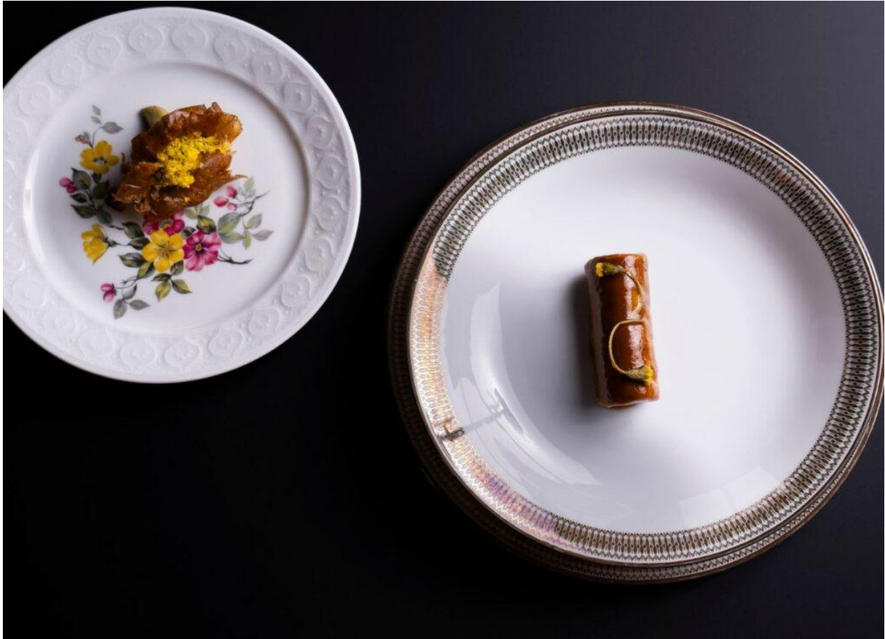
Tonno di coniglio.