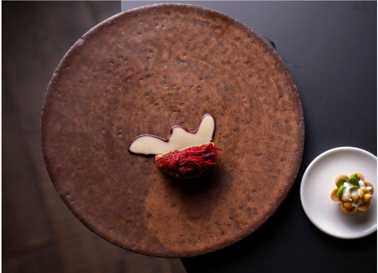
Il nuovo menù dello chef Forino (Foto © Stefano Caffarri).