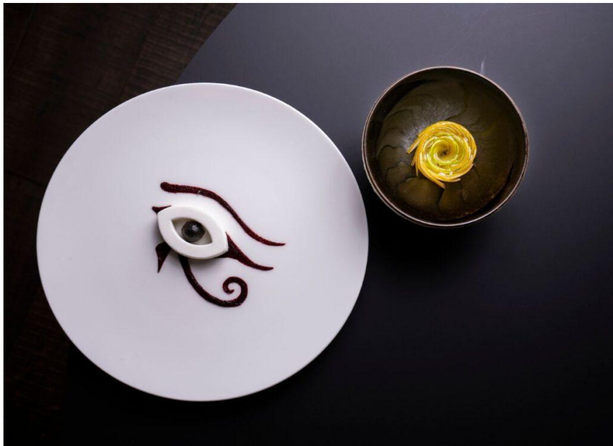
Il dessert "Seirass".

Osteria Arborina Frazione Annunziata 27, La Morra (CN) – Telefono: 0173 500340 arborinarelais.it