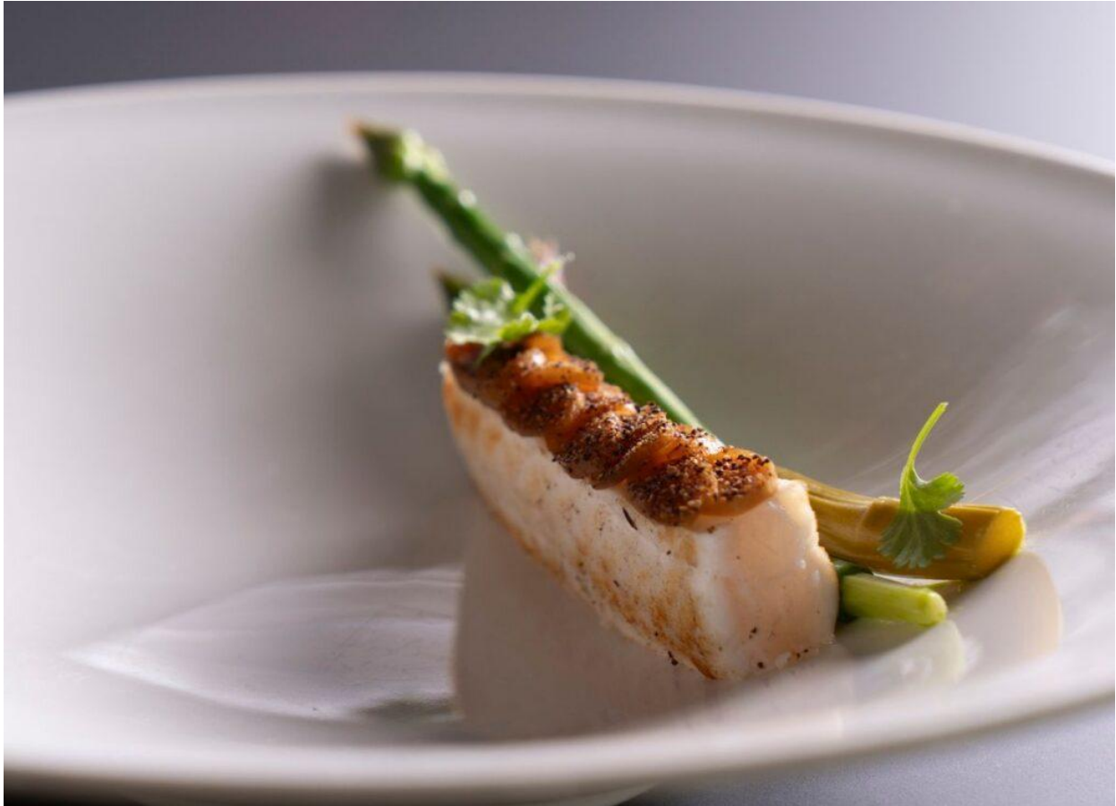
Sogliola in ceviche.

Tra i piatti che indubbiamente hanno meritato e valgono l'assaggio, Alici in verde , Tonno di coniglio , il Risotto con cipolla e lampone , la Sogliola in Ceviche e il dessert finale su una variazione della coppa Sabauda : piatti in cui la tecnica è sempre al servizio del gusto, di un gusto elegante però, goloso ma mai ruffiano e che anzi molto spesso spinge e provoca il palato (come nel carciofo che accompagna il tonno di coniglio o nell'insalata a rinforzo delle alici in verde) per poi ritrovare, alla fine del piatto, un suo equilibrio. Un equilibrio, però, non semplicemente confortante, è molto di più: perché è stimolante.