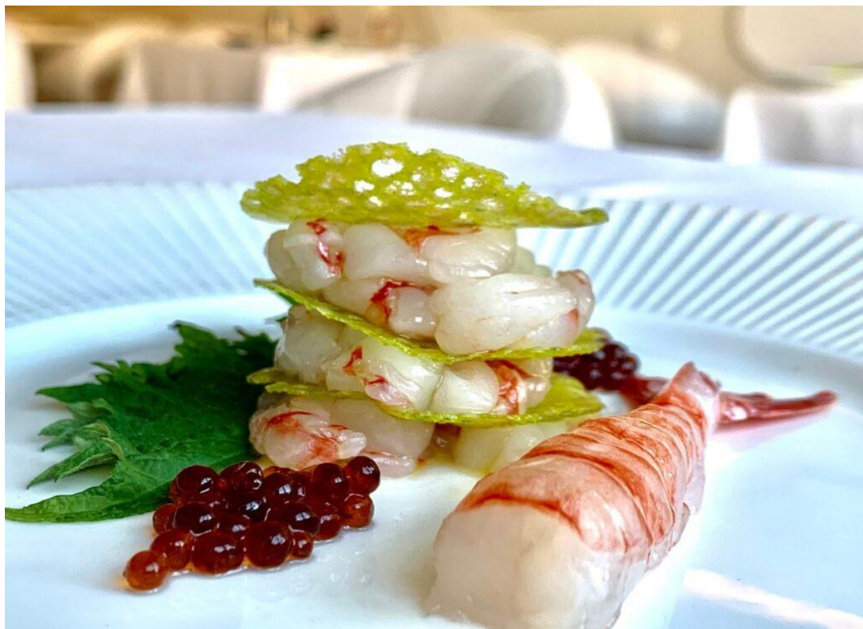
Uno dei piatti dell'Antinoo's Lounge & Restaurant.

«Il nome del ristorante – ci spiegano – è un omaggio al fascino dell'antica Grecia le cui suggestioni sono legate all'Impero Romano e al mito dell'amore eterno. Durante le opere di ristrutturazione di Palazzo Genovese è stata infatti trovata nella vera da pozzo del cortile interno una moneta di epoca romana, raffigurante l'effigie di Antinoo, il giovane greco prematuramente scomparso e di cui s'era innamorato l'imperatore Adriano»