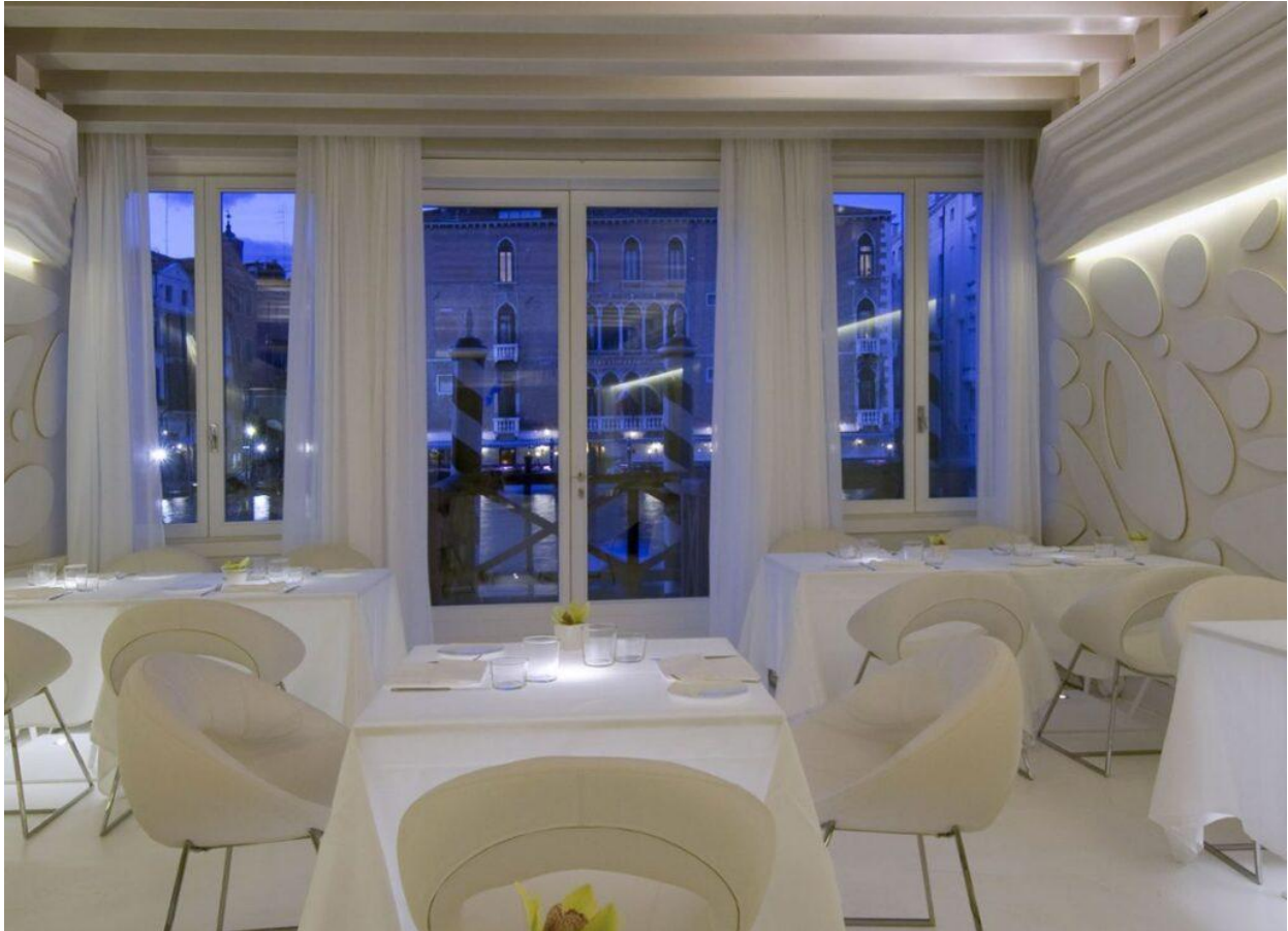
La sala dell'Antinoo's Lounge & Restaurant.

L'eccellenza dell'arte contemporanea, che pullula nel sestiere di Dorsoduro, il più antico di Venezia, "contagia" anche questo lussuoso hotel con le numerose opere di artisti presenti, ma grazie anche al piacevole contrasto con quegli arredi e gli interni dal design contemporaneo che con tocco d'autore hanno saputo ricreare, in chiave appunto moderna, le atmosfere tipiche della Serenissima: sottolineate tanto dal lampadario nella hall che dal bancone all'accoglienza in vetro di Murano ma anche dall'impiego dei velluti rossi. Il suo ristorante gourmet, l' Antinoo's Lounge & Restaurant , con le due belle sale dedicate – una rossa e l'altra di un bianco candido, ma dove l'affaccio più spettacolare se lo ritagliano i tavoli all'aperto affacciati direttamente sul Canal Grande – ci permettono di avvicinare la cucina ispirata di Giancarlo Bellino , chef di origini pugliesi, che in tavola porta anzitutto le suggestioni legate al pesce di mare.