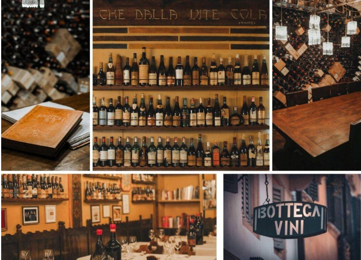
Altri particolari dell'iconico locale veronese.

esserci per vivere un'esperienza unica. D'altronde la Bottega è un hit, un must. Per capirlo basta passarci davanti (fino a tardi, nella notte) durante i giorni in cui la città è capitale del vino. Nessuno può dire di essere stato davvero al Vinitaly se non "timbra" qui: e la folla allegra, vivace ma composta che riempie il pezzo di isola pedonale e la stradina intera è un'onda continua, dal primo momento "ape" all'ultimo bicchiere della chiusura notturna.