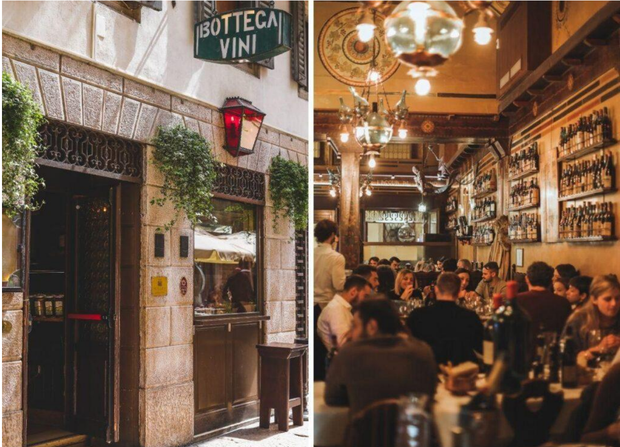
L'ingresso dell'Antica Bottega del Vino in Vicolo Scudo di Francia.