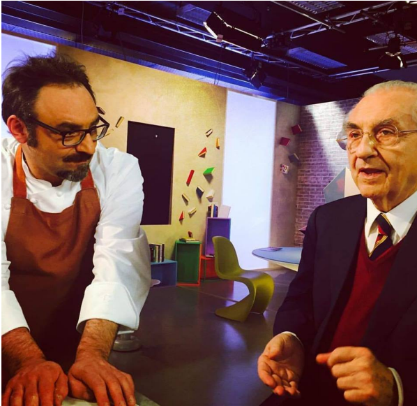
Con Gualtiero Marchesi.

Si potrebbe iniziare dalla prima esperienza, la più “banale”, quella vissuta con Gualtiero Marchesi , l’indiscusso Maestro della cucina italiana. Lopriore ha cominciato proprio lì, alla fine degli anni ’80 e dell’istituto alberghiero, in una cucina ostica, competitiva e illuminante. In quel luogo ha assorbito il ritmo e la filosofia di un vero ristorante d’alta gastronomia, nonché l’arte dello stesso Marchesi: una « nouvelle cuisine » italo-francese semplice, radicata nella tradizione regionale e nazionale, concentrata sulla materia prima, votata all’arte.