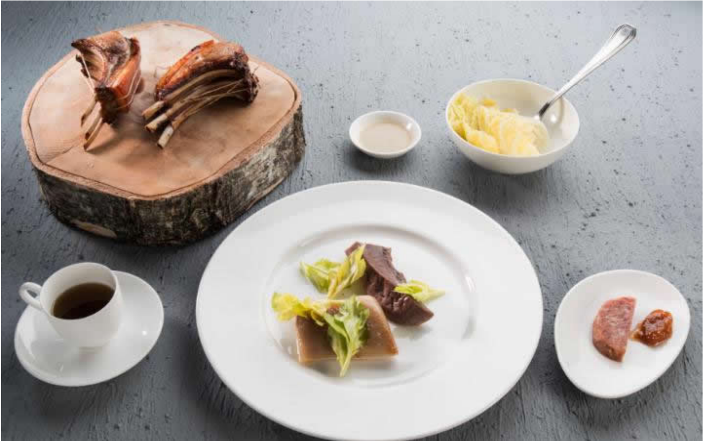
Cassoeula con salsa di semi di carota.

Il cuoco si può concentrare sulle singole tecniche e materie prime, il cameriere diviene attivo nella presentazione e nell'esposizione dei piatti, il cliente può personalizzare e condividere; finalmente possono interagire tra loro.