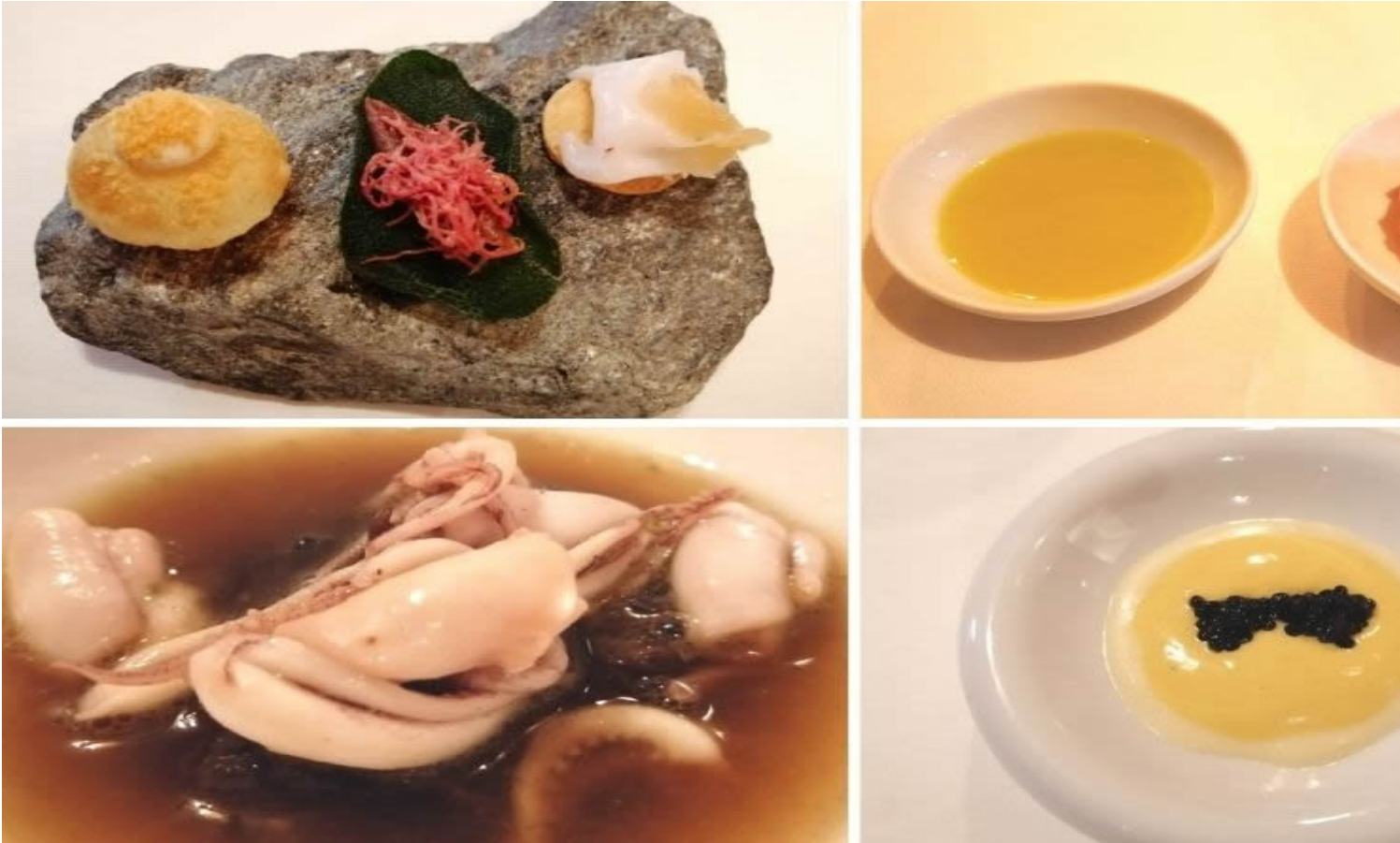
I vari antipasti e il Brodetto di spugnone, totano e fitoplancton.