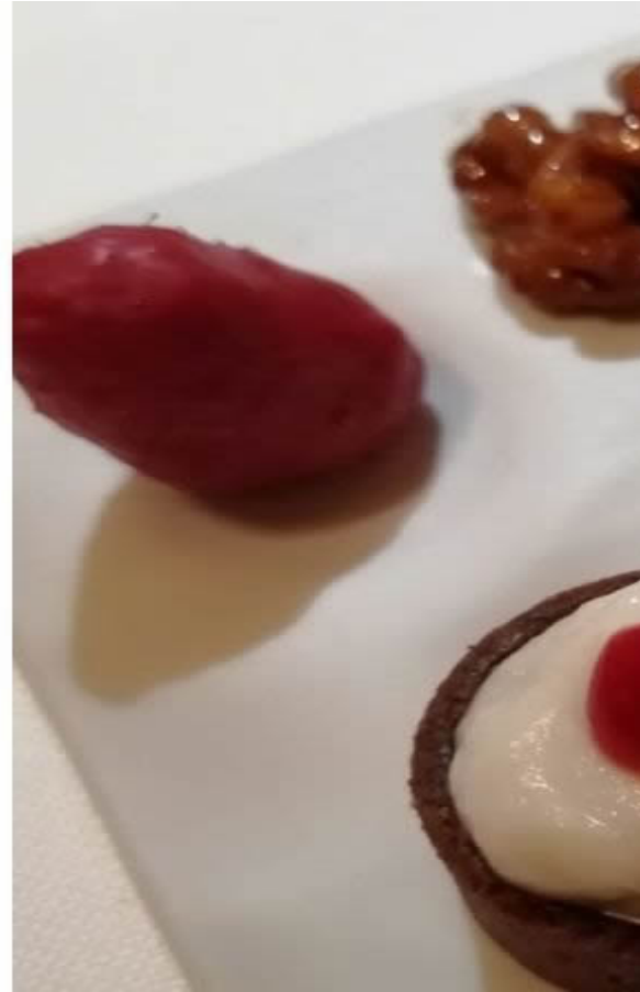
Il Sorbetto all'anguria e salsa alla menta e la piccola pasticceria.