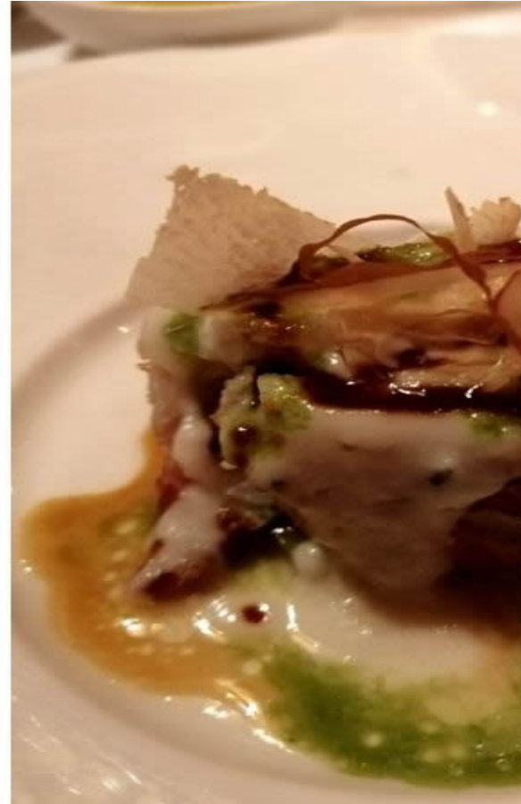
Penne all'arrabbiata di gamberi viola e il Rombo in porchetta, topinambur e crescione di fiume