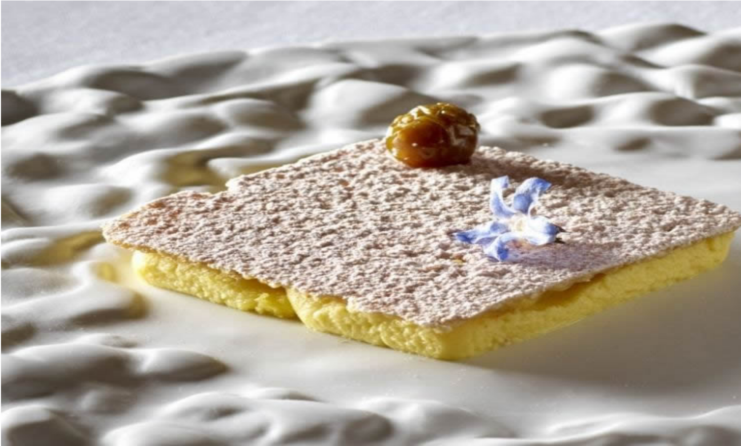
Brûlé al Taleggio, croccante di sesamo al Mugo e alchechengi senapate (Foto © Ufficio stampa).

sua esperienza, la giusta frollatura con il corretto passaggio nella grotta del sale; e infine ci sono il blue del cuore del diaframma e il rosso delle more. Acidità e morbidezza. La ricchezza della semplicità.»