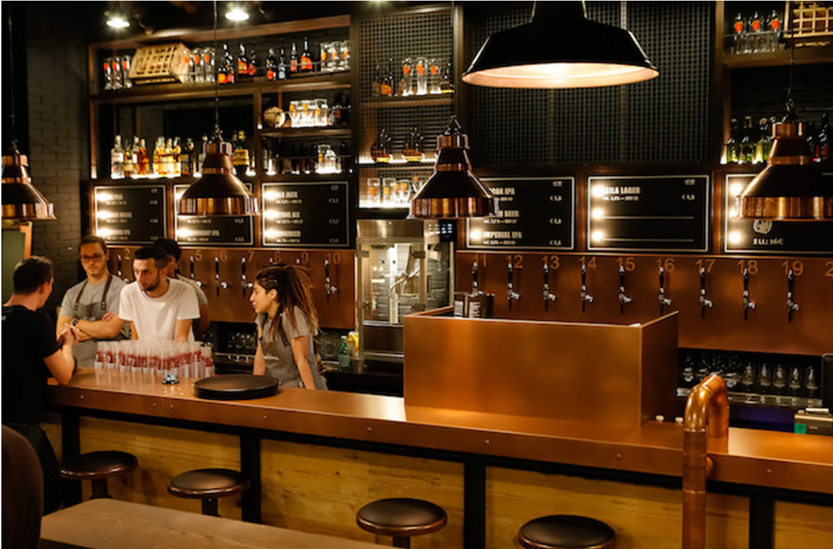
Doppio Malto Bologna, il bancone bar (Foto © Doppio Malto).

Doppio Malto Brew Restaurant è approdato anche a Bologna, in via Stalingrado 42, a pochi passi dal quartiere fieristico e a soli 3 km dal centro storico. Pur inserendosi in un contesto cittadino affollato di bar, ristoranti e pub che sono raddoppiati negli ultimi 4 anni, il progetto ha tutte le carte in regola per essere qualcosa di diverso e per raggiungere il successo.