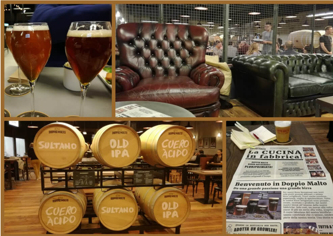
Scatti della serata di inaugurazione.