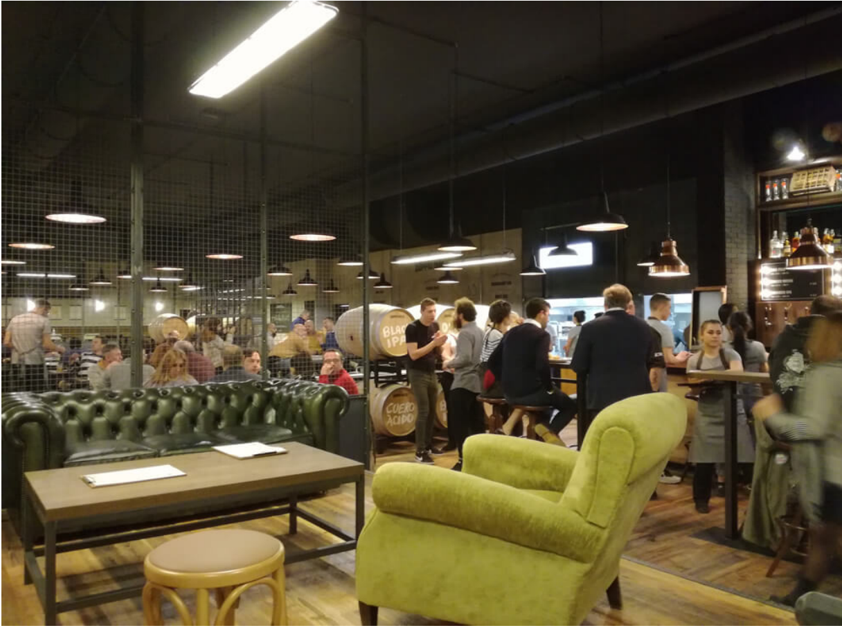
Spazi ampi e confortevoli per Doppio Malto Bologna (Foto © Enzo Radunanza).

Colpisce la vivacità del personale, giovane e sempre pronto a regalare un sorriso, l'ampiezza dei locali e la loro luminosità, l'allegria e la versatilità degli ambienti. Ogni angolo ha una sua caratteristica, dai tavoli conviviali alle poltrone vintage, dal bancone imponente all'area con gli "sport da birreria" come il biliardo, il calcio balilla e le freccette. Un posto di ritrovo anche in occasione di eventi sportivi a cui assistere da diversi monitor. Nell'estate 2018, inoltre, aprirà il beer garden , per rinfrescarsi con una buona birra durante le giornate calde.