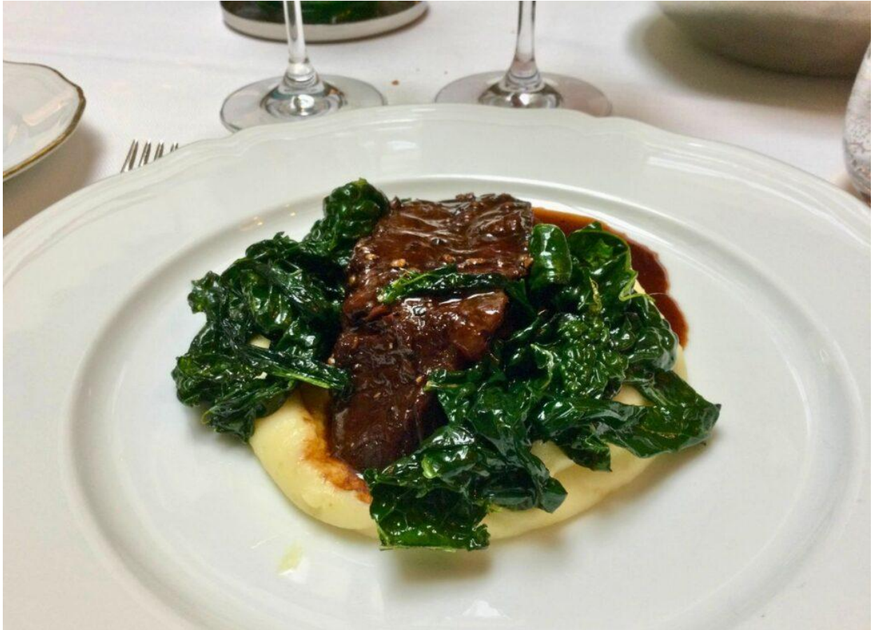
Una delle portate del menu di Atto.