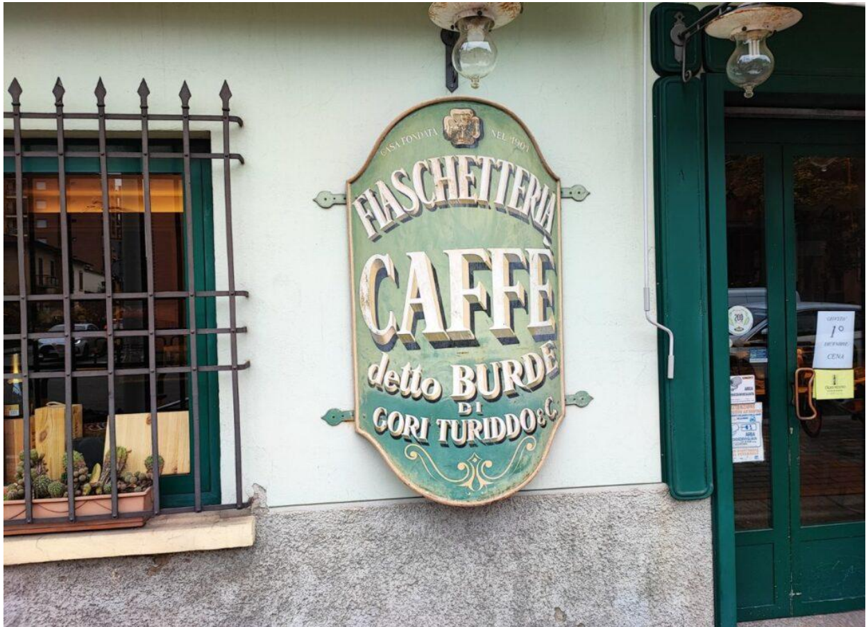
L'ingresso della storica Trattoria Da Burde.