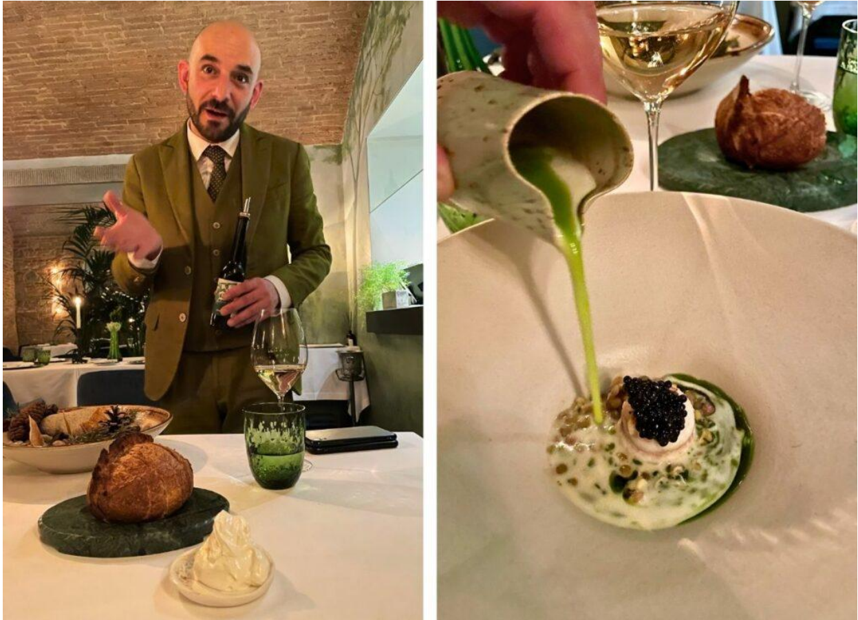
Un momento del pranzo presso Saporium.

La stagione che non c'è rispecchia la cucina di Saporium, non solo secondo le regole della biodinamica e della stagionalità, ma anche in base alle condizioni ideali che garantiscono l'autenticità, la qualità e l'unicità dei prodotti. Da non perdere il risotto con cavolo nero, kefir di pecora e limone macerato, iconico anche il dolce Rosa di Caterina De' Medici. Accanto al ristorante, un secret cocktail bar con un menù di tapas studiato per soddisfare ogni palato e proposto in abbinamento ai cocktail di Nicola Spaggiari .