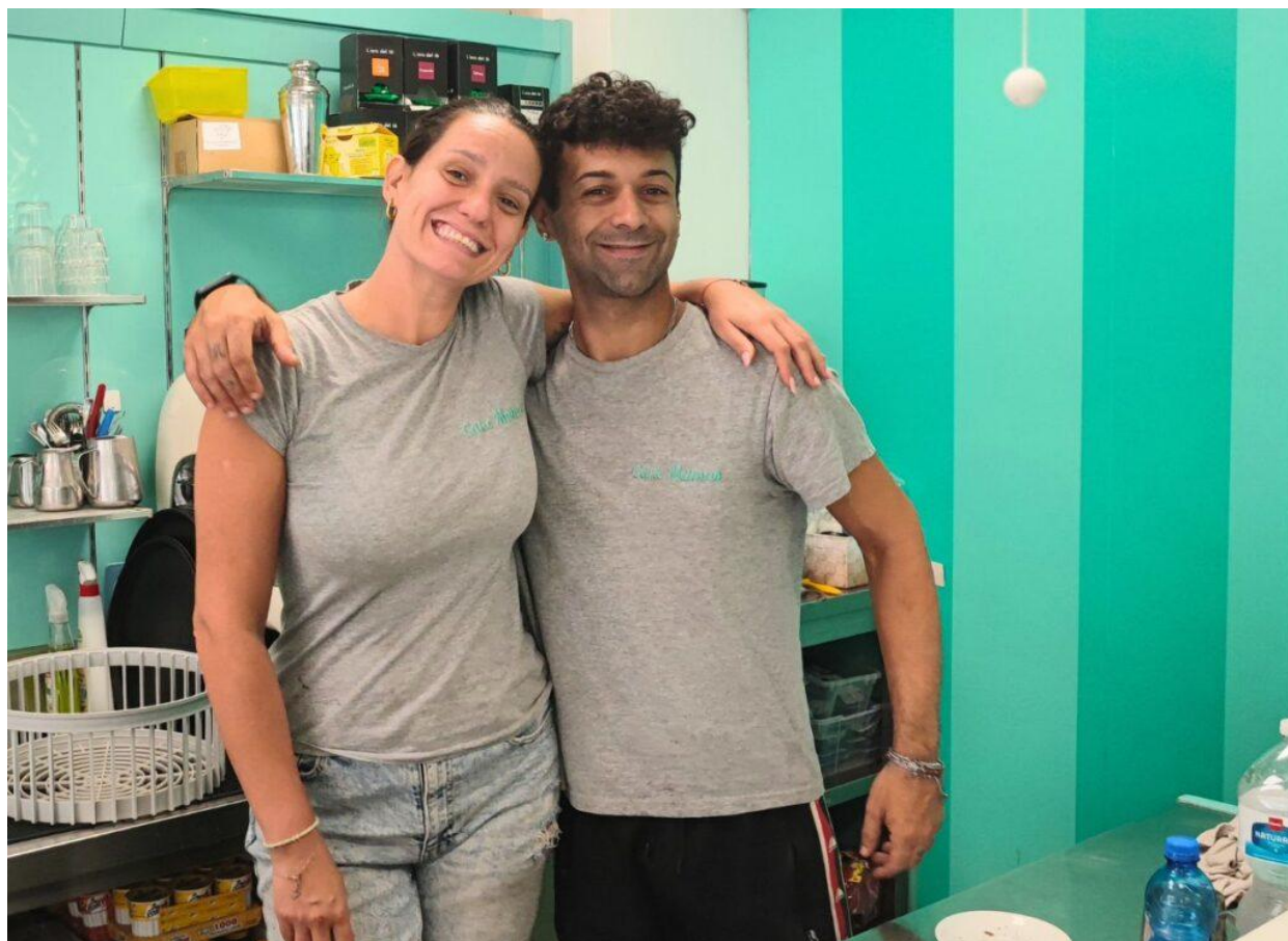
Il personale del Cake Mamas, in via Roma 145.

Ci siamo stati più volte per la colazione e possiamo consigliarlo per il rapporto qualità-prezzo e la simpatia del personale. I croissant , grandi e dalla sfogliatura soffice (1,50€) possono essere farciti su richiesta con creme o cioccolato; ottimi i bomboloni , le girelle e il pain au chocolat (1,80€). Il caffè costa 1,20€ e il cappuccino 1,50€. Pochi i tavoli per sedersi ma anche in questo caso il servizio al tavolo è gratuito .