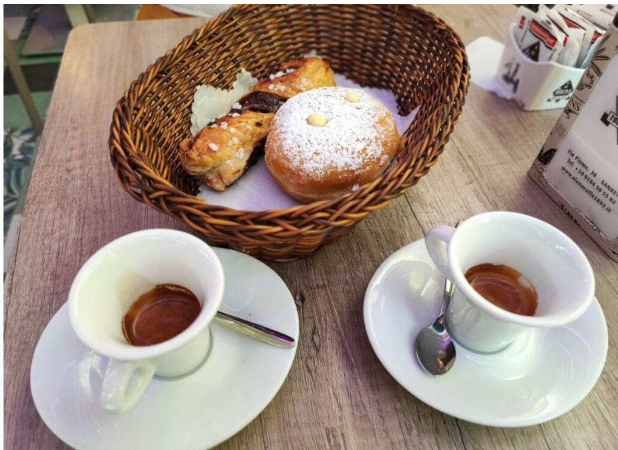
Una colazione da Dulcis & Dulcis.

Rispetto alla qualità dell'offerta i prezzi sono onesti : caffè a 1.50€, krapfen a 1.50€ e treccia mela e cannella a 2€. Il servizio al tavolo , garbato e rapido, non prevede alcun supplemento : una scelta che merita di essere segnalata.