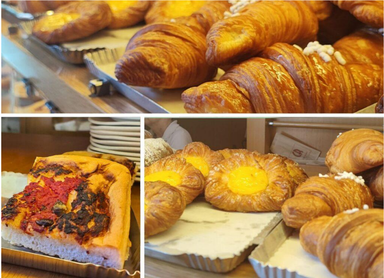
Proposte dolci e salate del Café Renaissance (Foto © Enzo Radunanza).

La proposta è abbondante, dolce e salata , ovviamente artigianale. Abbiamo pagato 8,50€ per un caffè, un cappuccino e due brioche: tenendo conto che è previsto un supplemento per il servizio al tavolo ci sembrano prezzi onesti per un locale in pieno centro, con personale numeroso, efficiente e motivato. Una curiosità: è stato l'unico bar visitato a Sanremo che ha offerto un goccio d'acqua senza averlo chiesto, un'abitudine che non abbiamo riscontrato altrove.