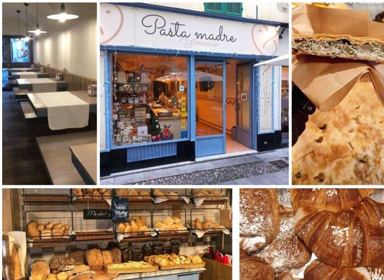
Qualche "assaggio" di Pasta Madre.

da asporto oppure da consumare nei pochi tavoli collocati all'interno e all'esterno del locale. I titolari gestiscono anche il punto di vendita storico in corso Matuzia.