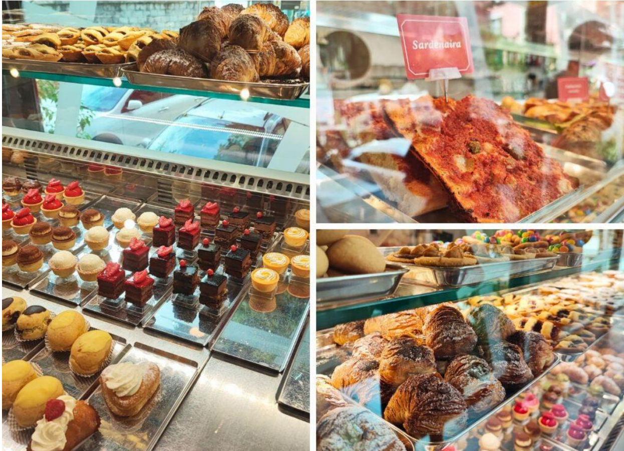
Una piccola parte della vetrina di Dulcis & Dulcis.