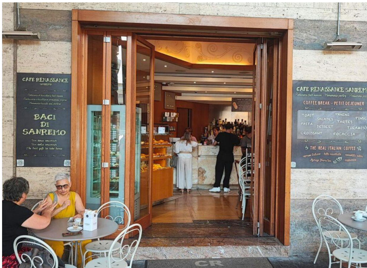
L'ingresso del Café Renaissance.

La classicità del contesto ne racconta la storia e l'anima: legno, specchi, marmi, sedie imbottite e un grande bancone come ne sono rimasti pochi in circolazione. Numerosi i tavoli, sia all'interno che sotto i portici, dove cittadini e turisti si intrattengono come in un salotto chic.