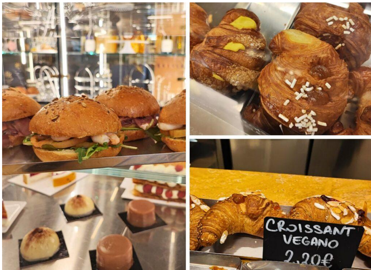
Il bancone di Brancaccio (Foto © Enzo Radunanza).

I prezzi sono superiori alla media , con supplemento per il servizio al tavolo ( per il banco : caffè a 1,30; krapfen piccolo a 1,80; croissant 2,20€). Il personale, in numero adeguato al locale, è cortese anche se appare talvolta sotto pressione, nei momenti di maggiore affluenza, in particolare l'addetto alla macchina del caffè.