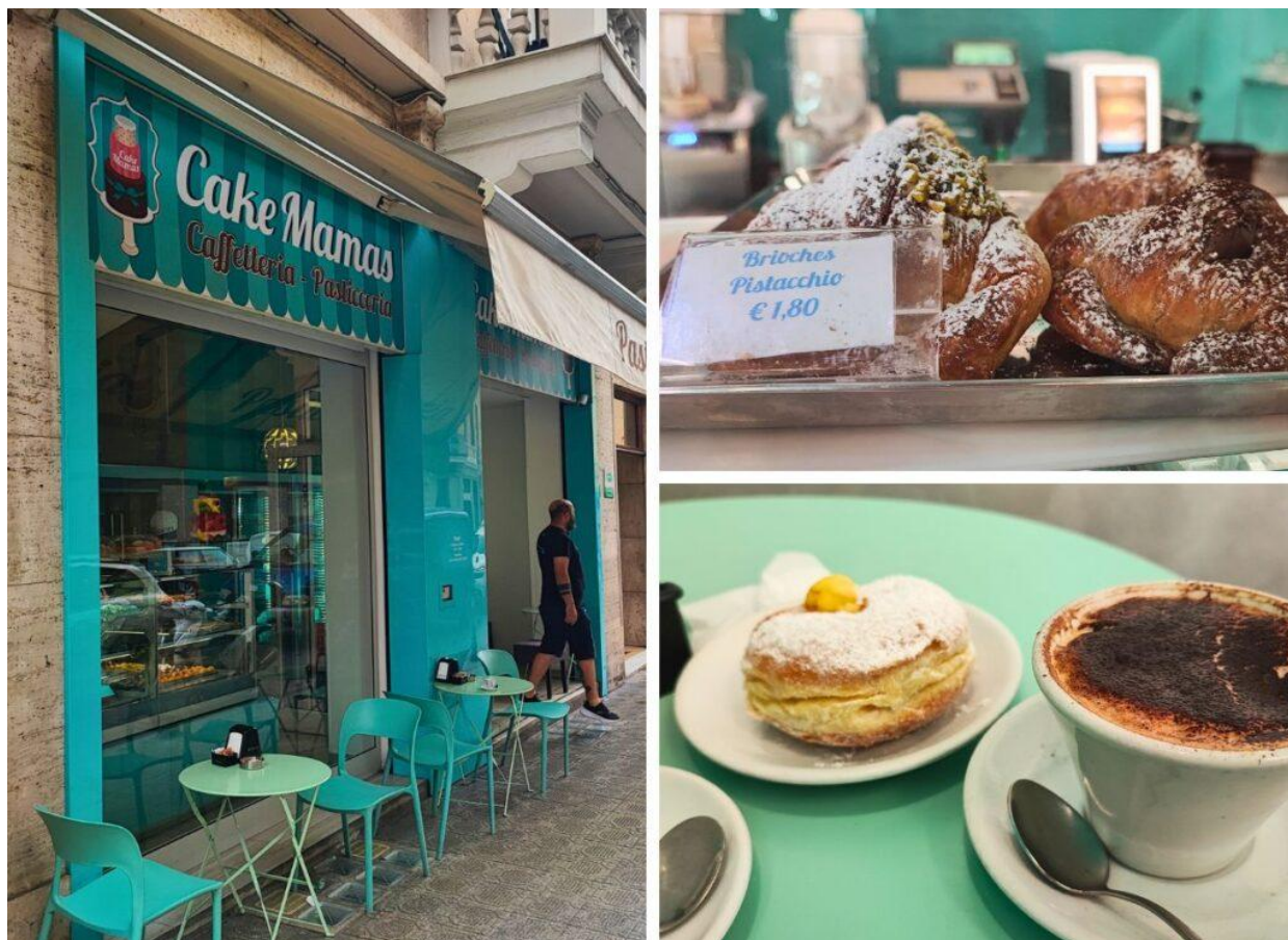
L'esterno e alcune proposte.