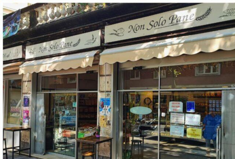
Alcuni prodotti di Non solo pane e l'ingresso della bottega in Corso Garibaldi.

In un panorama gastronomico dove si rincorrono le novità e gli stessi locali fanno a gara per essere sempre più eleganti ed esclusivi, “Non solo Pane” è una sosta sincera , una garanzia rassicurante, una bottega di altri tempi dove la memoria del gusto incontra la quotidianità di chi lavora con le mani e con il cuore.