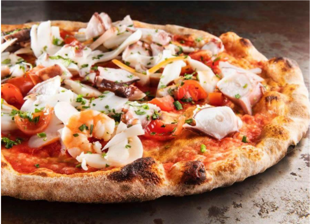
Terra e mare in una delle pizze di Grotta Azzurra.