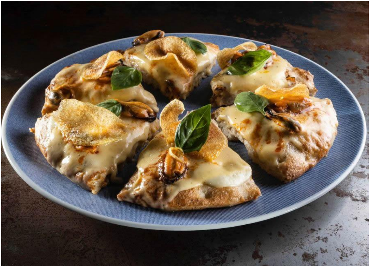
Pizza Quattro Formaggi 2.0.