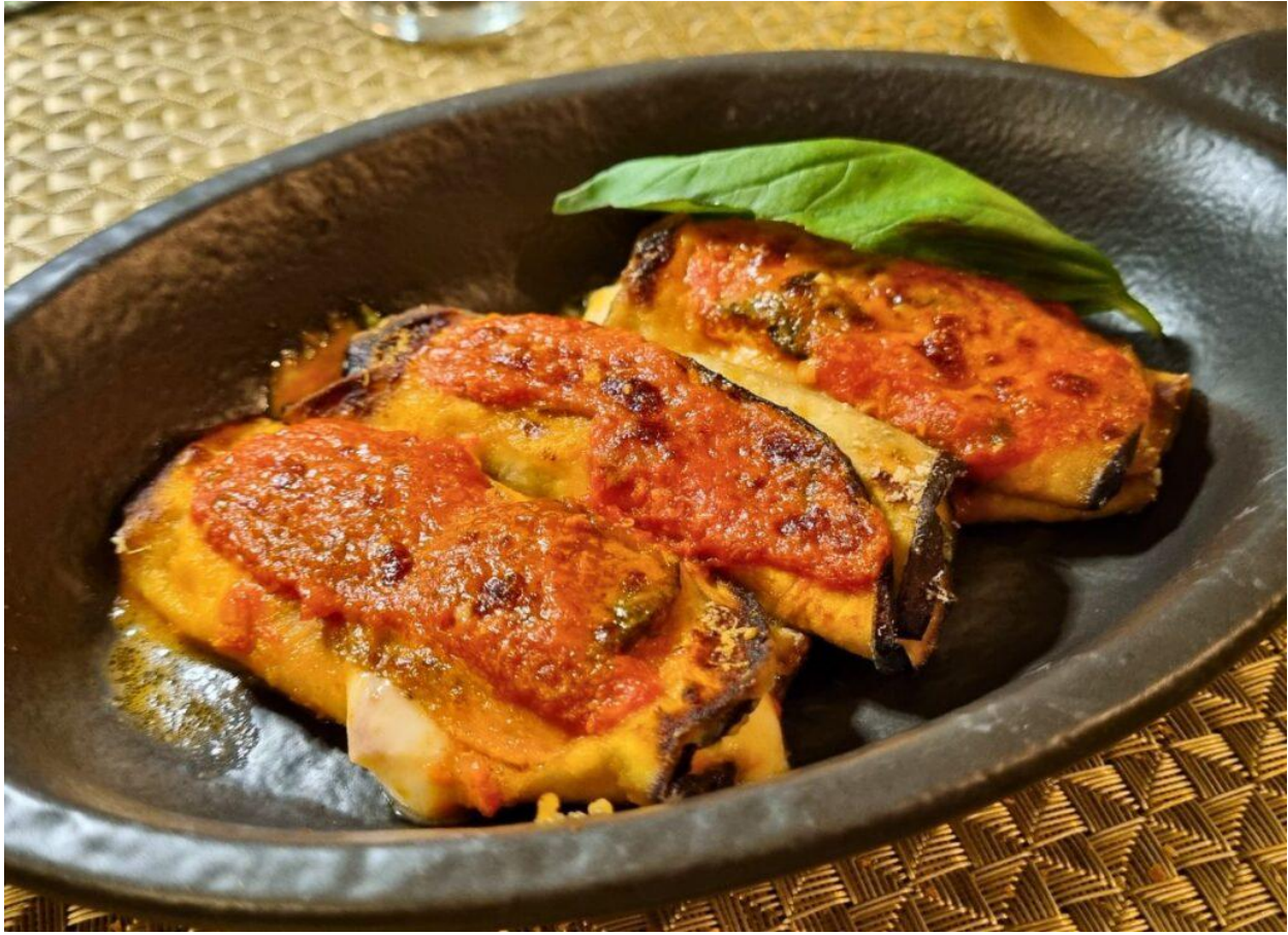
Fagottini di melanzane con fior di latte e pomodoro fresco.

I primi piatti del Grifoncino esaltano la pasta fatta a mano e le ricette della tradizione. Gli gnocchetti fiuggini al tonno di Ponza raccontano una storia antica: nato come “piatto povero” con tonno conservato sott’olio, oggi viene proposto dal Grifoncino con gnocchetti di acqua e farina di grano duro lavorati a mano e tonno selezionato.