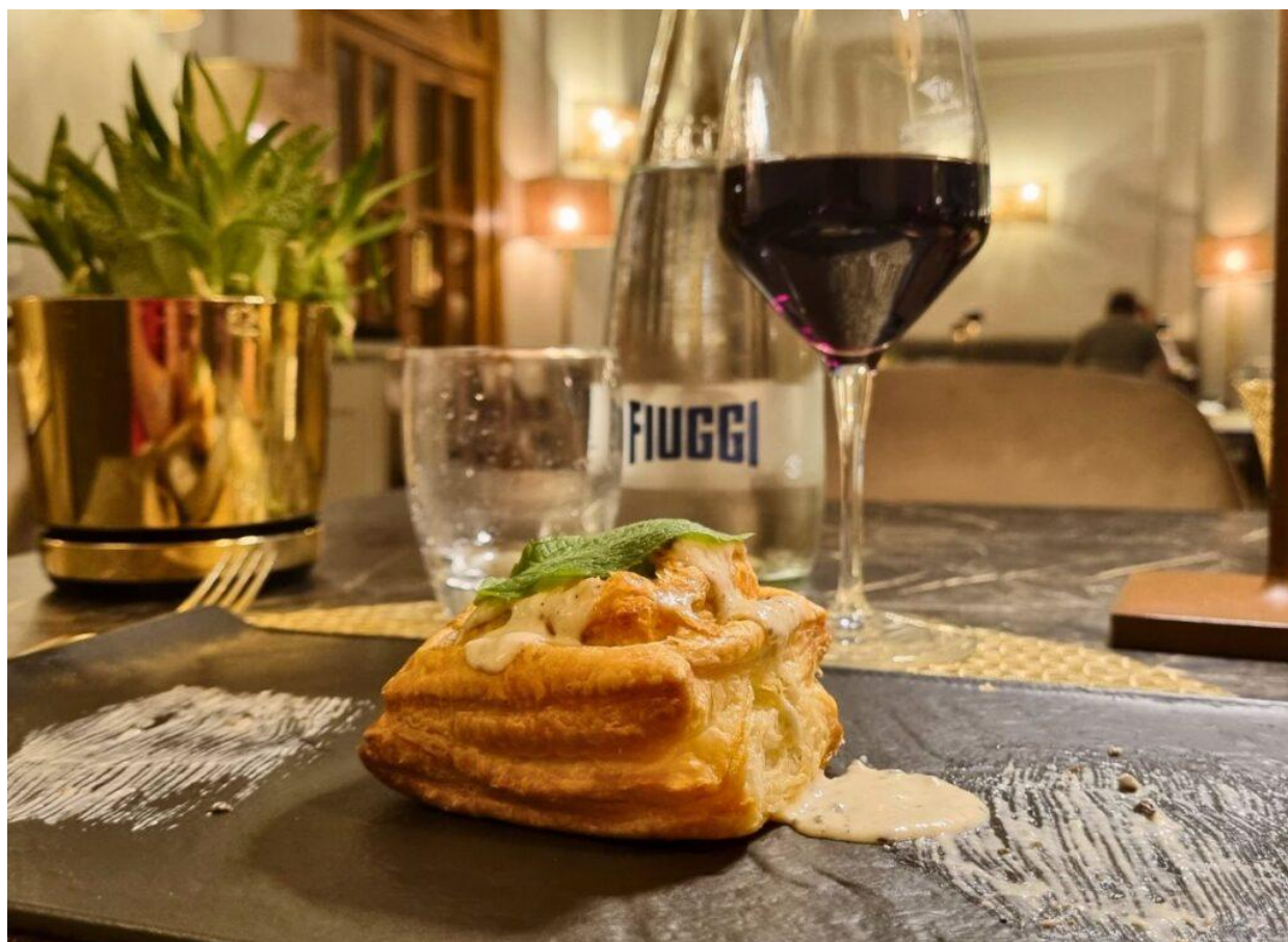
Srigno di sfoglia con fonduta di parmigiano al tartufo nero di Campoli.

Quando cala la sera, il Grifoncino rivela il suo lato più gourmet con il menù à la carte, che celebra la tradizione laziale e ciociara con tocchi creativi. Tra gli antipasti, spiccano l' antipasto a km0 con Prosciutto crudo di Guarcino, primo sale di Fiuggi alla griglia, bruschetta ai pomodorini di Fondi, bruschetta con crema di olive alla mediterranea, verdure alla contadina provenienti da produttori locali.