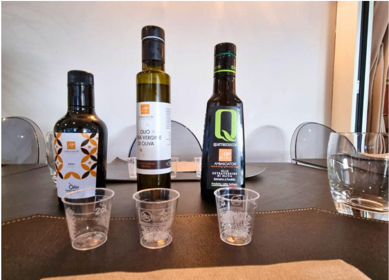
Alcune etichette di olio evo inserite nel percorso degustazione.