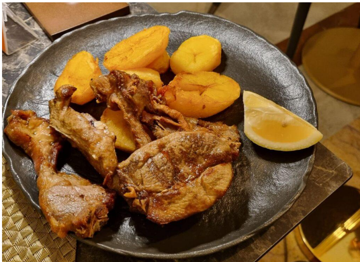
L'abbacchio a scottadito con patate al forno.

La carta dei dolci conclude il percorso con un tocco di tradizione e golosità: il tris di dolcetti secchi – ciambelline al vino, tozzetti e pampepato di Fiuggi con cioccolato fondente, frutta secca e miele – e la Millefoglie alla crema , con sfoglia croccante e crema chantilly, arricchita a scelta da frutti di bosco o scaglie di cioccolato fondente.