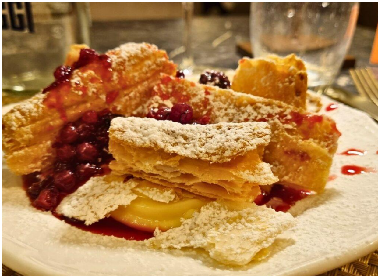
Millefoglie alla crema.

Dopo cena, il bar dell'Ambasciatori Place Hotel invita a momenti di relax e convivialità, tra cocktail, amari alle erbe e grappe, ispirati alle ricette tradizionali dei monaci della vicina Certosa di Trisulti , come l' Elixir al finocchio .