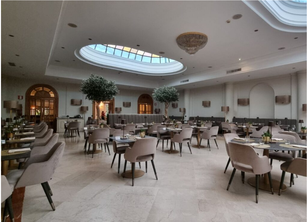
La sala del Ristorante Il Grifoncino.