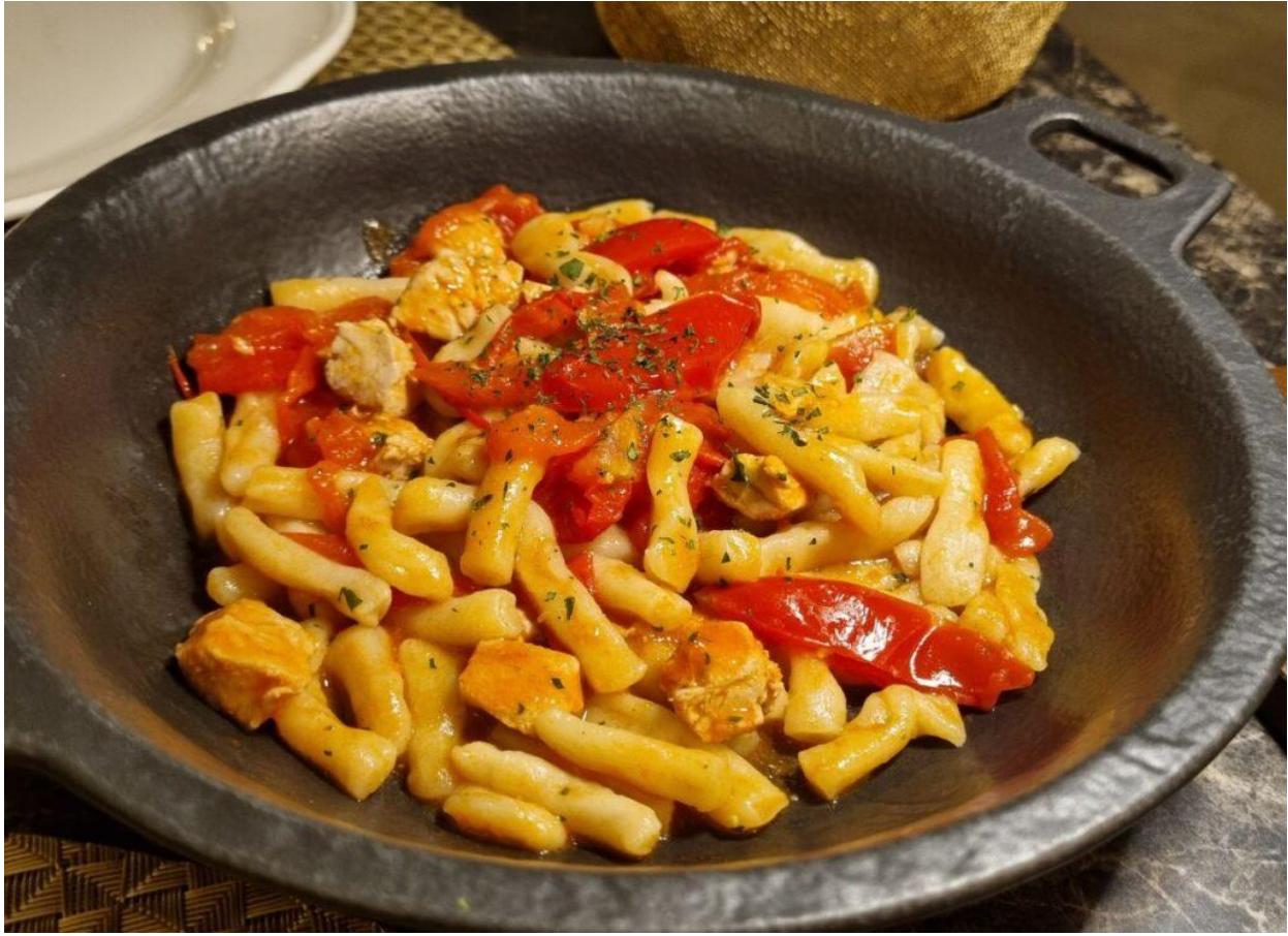
Gnocchetti fiuggini al tonno di Ponza (Foto © Sara Panizzon).

Il menù propone anche gli strozzapreti all'amatriciana che rispettano fedelmente la tradizione laziale e i tagliolini asparagi, guanciale e pomodorini .