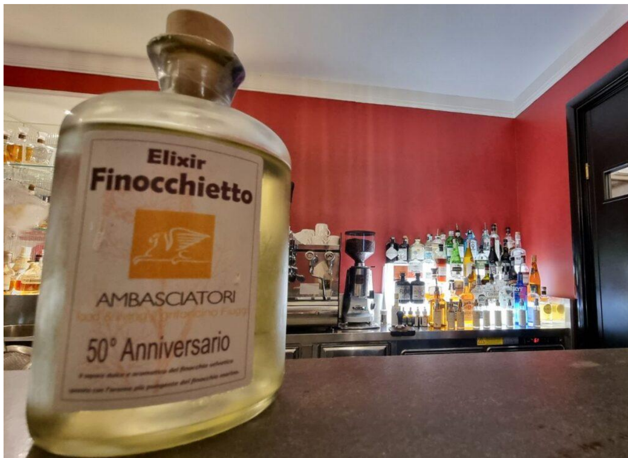
Elixir al finocchietto.